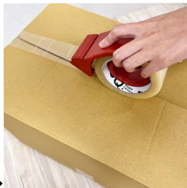
用 胶带 “封箱” →