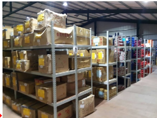
仓库里有七十排的 货架 →