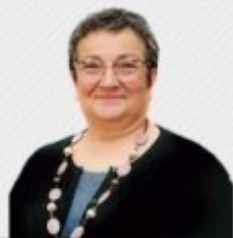
Margarita Correia 03 Maio 2021 — 00:17

C elebra-se esta semana o Dia Mundial da Língua Portuguesa. São muitos os eventos agendados, os discursos e palavras bonitas. Temos muitas razões para celebrar. Nos últimos anos, a língua portuguesa cresceu e percorreu caminhos ainda há pouco inimagináveis. Em Portugal, porém, nem todos partilham deste entusiasmo.