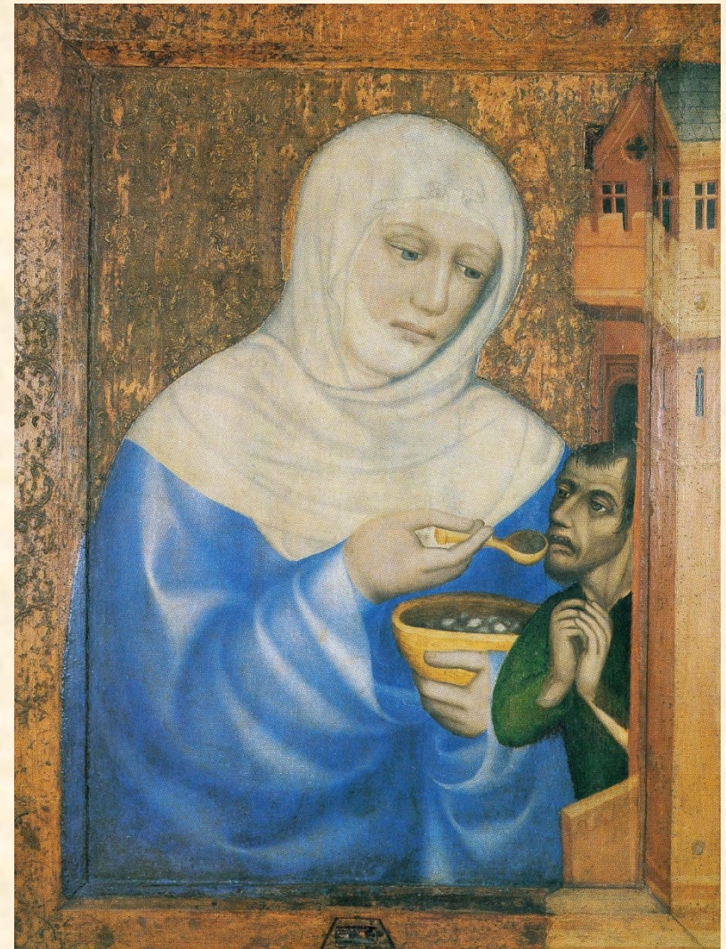
Sv. Alžběta Durynská/Uherská