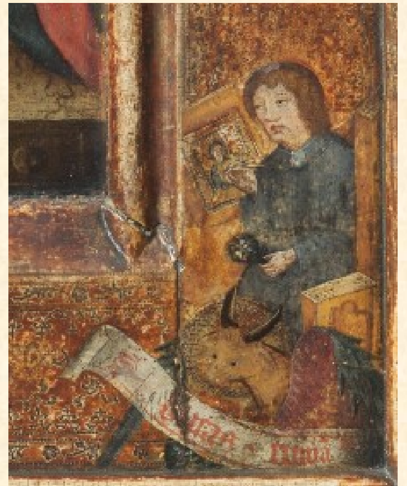
Sv. Lukáš maluje Pannu Marii