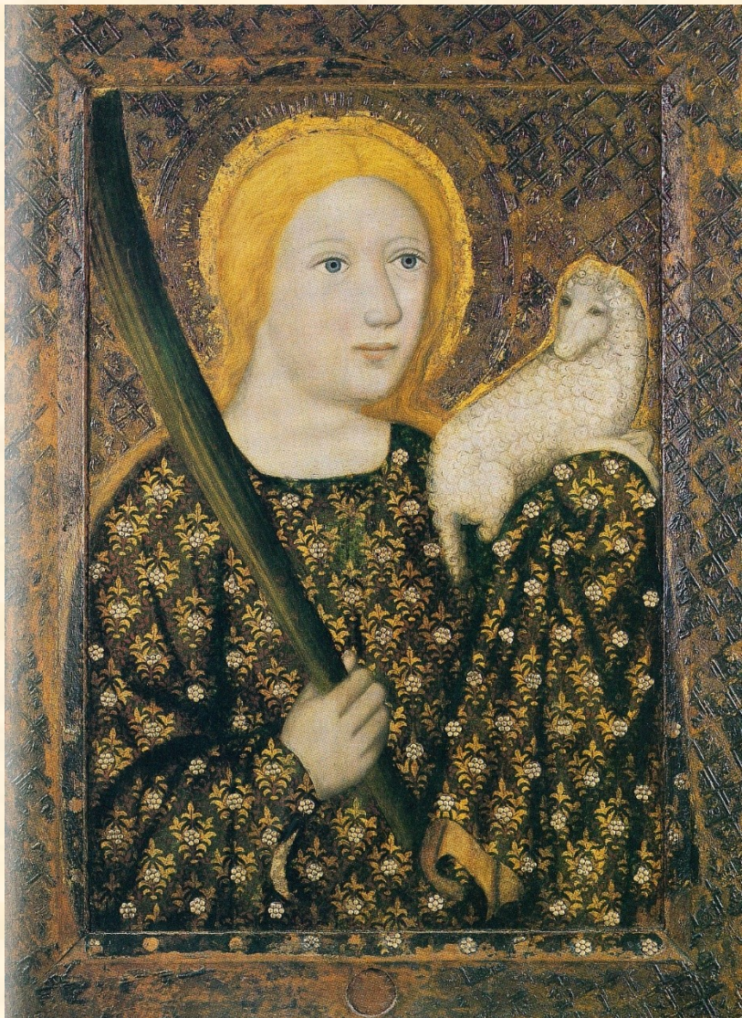
Sv. Anežka Římská