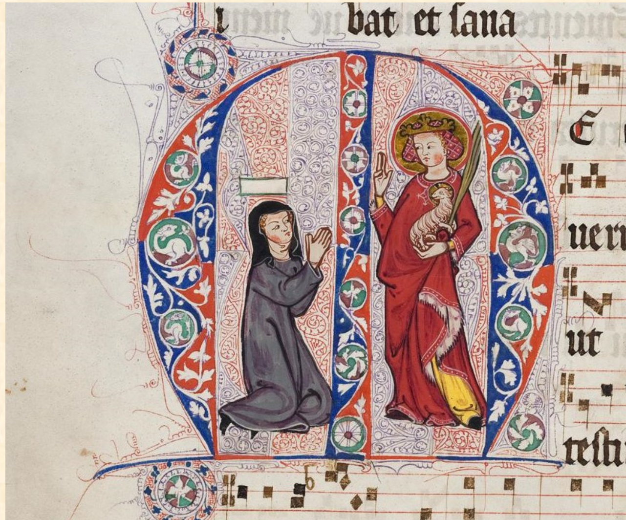
SV. Anežka Česká a sv. Anežka Římská