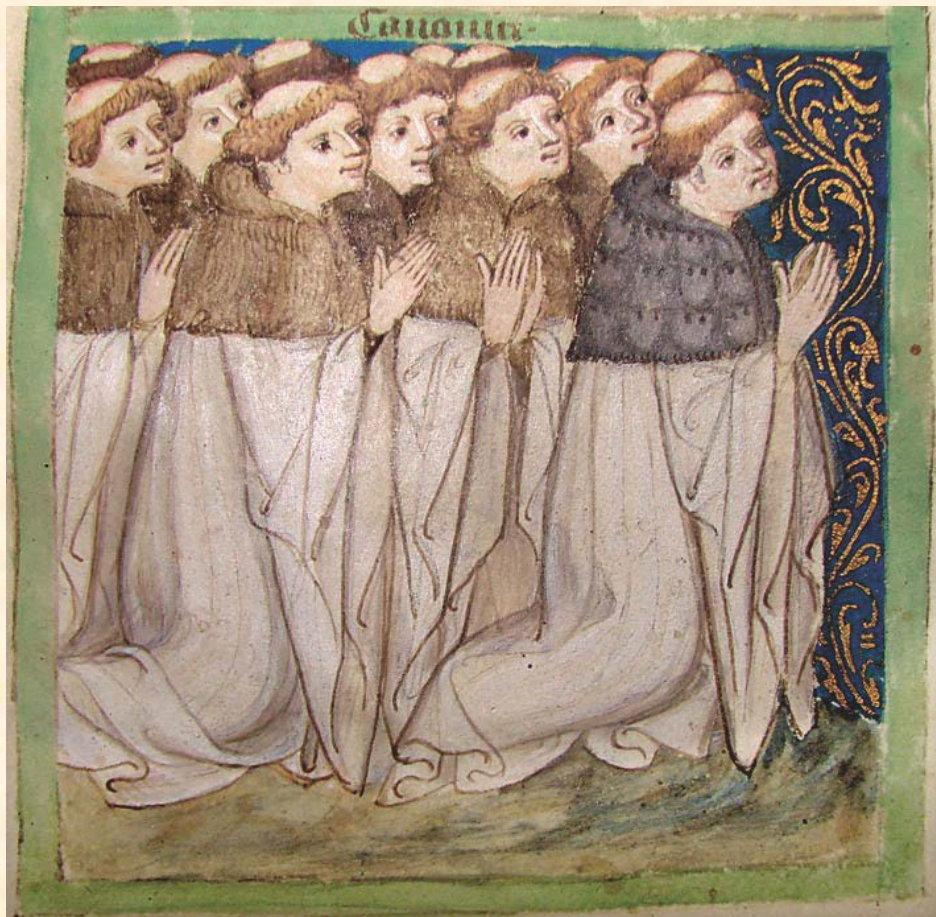
Kanovníci v čele s proboštem (almuce)