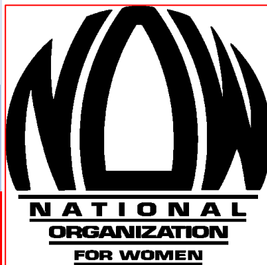
NOW (National Organisation for Women)