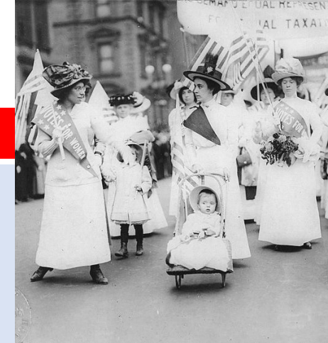
Demonstrace sufražetek v New Yorku (1912)

= Od roku 1918 je ženám ve většině států přiznáno volební právo (Anglie: od roku 1928 právo hlasovat a ucházet se o politické zastupitelství)