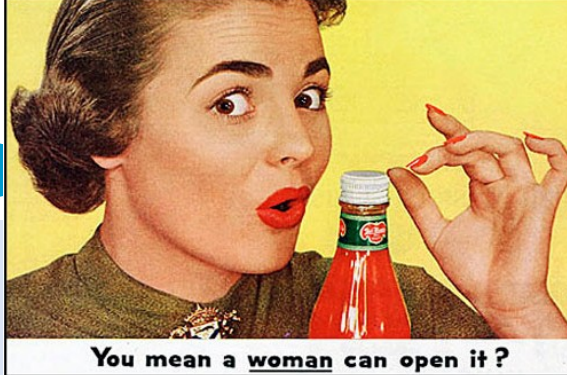
Typicky sexistická americká reklama z 1950tých let Del Monte Company (1953)

= Jedná se o jednu z nejlivnějších knih 20. století