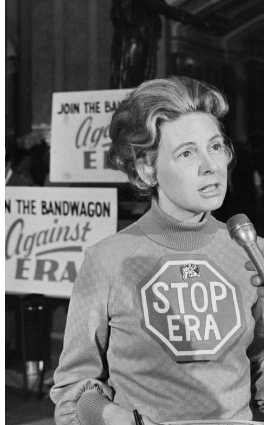
Jedna z neaktivnějších odpůrkyň rovnoprávnosti v Americe, Phyllis Schlafly, 1972

III. Chcete takové ženy? Vývoj feminismu