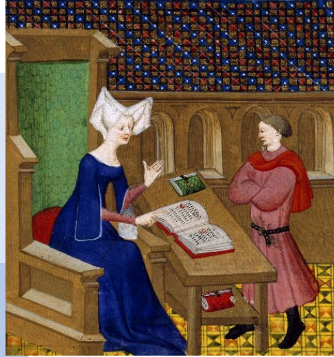
Christine de Pizan se svým synem Jeanem de Castel (bedfordský mistr)