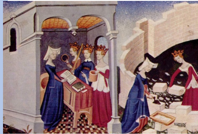
Miniatura v pařížském rukopise Cité des Dames (počátek 15. století, Mistr Cité des Dames)

= Rozpoutává tak literární „Querelle du Roman de la rose“ (spor o románu o růži) v němž rozebírá klerikem znetvořený obraz žen