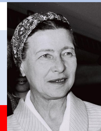
Simone de Beauvoir (1908-1986)