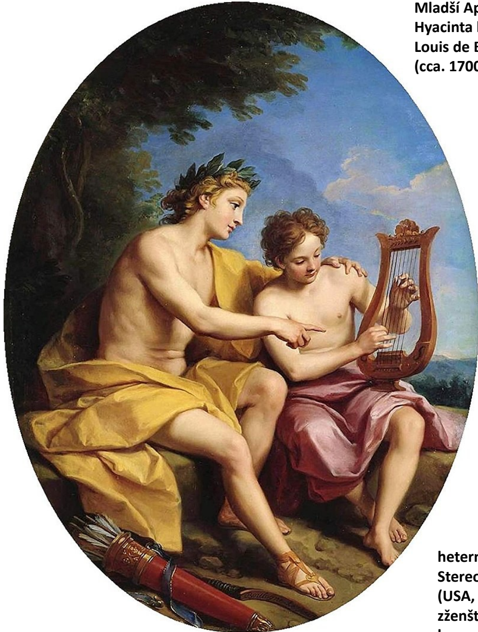
Mladší Apollón učí Hyacinta hrát na lyru - Louis de Boullogne (cca. 1700)

heternormativní Stereotypizace (USA, cca. 1950) zženštlý homosexuál