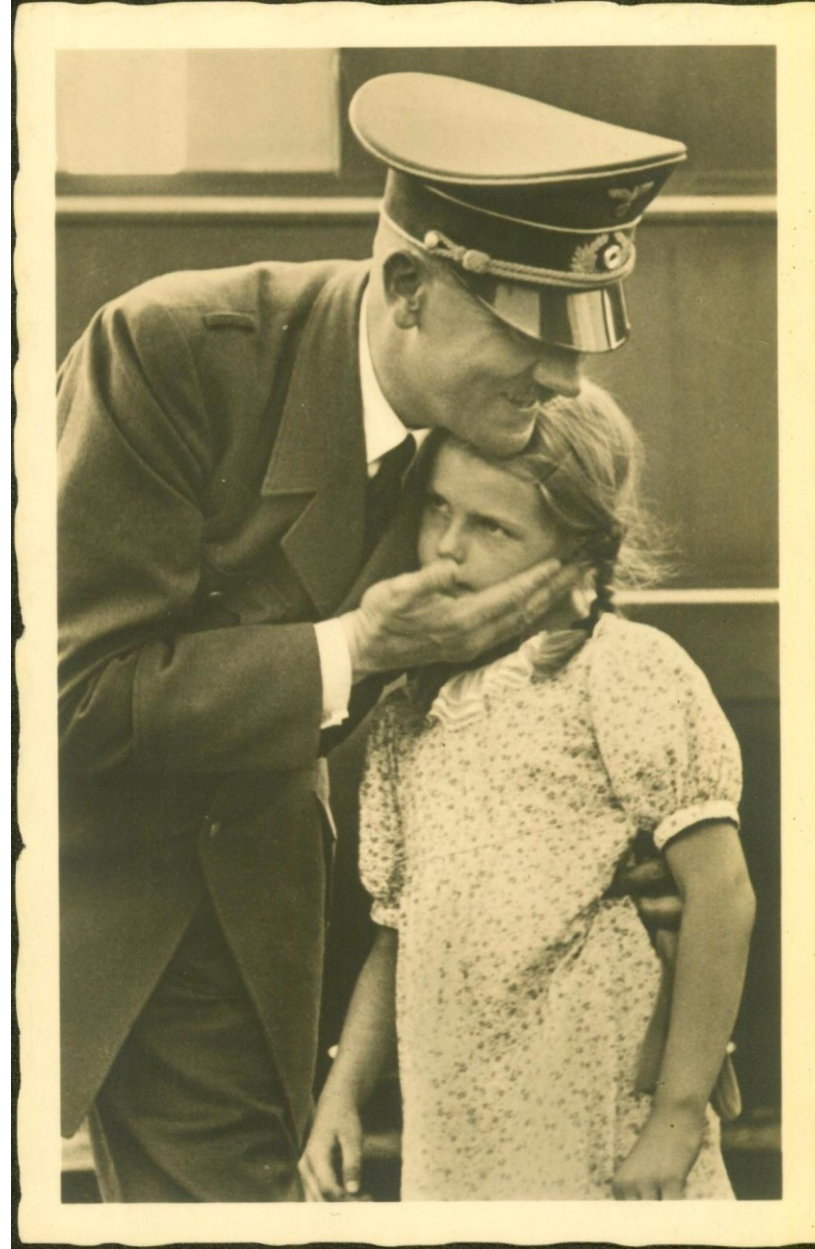
Adolf Hitler a dívka