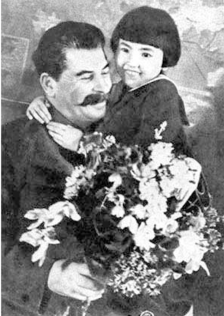
Josef Stalin, kamarád všech dětí (propaganda, 1936)