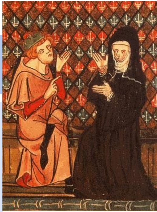
Abélard s Héloïsou, francouzský rukopis ze 14. stol.

= Na druhé straně to dráždilo starší mistry, kteří mu možná záviděli a občas i bránili v samostatných přednáškách