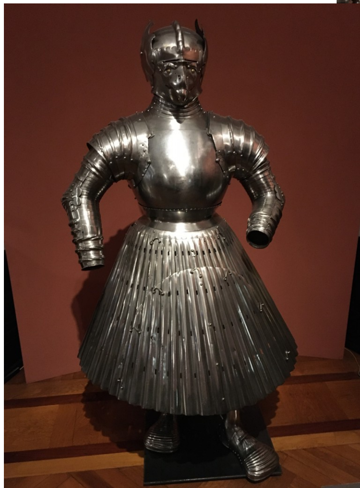
Kostýmová zbroj Albrechta Hohenzollern- ského, zhotovená u příležitosti jeho sňatku s Dorotou Dánskou (1526)