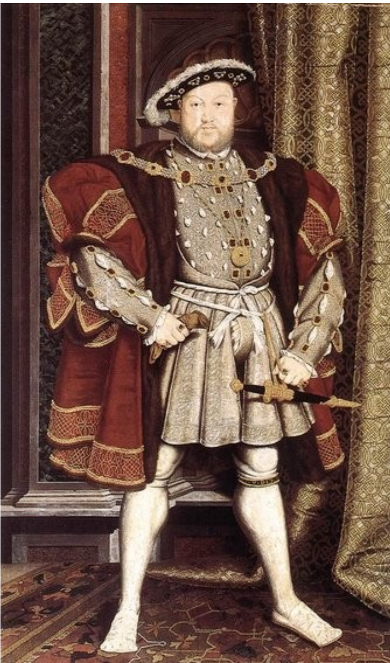
Hans Holbein, anglický král Jindřich VIII.