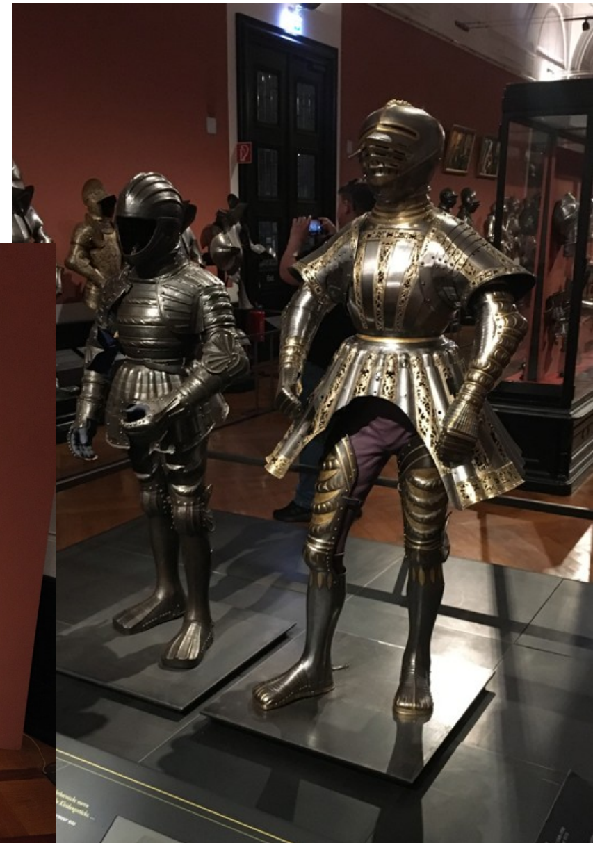
Chlapecké brnění; dvě brnění pro mladého Karla V., objednané jeho dědečkem Maximilianem I.