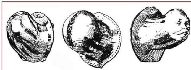
Chránič mužského pohlaví, cca. v modě do konce 16. stol.