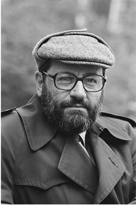
Umberto Eco 1932-2016