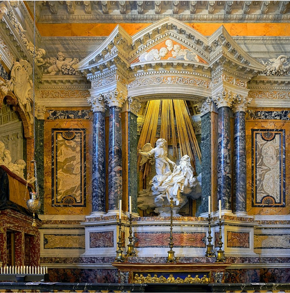
Extáze Sv. Terezy z Avily (1515-1582) Kostel Santa Maria della Vittoria v Římě (Cornarova kaple), Giovanni Lorenzo Bernini, cca. 1645-52