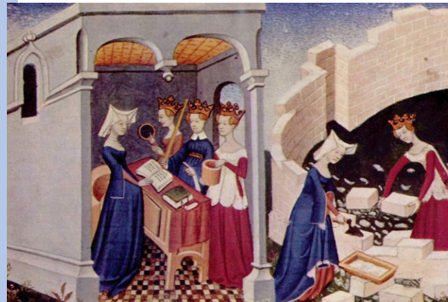
Miniatura v pařížském rukopise Cité des Dames (počátek 15. století, Mistr Cité des Dames)

= Rozpoutává tak literární „Querelle du Roman de la rose“ (spor o románu o růži) v němž rozebírá klerikem znetvořený obraz žen