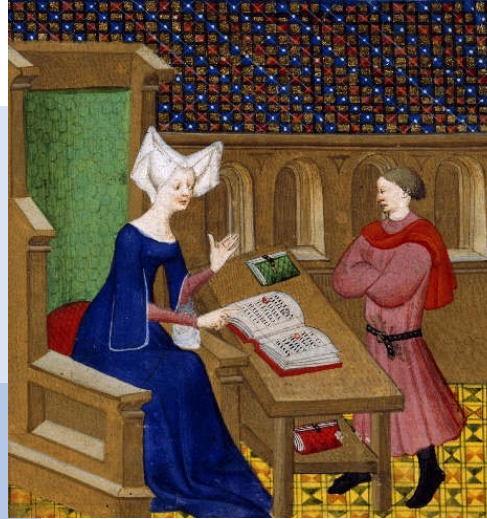
Christine de Pizan se svým synem Jeanem de Castel (bedfordský mistr)