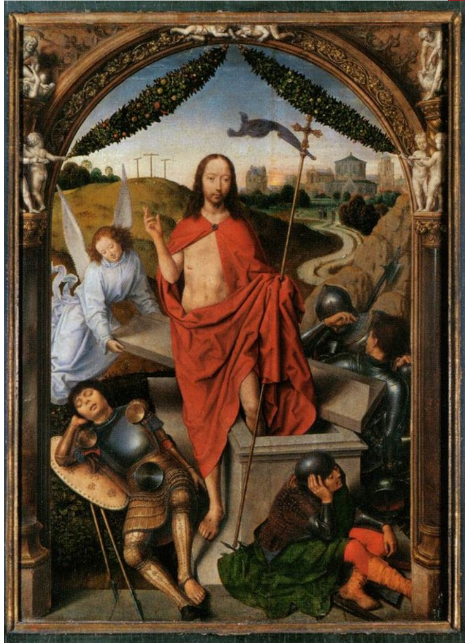
Hans Memling (cca. 1430-1492); Kristovo vzkříšení, cca. 1490