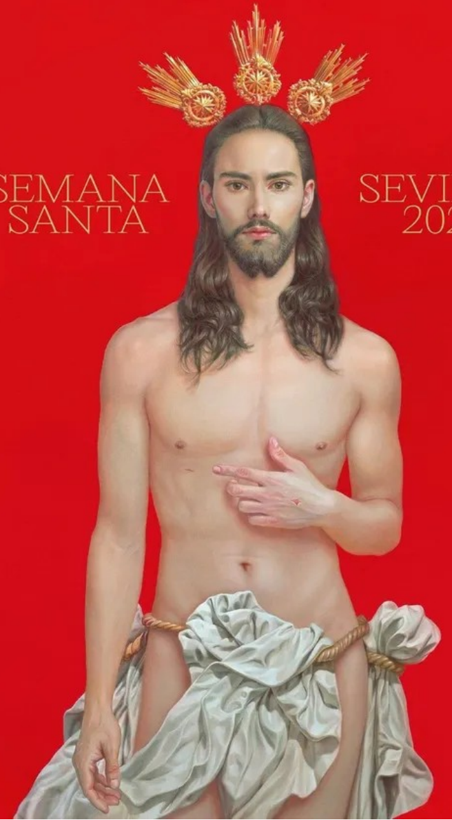
Kristus a kontroverze: Plakát pro Svatý týden 2024 v Seville od Salustiana Garcíi