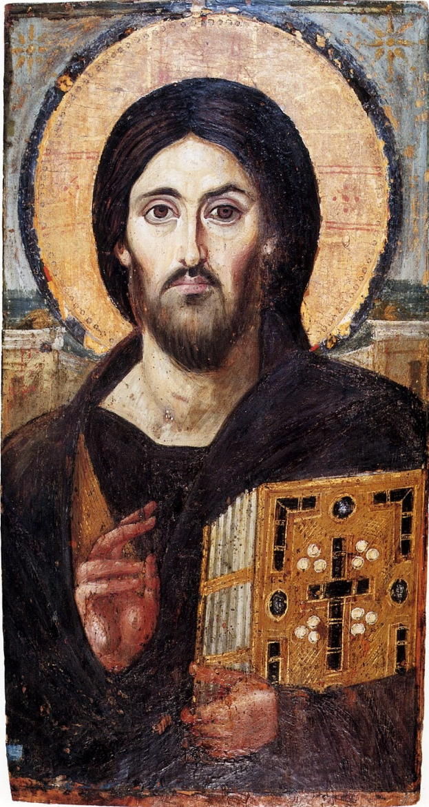
Kristus Pantokrator z kláštera svatě Kateřiny na Sinaji (cca. 6 stol. n. l.)