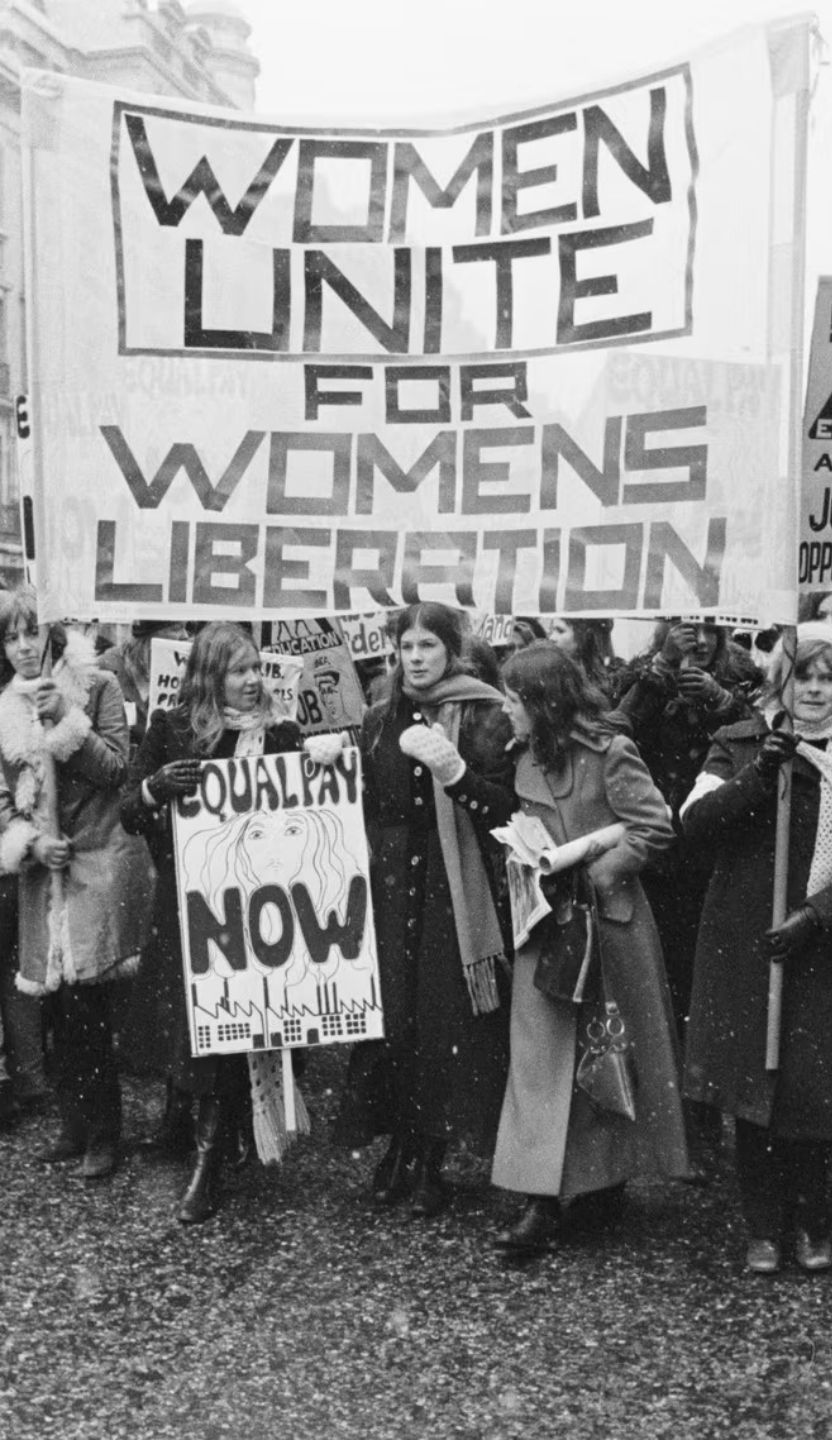
Protest ženských odborů v Londýnském Hyde Parku, 6. březen 1971