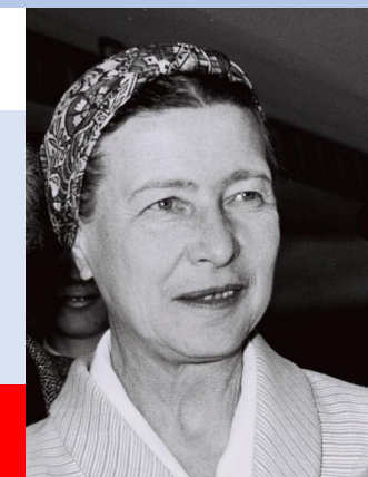
Simone de Beauvoir (1908-1986)