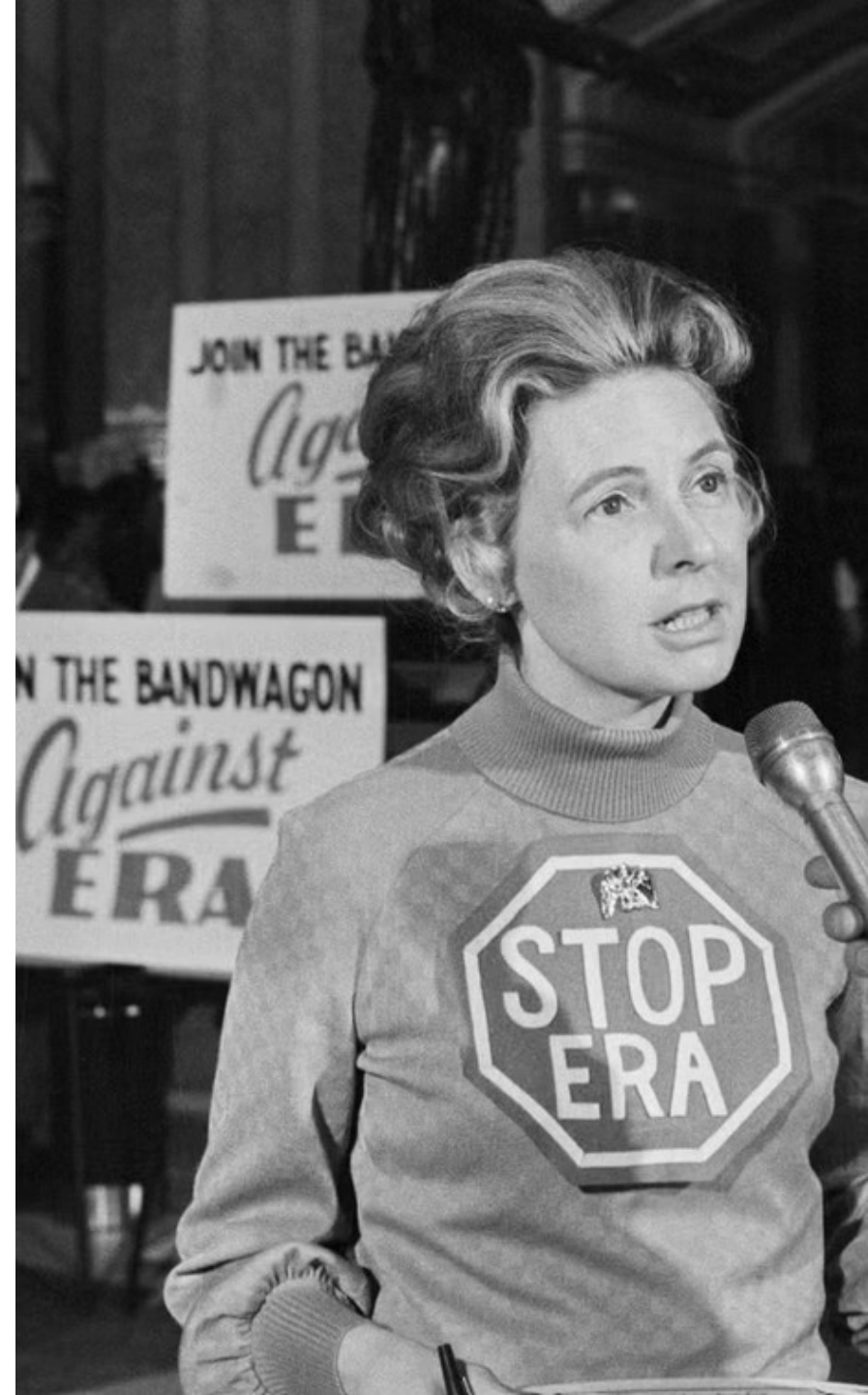
Jedna z nejaktivnějších odpůrkyň rovnoprávnosti v Americe, Phyllis Schlafly, 1972

III. Chcete takové ženy? Vývoj feminismu