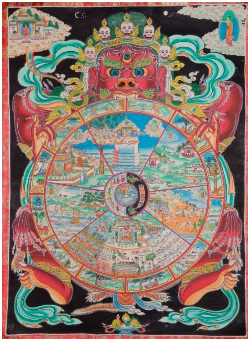
Obr. 3: Bhavačakra – tibetská kolorovaná xylografie.

probuzení, doména smrti, sansára, je pro něj od té chvíle pouze místem, kde lze předávat nauku, kde lze ze soucitu s ostatními bytostmi po dobu určenou trváním tělesné schránky přebývat.