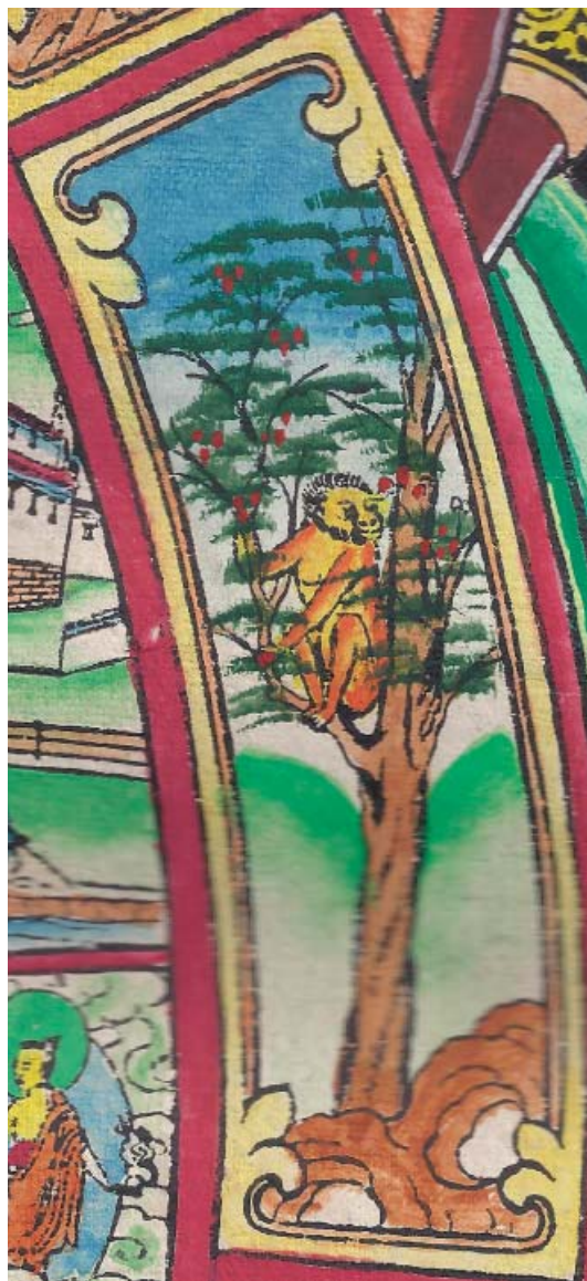
Obr. 15: Řetězec podmíněného vznikání (skrt. Pratītyasamutpāda ). 3. Opice představuje vědomí (skrt. viđžňána , tib. namše /rnam šes/ ). Na obrázku sedí v koruně stromu a živí se jeho plody.