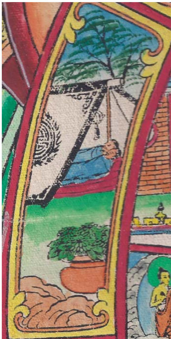
Obr. 22: Řetězec podmíněného vznikání (skrt. Pratītyasamutpāda ). 10. Žena symbolizující pohlavní styk představuje nové vznikání, znovuzrození nebo dozrávání ke znovuzrození (skrt. bhava , tib. sipa /srid pa/ ). Na obrázku koitus patrný není, pod typickým tibetským pasteveckým stanem ve tvaru písmene „A“ leží vedle sebe muž a žena. Zajímavým detailem je velká nádoba – květináč s vegetací v popředí.