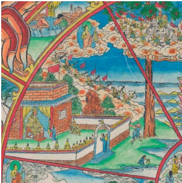
Obr. 6: Bhavačakra – říše polobohů.

Říše polobohů či polobožstev, duchů (skrt. asura , tib. lhamajin / lha ma jin /, mong. asuri nebo tenger biš ), zahrnuje potměšilé bytosti velmi podobné bohům či božstvům, kteří jsou však s nimi v neustálém konfliktu. Tibetský termín doslova znamená „ne-bohové“. Jsou známí i jako „titáni“ a někdy bývají jako gati přiřazováni k dobrým, jindy ke špatným zrozením (skrt. apája ). Asurové chápaní jako dobrý stav představují božstva,