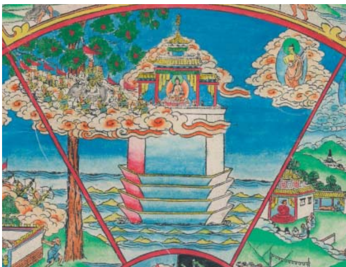
Obr. 5: Bhavačakra – říše bohů.

Vrchní část zobrazení je říše bohů, či božstev (skrt. déva , tib. lha /lha/ , mong. tenger nar ), zahrnující bytosti ve třech oblastech: a) světě nebeských forem (skrt. rúpadhátu , tib. lgzugs khams/ ), b) světě bez forem (skrt. arúpadhátu , tib. lgzugs med khams/ ) čili duchů bez formy a c) světě smyslové touhy (skrt. kámadhátu , tib. l'dod khams/ ), kde se vyskytuje šest kategorií bohů nacházejících se ve smyslovém světě.