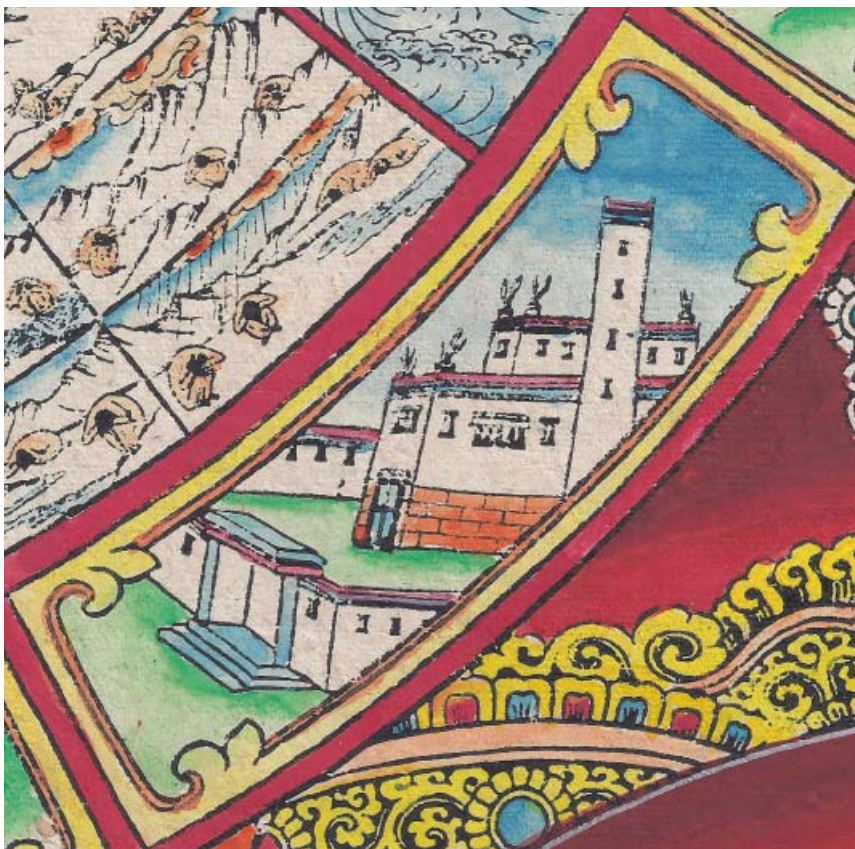
Obr. 17: Řetězec podmíněného vznikání (skrt. Pratītyasamutpāda ). 5. Obydlí se šesti okny.

Obydlí se šesti okny představuje šest smyslů, šestero základů, přesněji řečeno pět smyslů a mysl, dům se vchodem a pěti okny (skrt. śadājatana , ājatana , tib. kjeche /skje mched/ ). Na obrázku je typická tibetská stavba, gönpa (tib. /dgon pa/ ), což je opevněný klášter v horách. Stavba sice nemá jen pět či šest oken, jak předpisuje výtvarný kánon Pratītyasamutpādy , zato je dobře patrná fortifikace, jakož i vysoká věž. Na rozích střech jsou taktéž patrní „lapači démonů“, cändö (tib. /bcan mdos/ ), což jsou zpravidla na střeše umístěné ochranné ozdoby.