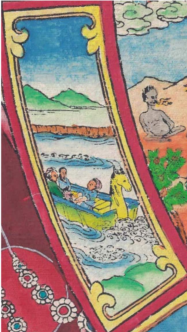
Obr. 16: Řetězec podmíněného vznikání (skrt. Pratītyasamutpāda ). 4. Muž na loďce představuje jméno a tvar, tělesno a duševno, tělo a ducha, pojmenování a tvar (skrt. nāmarúpa , tib. mingzug /min gzugs/ ). Na obrázku je zvláštní hranatá loď s koňskou hlavou na přídi; veslař je v popředí a dva pasažéři sedí blíže zádi lodi.