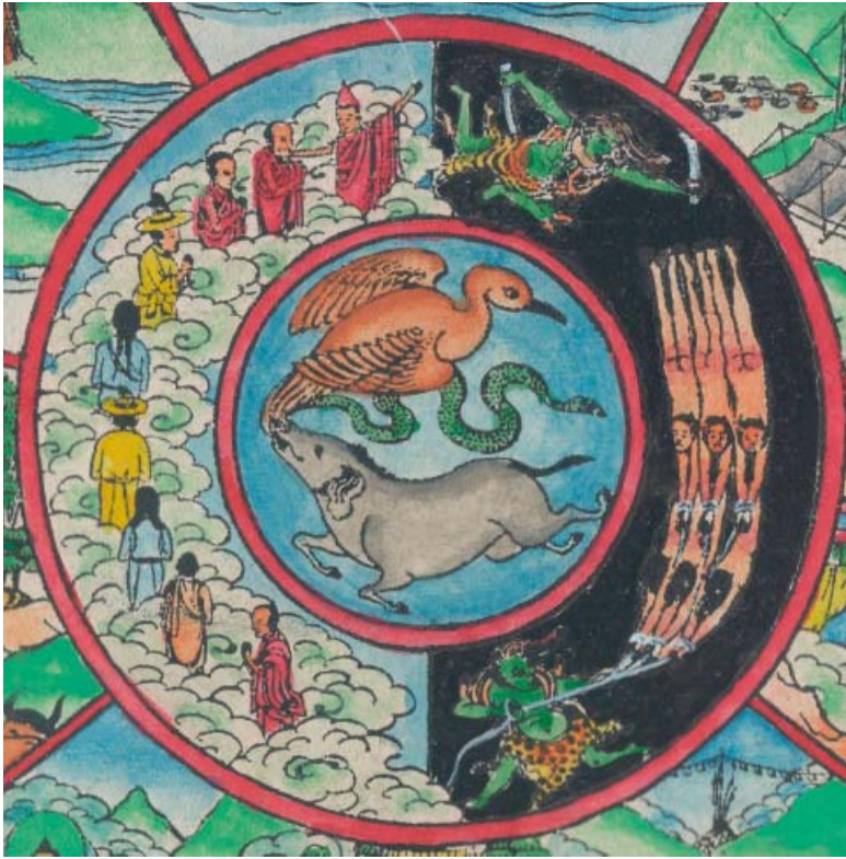
Obr. 4: Bhavačakra – tři kořeny zla.

Co tedy na zobrazení kola života vidíme a jak to můžeme dešifrovat? Začneme od vnějšího okraje kruhového obrazu. Postava vznešené bytosti (někdy jich bývá zobrazeno více) vpravo nahoře symbolizuje naději, že každý může dosáhnout vysvobození z kola života, zbavit se existence, vymanit se z domény smrti. Jsou to arhati, siddhové, bódhisattvové a buddhové, kteří nám ukazují cestu, a dokonce i aktivně na ní adeptům nirvány napomáhají. Stojí mimo kolo existence, nepatří již do něj.