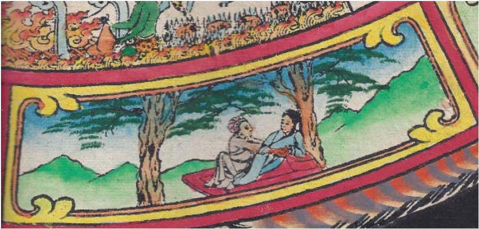
Obr. 18: Řetězec podmíněného vznikání (skrt. Pratītyasamutpāda ). 6. Muž a žena při milostném aktu představují dotek, kontakt se světem (skrt. sparśa , tib. regpa / reg pa ). Na obrázku pod dvěma stromy na lůžku je patrný pár v milostném objetí.