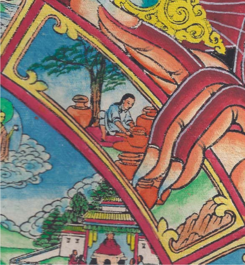
Obr. 14: Řetězec podmíněného vznikání (skrt. Pratītyasamutpāda ). 2. Hrnčír představuje tvořivé složky osobnosti, aktivitu, tedy podmíněné nebo určující činy (skrt. sanskāra , tib. duche /'du bjed/ ). Na obrázku je v plné práci na hrnčírském kruhu, obklopen svými výrobky.