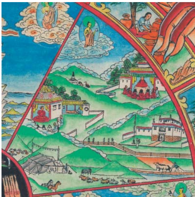
Obr. 7: Bhavačakra – říše lidí.

V říši lidí (skrt. manuṣja , tib. mi /míl/ , mong. chün ) je zcela nahoře zobrazen bódhi-sattva na obláčkách s almužní miskou, symbolem sanghy, v levé ruce. Pod ním v údolí pod horou je patrná stúpa s několika supy okolo. Z kontextu, totiž z posledního článku Pratítjasamutpády , je jasné, že se jedná o pohřebiště, tedy místo, kde se odehrávají