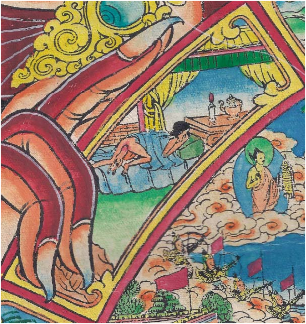
Obr. 23: Řetězec podmíněného vznikání (skrt. Pratītyasamutpāda ). 11. Rodička představuje zrození vedoucí k opakovanému roztáčení sansárického kola (skrt. džáti , tib. kjewa /skje ba/ ). Na obrázku je patrný porod, kdy žena neleží na zádech, jak je tomu zvykem u nás, ale naopak klečí na kolenou na posteli.