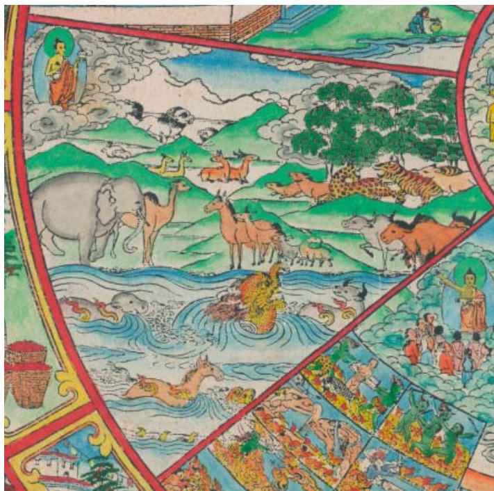
Obr. 8: Bhavačakra – říše zvířat.

Vedle říše lidí je to jediná bezprostředně viditelná říše v rámci bhavačakry pro obyčejné lidi. Ostatní říše nahlížíjí pouze ti, kdož k tomu mají schopnosti. Je to také první z trojice špatných zrození – není dobré být zvířetem z rozmanitých důvodů. V levém horním rohu je bódhisattva s nádobou v levé ruce. Nejbliže k němu jsou obyvatelé nejvyšších hor, mytičtí tibetští sněžní lvi, známí například z tibetské vlajky. Pod nimi, stále ještě v horách, se nacházejí sněžní králíci či zajáci. Na horských pláních jsou ještě nějaké bezrohé kozy či srny. Jsou tam i divocí koně a v lesním porostu se skrývají predátoři – levhart se skvrnitou kožešinou a pruhovaný tygr. Na břehu jezera je dobře patrný slon, velbloud či žirafa, koně, ovce a rohatá vysoká zvěř. Následuje vodní živočišstvo, reprezentované jak skutečnými zvířaty, tak i mytickými, jako je například makara , vodní obluda s menším chobotem, hřívou a nebezpečně ozubenou tlamou. Ve vodě plave i ohnivý buvol, ohnivý kůň a ohnivý hroch. Před koněm jsou vidět i vystrčené hlavy vodních hadů, možná želv. V této zvířecí říši nejsou zpodobněni žádní ptáci.