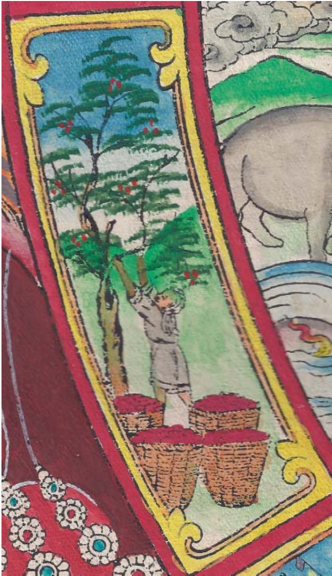
Obr. 21: Řetězec podmíněného vznikání (skrt. Pratītyasamutpāda ). 9. Člověk nebo někdy i opice trhající plody ze stromu představují lpění, uchopování, chtivost, ulpívání (skrt. upādāna , tib. lenpa /len pa/ ). Na obrázku je muž sklízějící plody ze stromu, vedle něj jsou čtyři vrchovatě naplněné koše představující úspěšnou úrodu.