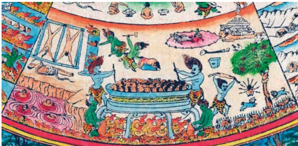
Obr. 12: Bhavačakra – peklo.

Těsně pod Jamovým posmrtným soudem je vlastní peklo, kde jsou nešťastníci rozmanitě trestáni mučením a trýzněním, které umožňuje odčinit si špatnou karmu a posléze dosáhnout možnosti lepšího příštího zrození.