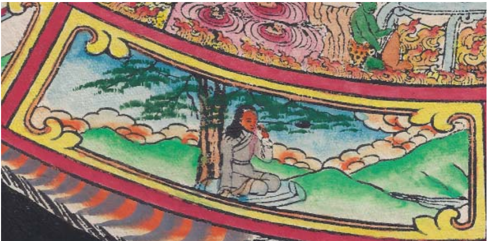
Obr. 19: Řetězec podmíněného vznikání (skrt. Pratītyasamutpāda ). 7. Muž se zatnutým šípem v oku představuje pociťování, pocity, touha, která dává vzniknout pocitu rozkoše a bolesti (skrt. védaná , tib. cchorwa / cchor ba ). Na obrázku sedí pod stromem muž s dlouhými tmavými vlasy a levou rukou se pokouší odstranit zmíněný šíp z oka.