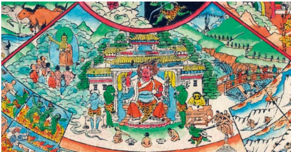
Obr. 11: Bhavačakra – Jamův soud.

Jamův soud je v horní části pekelné výšece ještě doplněn dvěma raritními výjevy. Napravo je horská krajina, kde se v údolí propadají stěny do horské řeky, podél které se vine cesta s chodci. Řeka je v dolní části přemostěna, v jejím splavu jsou patrné dvě nahé postavy přesně pod mostem, po kterém kráčí jiné postavy v tibetských oděvech směrem k Jamovu soudu. Výjev nalevo je taktéž atypický, neboť obklopen obláčky je na něm bódhisattva s dvojitou aurou a tibetskou knihou, kterou drží v levé ruce, pravá paže je pozdvižena a ukazuje posluchačům cestu ven z neblahé říše pekelných bytostí. Posluchači jsou zády k pozorovateli, nicméně se jedná o prostý lid oběho pohlaví, který je oděn do pestrobarevných úborů. Tím se uzavírají scény ze soudu.