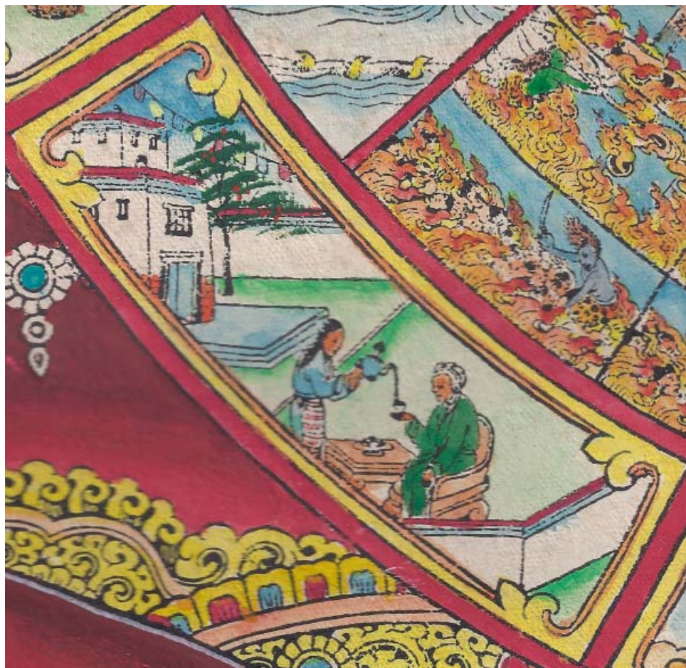
Obr. 20: Řetězec podmíněného vznikání (skrt. Pratítjasamutpáda ). 8. Piják představuje žízeň, žádostivost, touhu (skrt. tršná , tib. sepa /sred pa/ ). Na obrázku sedí v křesle u stolu muž, v pravé ruce drží misku, do které mu žena nalévá z konvice opojný nápoj; v pozadí je tibetská stavba a celý výjev se odehrává uvnitř zděné ohrady.