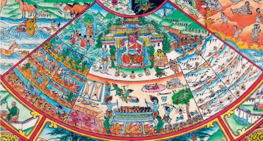
Obr. 10: Bhavačakra – říše pekelných bytostí.

Říše pekelných bytostí (skrt. naraka , tib. ňalwä /dmjal ba/ , mong. tamyn am'tad ). K pecku toho není třeba příliš dodávat, snad jen to, že se dělí na dvě podpekla – horké a studené.