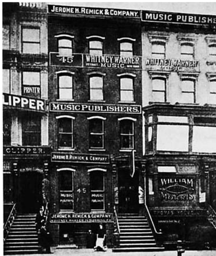
Tin Pan Alley roku 1910

Nacházíme mezi nimi i dva z Velké šestky Broadwaye – Gershwina a Berlina. Většinu z těchto standardů musí profesionální jazzman zahrát kdykoliv z paměti a pokud možno v libovolné tónině.