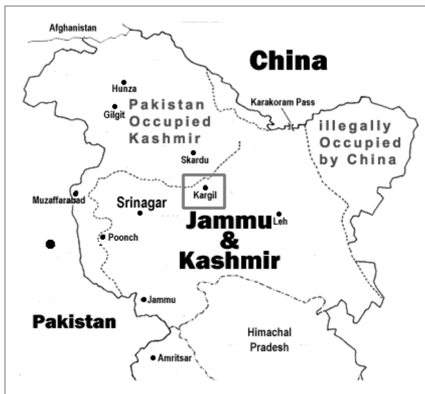
Obr.č. 1 Džammú a Kašmír