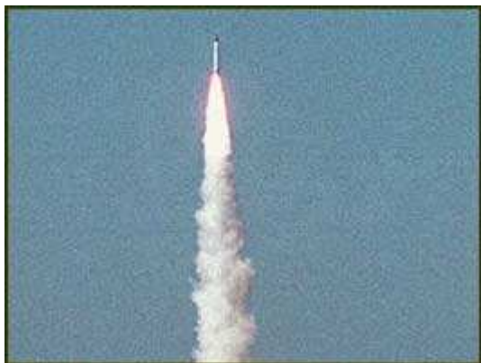
Obr.č. 5 Obě země vyvinuly rakety s dlouhou dráhou doletu, které mohou zasáhnout města

Spojené státy zavedly proti oběma zemím sankce a zmrazily pomoc, půjčky a obchodní výměnu v hodnotě více než 20 miliard dolarů. Japonsko zablokovalo půjčky ve výši asi 1 miliardy dolarů. Podobná opatření přijalo i několik evropských zemí a vlády zemí G8 uvalily zákaz na půjčky Indii a Pákistánu s výjimkou humanitární pomoci.