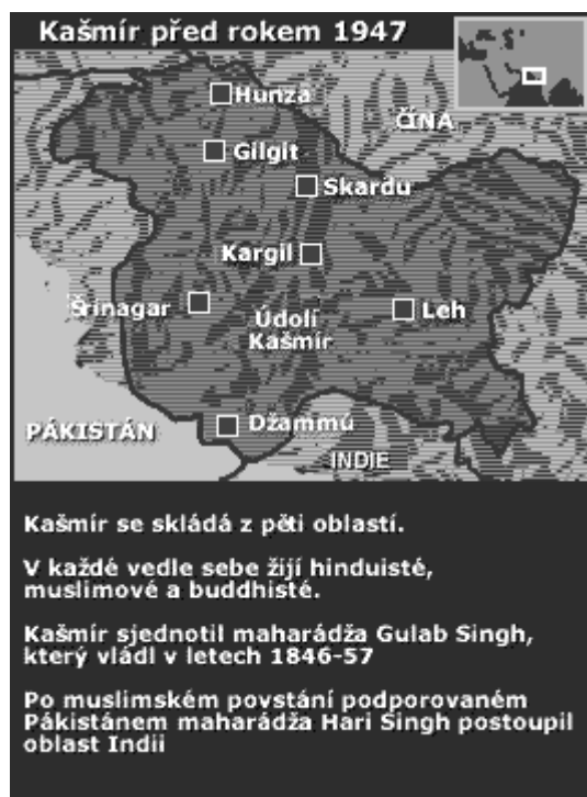
Obr.č. 4 Kašmír před rokem 1947