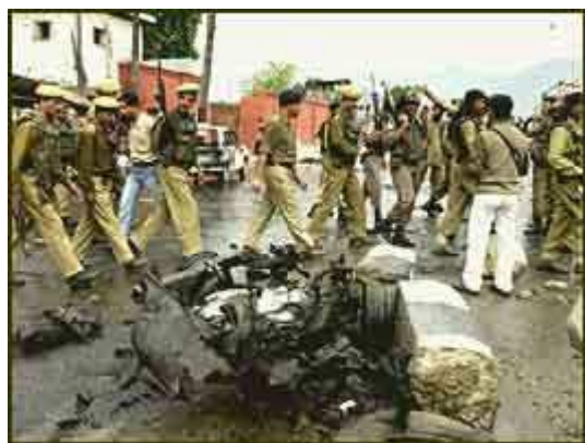
Obr.č. 6 V roce 2001 při násilnostech ve Srinagaru zemřelo 38 lidí

Napětí podél linie kontroly přetrvávalo. V říjnu vypukly nejhorší boje za poslední více než rok, když Indie, která stále odsuzovala Pákistán za přeshraniční terorismus, začala ostřelovat pákistánské vojenské pozice.