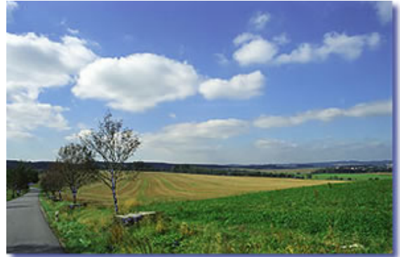
Obr.3 Typická krajina Vysočiny

- specifický vývoj krajiny ovlivněný přírodními podmínkami (pozdější nástup středověké kolonizace a industrializace než v českých a moravských nížinách) → Vysočina se řadí mezi chudší kraje, ale je uchráněna před znečištěním životního prostředí a vznikem velkých území devastovaných průmyslovým rozvojem.