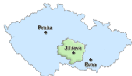
Obr.1 Poloha kraje Vysočina v rámci ČR