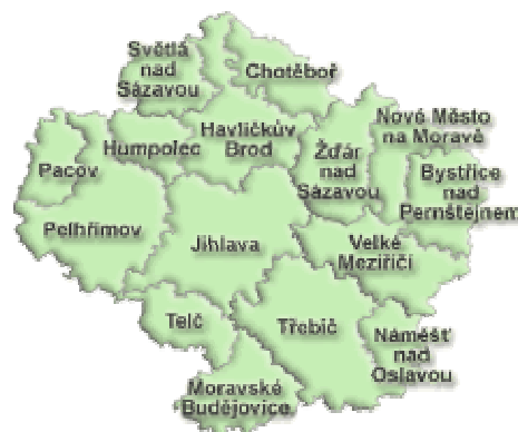
Obr.2 Správní obvody obcí s rozšířenou působností kraje Vysočina