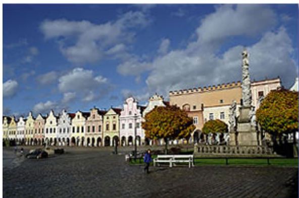
Obr.4 Náměstí v Telči (součást dědictví UNESCO)