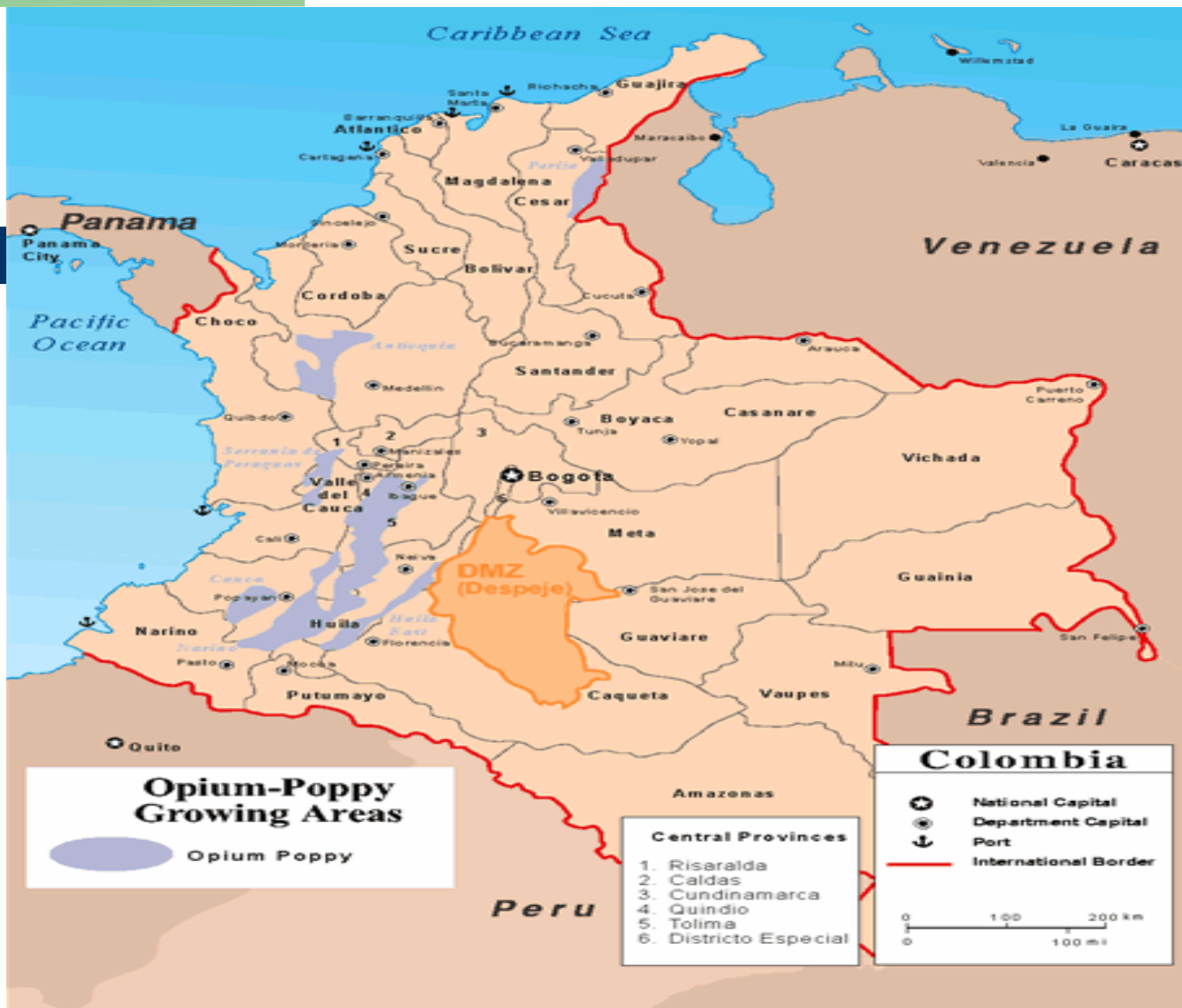
General Opium Cultivation Areas in Colombia