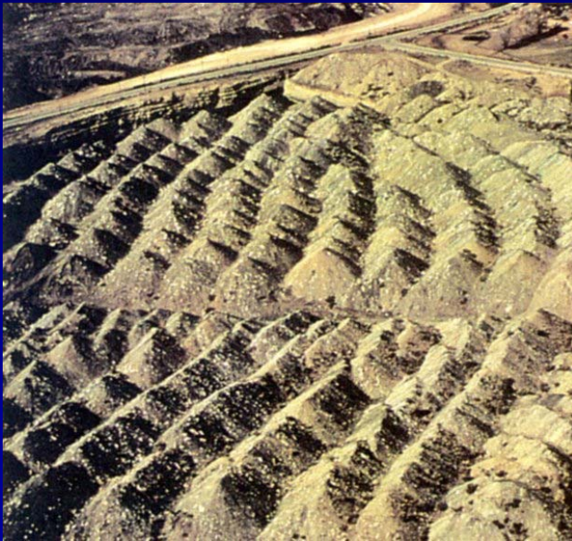
Hlušina v okolí uhelného dolu Mulla v Coloradu.