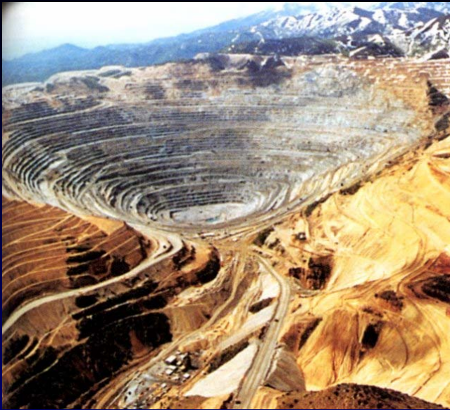
Jámový důl na měď Bingham v Utahu (4 km průměr, 800 m hloubka).