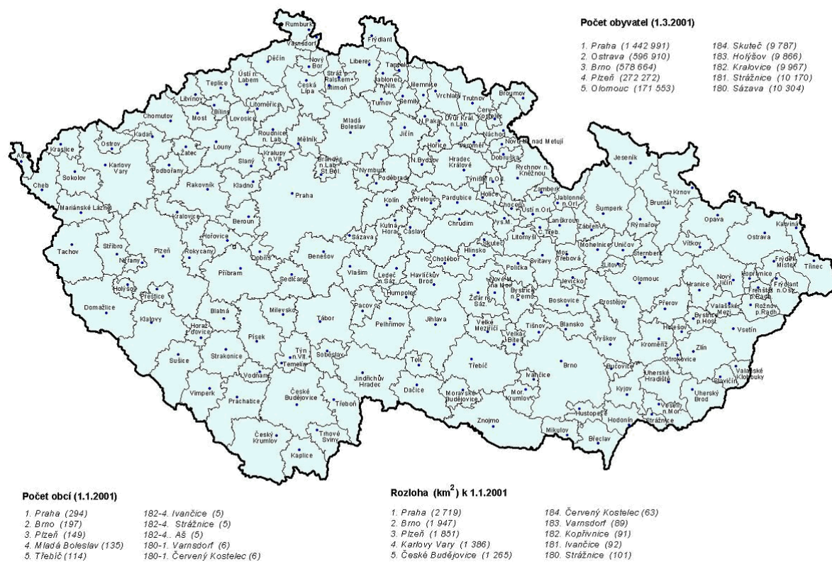
Obr. 3: Pracovní mikroregiony v ČR v roce 2001 Pracovní mikroregiony podle dojížděky za práci v roce 2001