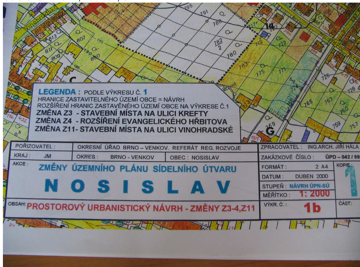
Obrázek č. 1: Návrhy na změny ÚP

Dále jsou v územním plánu zaneseny i plochy pro podnikání. Starosta Nosislavi nám prozradil, že takové zatím využity nejsou a do budoucna ani velkou podnikatelskou aktivitu neočekává. Zajímavým faktem je, že v Nosislavi prakticky neexistuje nic jako brownfields, neboť všechny objekty, které slouží k podnikání jsou poměrně nové a zároveň využitě. Dokonce i porevoluční „strašák“ českých vesnic – opuštěné zemědělské družstvo – zde dnes funguje.