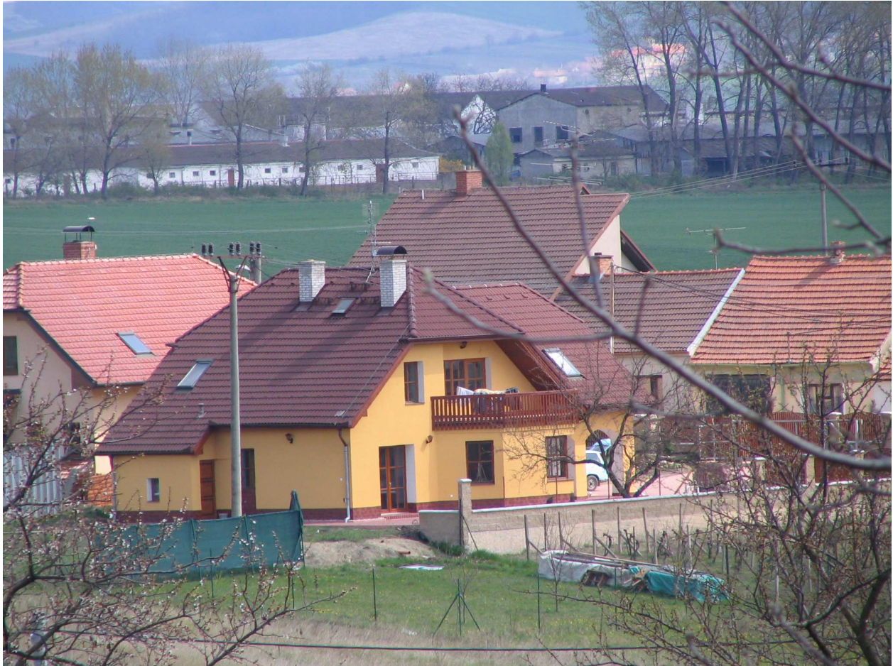
Obrázek 2: Nová zástavba obce Nosislav

Odovědi na některé z našich otázek byly více než překvapivé. Většina respondentů byla v Nosislavi velmi spokojena, neboť zároveň také většina z nich z obce pocházela a vyrůstala zde. Nejvíce si lidé pochvalovali malebnou krajinu, která obec obklopuje. Co se naopak nelíbilo byla nedostatečně vybudovaná infrastruktura obce, kromě již výše zmíněné, také vybudování nových cest.