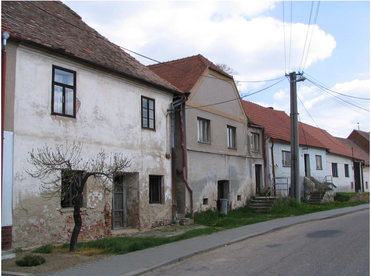
Obrázek 1: Starší zchátralá zástavba obce Nosislav

V obci jsme provedli menší výzkum, přičemž jsme s občany hovořily o níže uvedených otázkách: