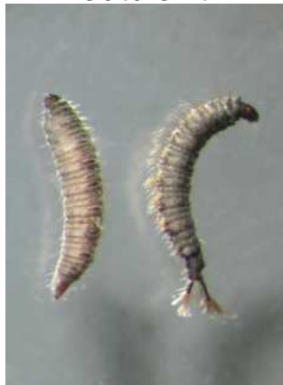
Pericoma koutule – do 1cm tmavé