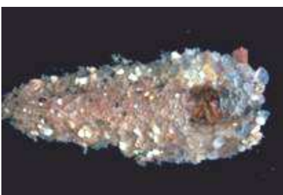
Molanna - do 1,5 cm boční křídla schránky