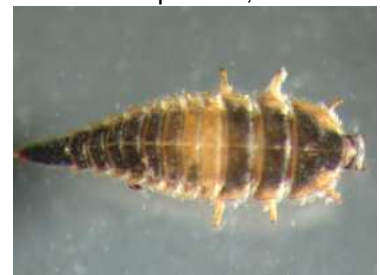
Elmis - larva 0,4 cm