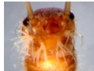
Amphinemura - do 0,8 cm