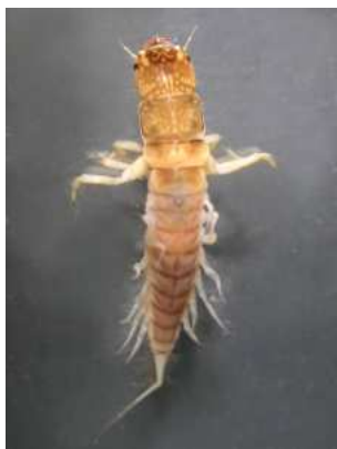
Sialis střechatka -1 štět do 2 cm, dravá