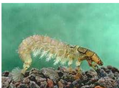
Hydropsyche - do 1cm hnědozelený, lapací sítě