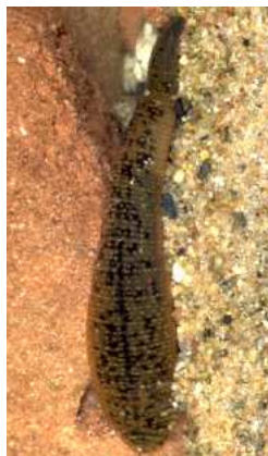
Erpobdella octoculata hltanovka - do 3 cm nejhojnější, tmavá