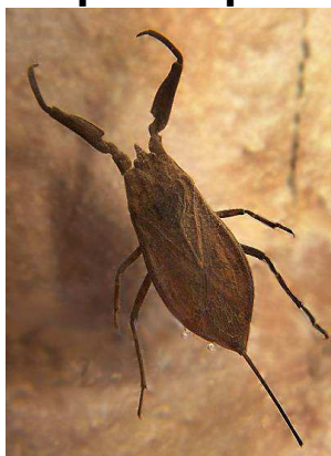
Nepa cinerea – splešřule blátivá, zarostlé vody