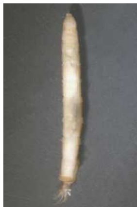
Eloeophila bahnomilka 1-3cm, bez panožek