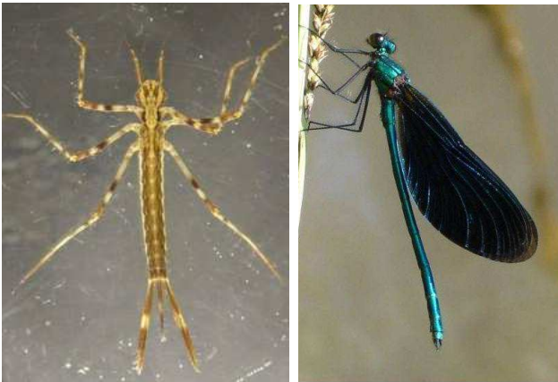
Calopteryx virgo motýlice obecná, 4cm