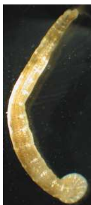
Piscicola geometra chob. rybí - do 4 cm tenká, pruhovaná