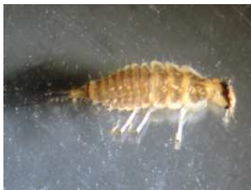
Platambus - larva 0,7 cm