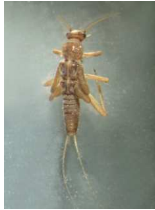
Nemoura - 1 cm tmavá, zavalitá