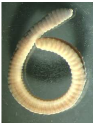
Eiseniella tetraedra 2- 5cm, silnější, větší