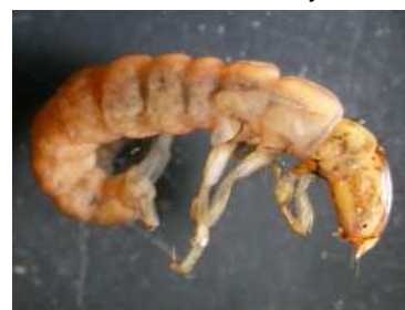
Plectrocnemia - do 1,2cm růžovohnědý, dravý, potoky