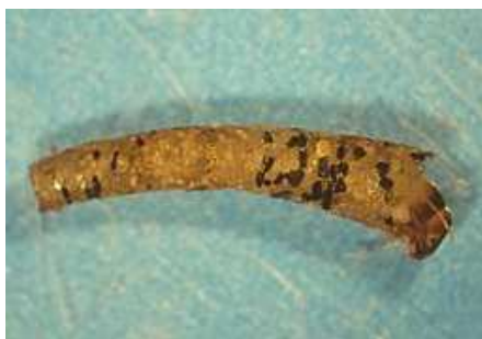
Sericostoma - do 1,5 cm jemnozrná okrouhlá schr.