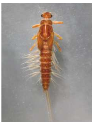
Paraleptophlebia do 1 cm, větvená žábra