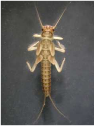
Isoperla - do 1,5 cm