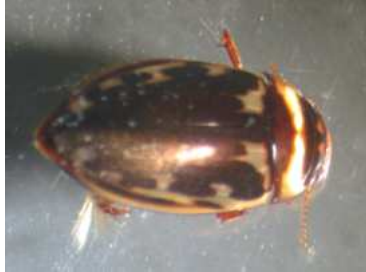
Platambus - dospělec 1 cm