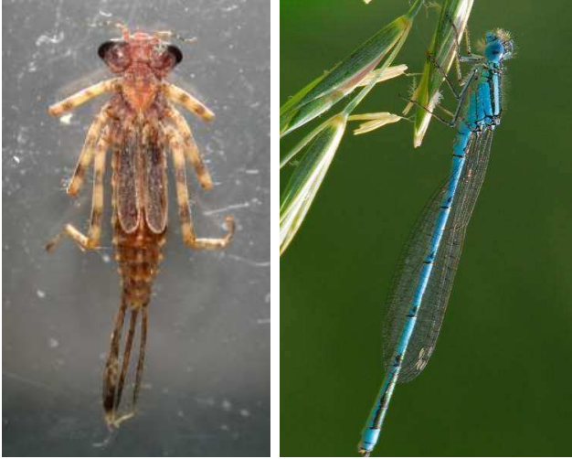
Platycnemis pennipes šidélko brvonohé, 3 cm