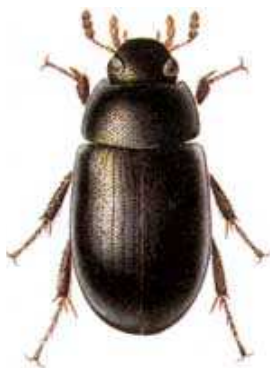
Hydrobius fuscipes - do 1 cm