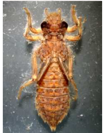
Cordulegaster - páskovec