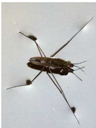
Gerris - bruslařka 1-2cm, na otevřené hladině