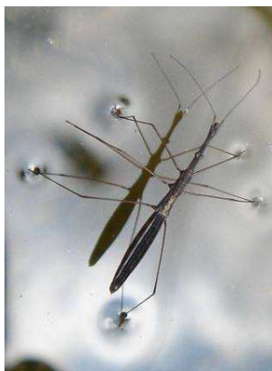
Hydrometra stagnorum – vodoměrka štíhlá, zarostlé vody