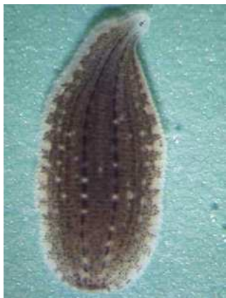
Glossiphonia complanata chobotnatka plochá do 1,5cm plochá, světlejší