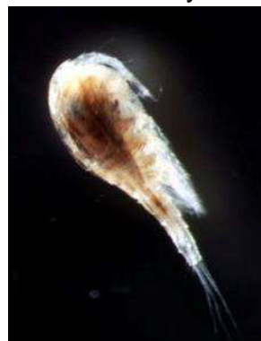
do 0,3 cm