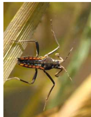
Velia - hladinatka 1-2cm, potoky