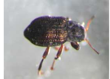
Elmis - vodnář, dospělec 0,2 cm