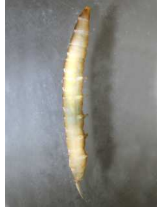
Dicranota do 1cm 4-5 párů panožek