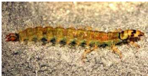
Rhyacophila - do 1cm zelený, dravý