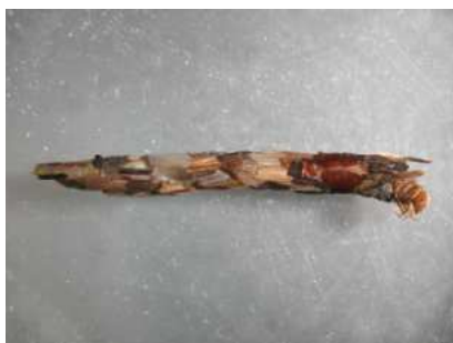
Chaetopteryx - do 1,5 cm z lístků i písku