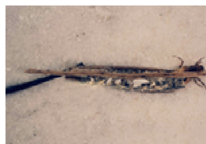
Anabolia - do 1,3 cm s dlouhými podél. dřívky