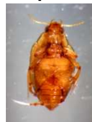
Halipus - do 0,3 cm