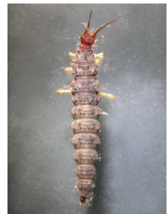
Osmylus fulvicephalus strumičník do 1,5 cm, u břehů