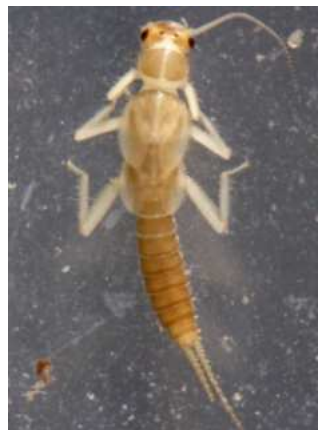
Siphonoperla - do 1,2 cm kruhové křídelní pochvy