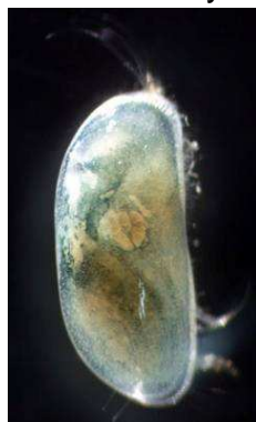
do 0,4 cm