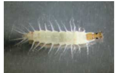
larva, 1 cm