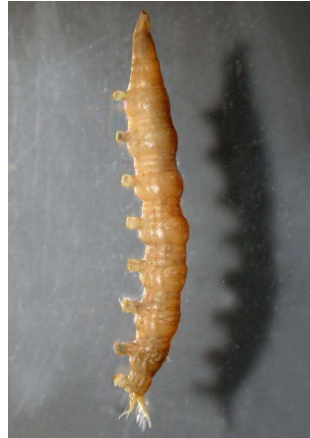
Atherix ibis – číhalka pospolitá, dravá, tekoucí v.