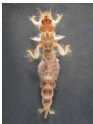
Ephemera danica do 2 cm, hrabavá larva