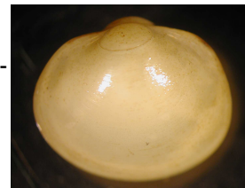
Musculium lacustre – okrouhlice rybníčná 0,9 cm