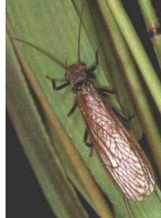
Perla - imago