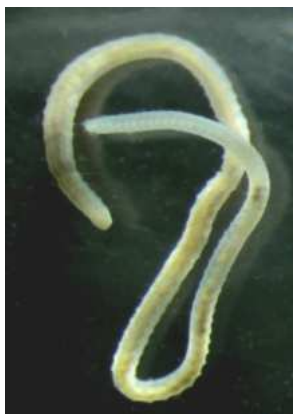
Tubifex tubifex 1-3 cm červené, bílé.