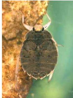
Aphelocheirus aestivalis hlubenka skrytá, do 1,5 cm