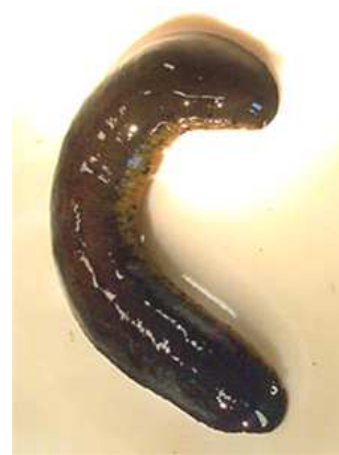
Haemopsis sanguisuga p.koňská - do 10cm tmavá, velká