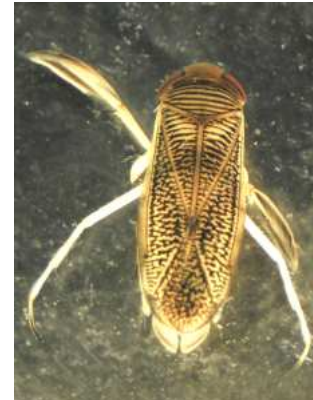
Corixa, Sigara , - klešťanka 0,5-1,3cm