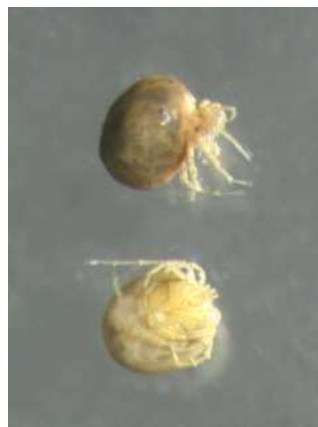
(vodní roztoči) 0,2cm