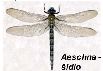
Aeshna - šídlo