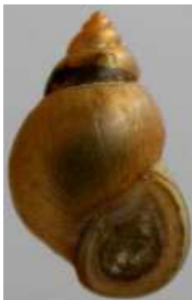
Bithynia tentaculata – bahnivka mtná do 1,7 cm má víčko v ústí