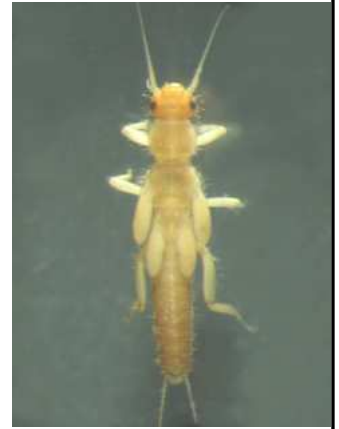
Leuctra - 1 cm světlá, štíhlá