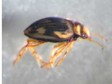
Oreodytes - dospělec 0,7 cm