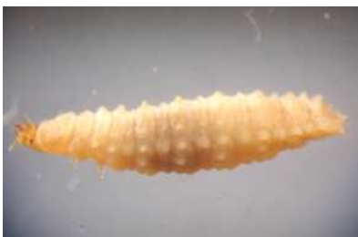
Hydrophilidae - larva do 1 cm