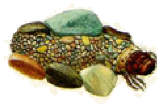
Silo - do 1 cm boční kaménky schránky