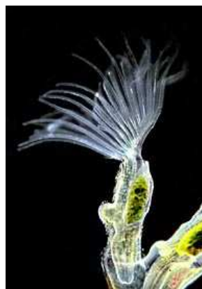
Plumatella - mechovka