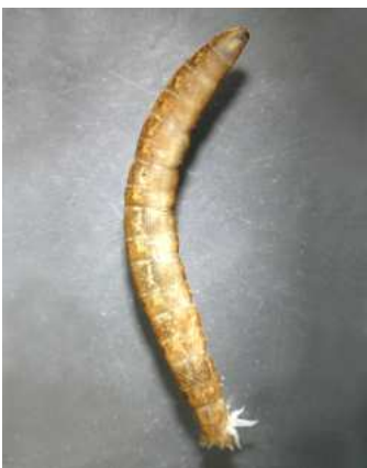
Tipula Tiplice 2-6cm, velké tlusté larvy