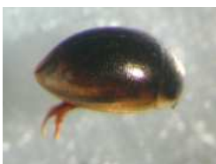
Anacaena - do 0,3 cm