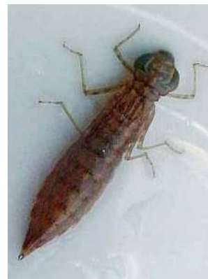
Aeshna - šídlo