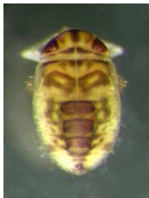
Micronecta – klešťanečka, Notonecta – znakoplavka 0,3 cm, drobná, rychlý pohyb plave naznak, do 1,7 cm