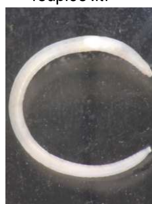
Enchytraeidae do 1 cm, bílě tuhé tělo