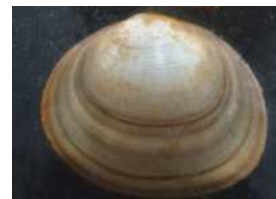
Sphaerium - okružanka 0,5 - 2,2 cm