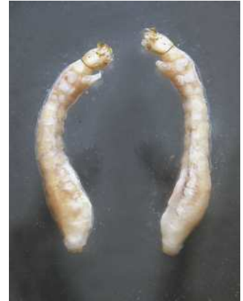
Simulium - muchnička 1 cm přisedlá zadečkem