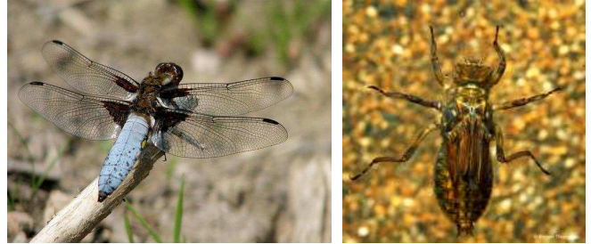
Libellula depressa - vážka plošká, do 4 cm, bez list.přívěsků