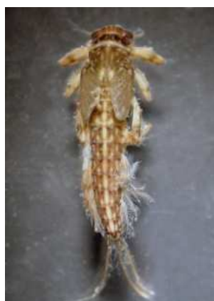
Potamanthus - do 1,3cm