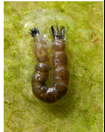
Dixa komárec – do 0,7cm na hladině, do C stočený