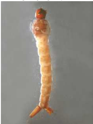
Culex - komár – do 1cm zadečkem u hladiny