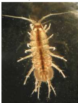
Asellus aquaticus beruška vodní do 1,3cm