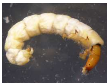
Philopotamus - do 1,2cm žlutá hlava, dravý, potoky