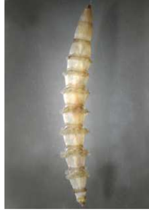
Tabanus ovád – 1-2 cm krebša, 6-8 panožek na čl.