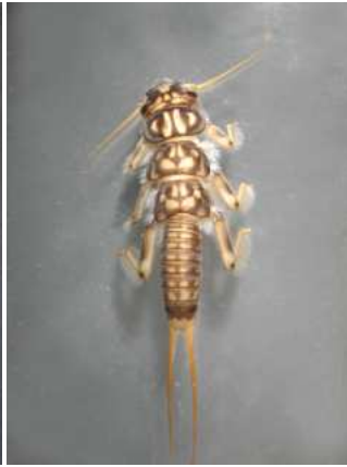
Perla - 1,5 -3 cm s keříčky žaber