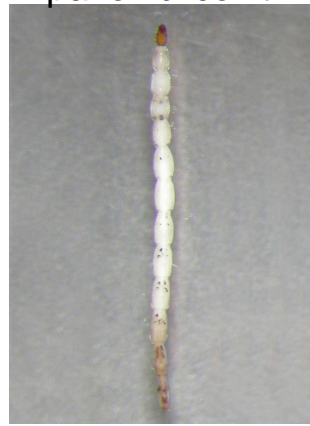
Ceratopogon pakomárec do 0,7cm tenký, trhavý pohyb