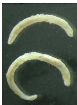
Nais - do 1cm drobné, tenké, s očima