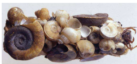
Limnephilus - do 1,5 cm schránky měkkýšů, úkrojky vegetace – stoj. vody