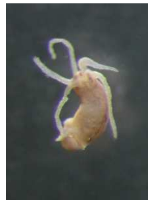
Hydra nezmar – do 0,4 cm