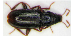
Hydraena - vodník, do 0,3 cm