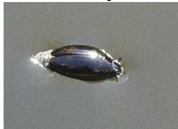
Orectochilus villosus - vírník huňatý