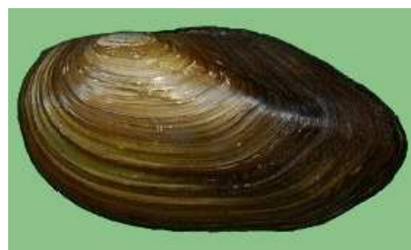
Anodonta – škeble do 20cm Unio – velevrub do 13cm odlišení dle zámkové lišty