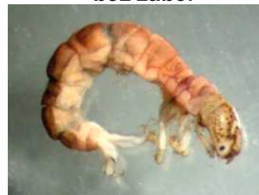
Polycentropus - do 1,2cm růžovohnědý, dravý, půlměsíc na hlavě, říčky