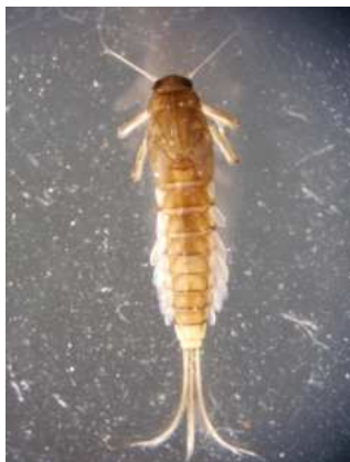
Baetis rhodani - do 1 cm rybičkovitá