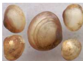
Pisidium - hrachovka do 0,5 cm