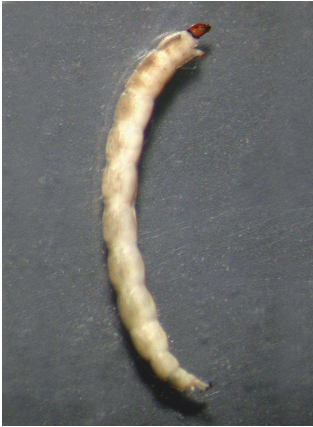
Diamesa – do 1,3 cm hnědý, tmavá hlava