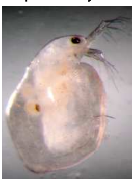
Cladocera – do 0,3 cm