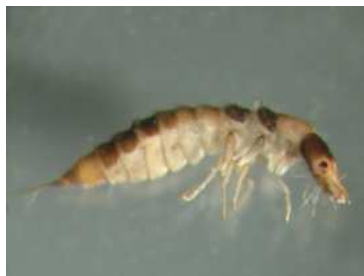
Oreodytes - larva 0,5 cm