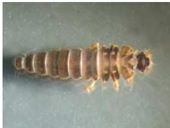
Elodes - mokřadník, larva 1 cm