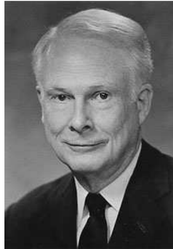
Wilson Allen Wallis (1912 – 1988): Americký matematik

Nechť je dáno r \geq 3 nezávislých náhodných výběrů o rozsazích n_1, \dots, n_r . Předpokládáme, že tyto výběry pocházejí ze spojitých rozložení. Označme n = n_1 + \dots + n_r . Na asymptotické hladině významnosti \alpha chceme testovat hypotézu, že všechny tyto výběry pocházejí z téhož rozložení.