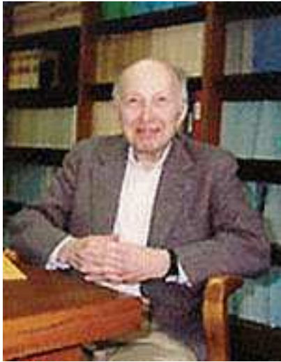
William Kruskal (1919 – 2005): Americký matematik