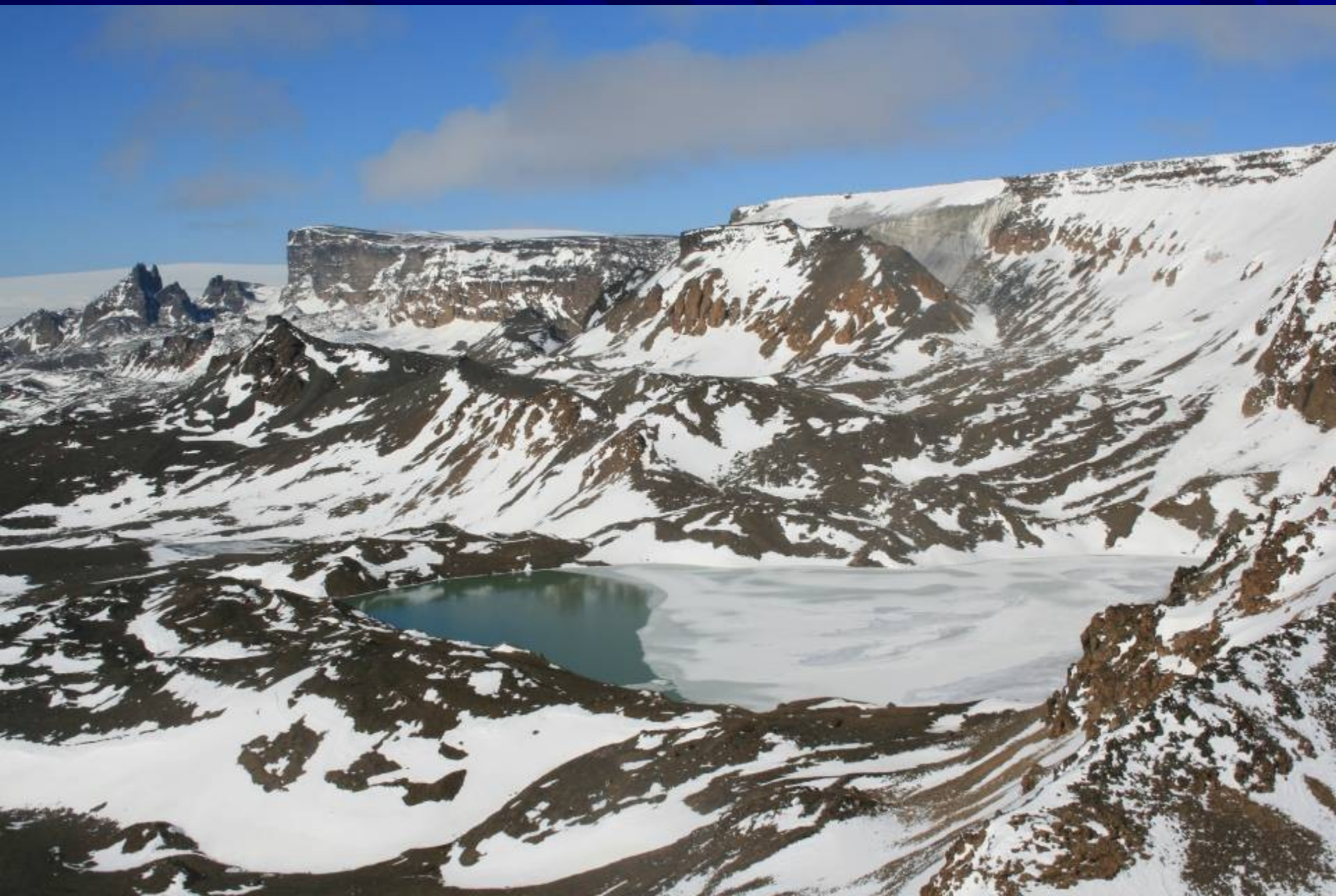
Rozmberk, unor 2009