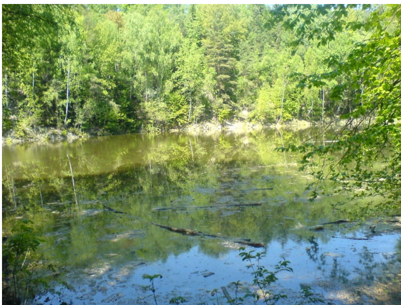
Obr. 1 Maršovské jezírko

U této vodní plochy, sloužící v minulosti jako lom na těžbu kaolínu, je v dnešní době dobře vidět naprostá proměna přírody způsobená primární sukcesí, která zde probíhá. Tento lom má z hlediska druhové biodiverzity na této lokalitě velký význam. Bohužel porost rostoucí na březích lomu svým opadem značně znečišťuje vodu v lomu, takže již neslouží jako rekreační oblast ke koupání, ale spíše jako vyhledávané místo rybářů.