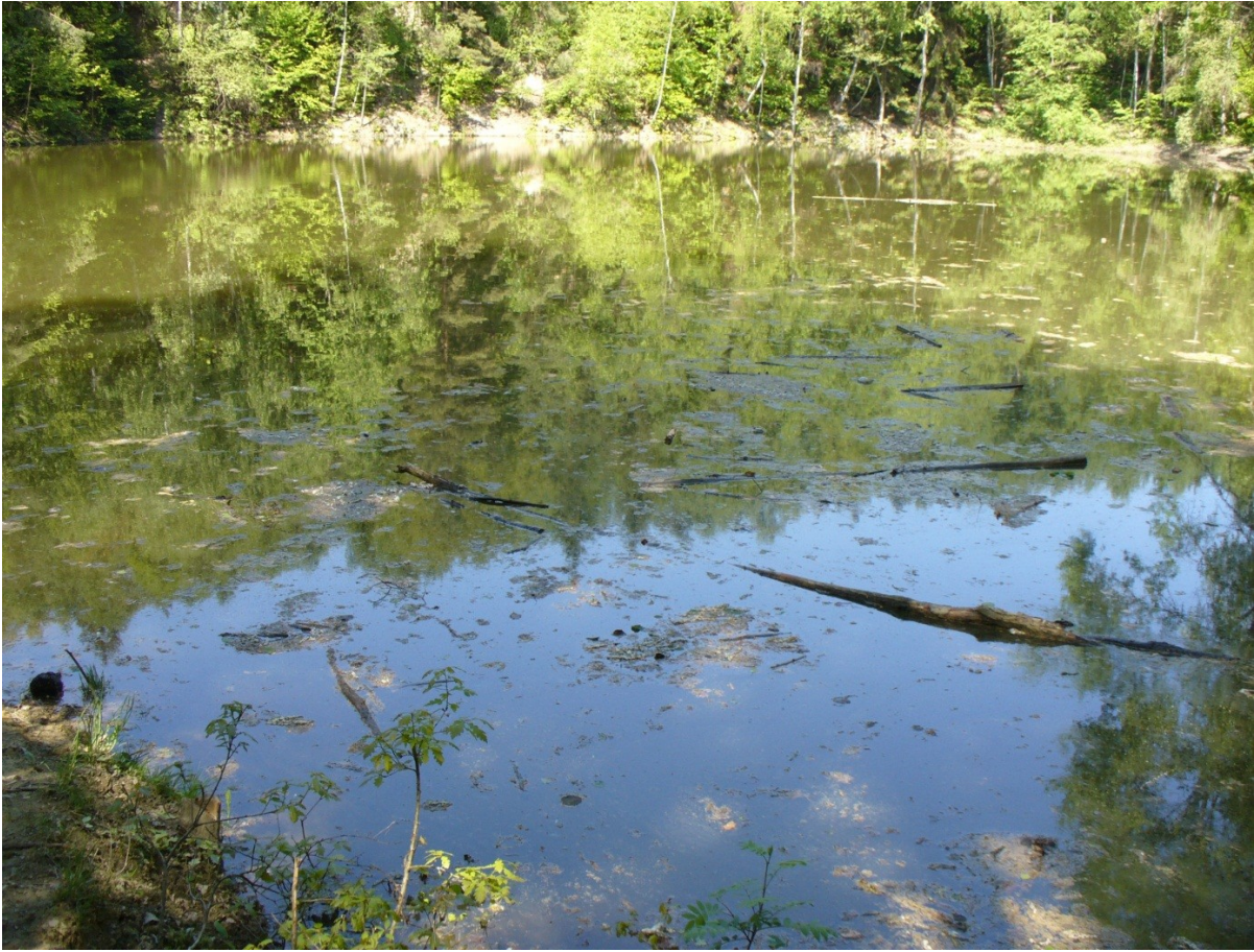
Obr. 2: 9.května 2011, Lažánky, tvar reliéfu, který vznikl po těžbě kaolinu v této lokalitě, ponechán přirozené rekultivaci, nyní je jezírko také novým prostorem pro život ryb či raků – obohacení biodiverzity