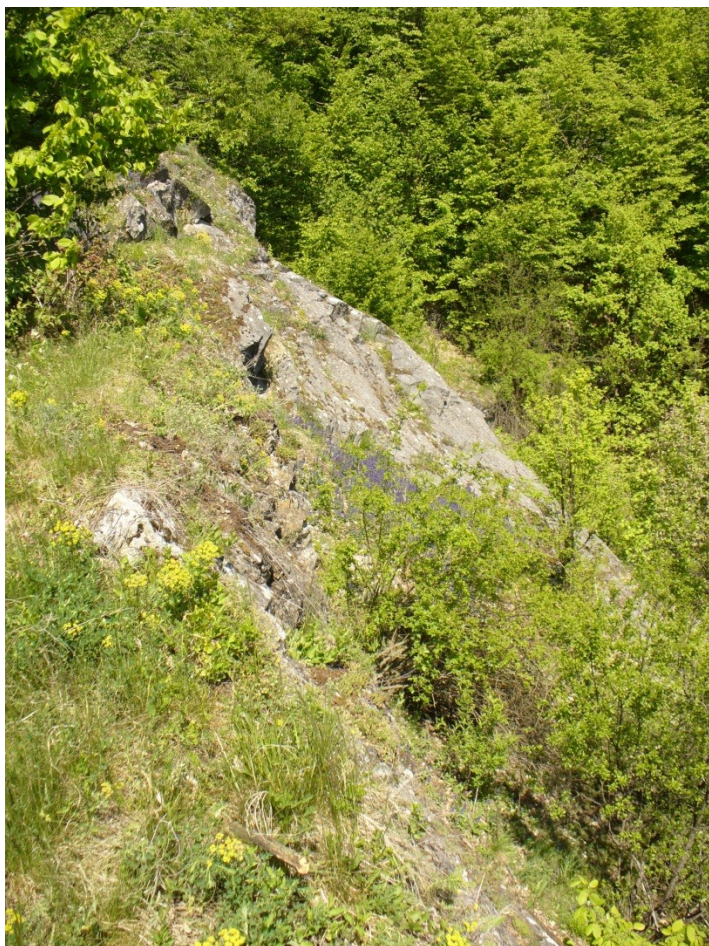
Obr. 4: 9.května 2011, Lažánky, opuštěný vápenný lom, který nyní podléhá přirozené rekultivaci, nová stanoviště pro specifické rostlinné druhy