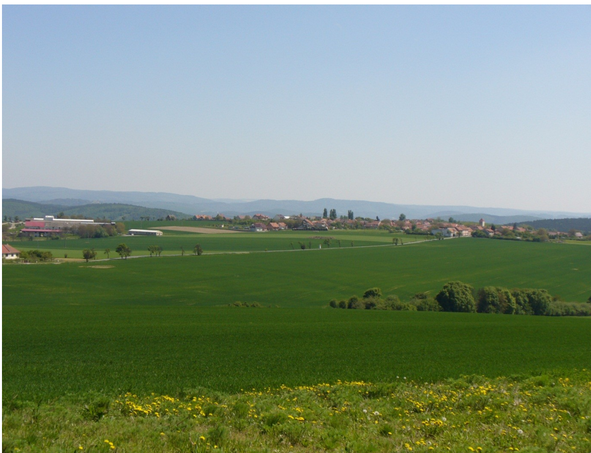
Obr. 1: 9.května 2011, Lažánky, Pohled na obec Lažánky, „náhorní plošina“ zachycena plošná převaha zemědělsky využívané půdy