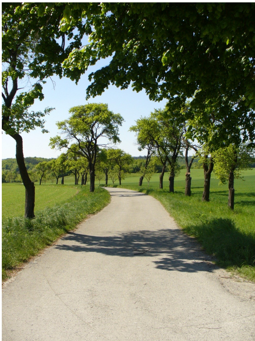
Obr. 6: 9.května 2011, Lažánky, liniový krajinný segment – stromová alej, pozitivně přispívá k narušení monotónní zemědělské krajiny