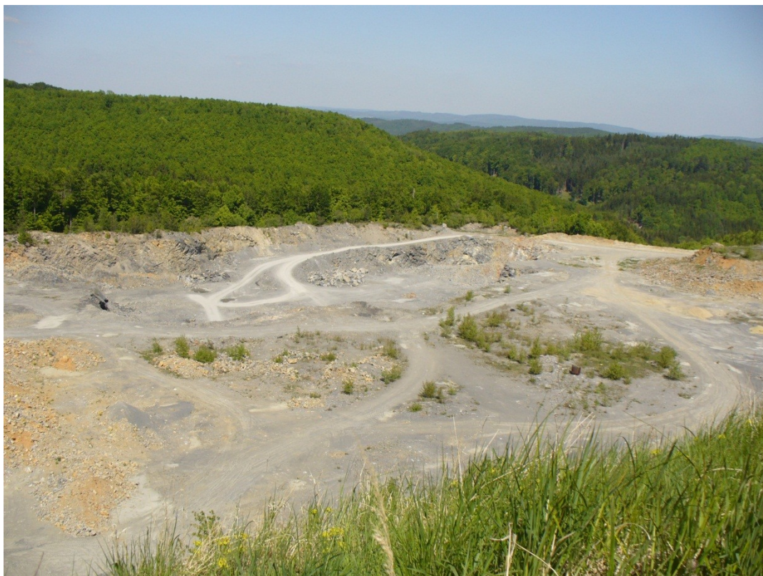
Obr.5: 9.května 2011, Lažánky, lom na vápenec, který je stále v provozu, je významným krajinným segmentem s malou ekologickou stabilitou