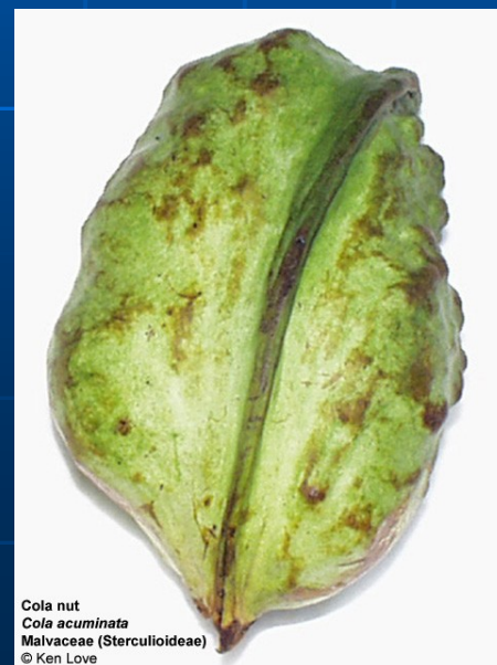
Cola nut Cola acuminata Malvaceae (Sterculioideae)