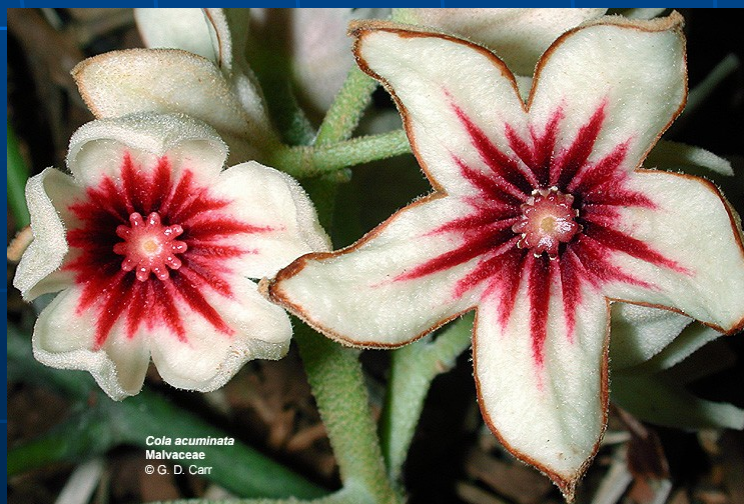
Cola acuminata Malvaceae