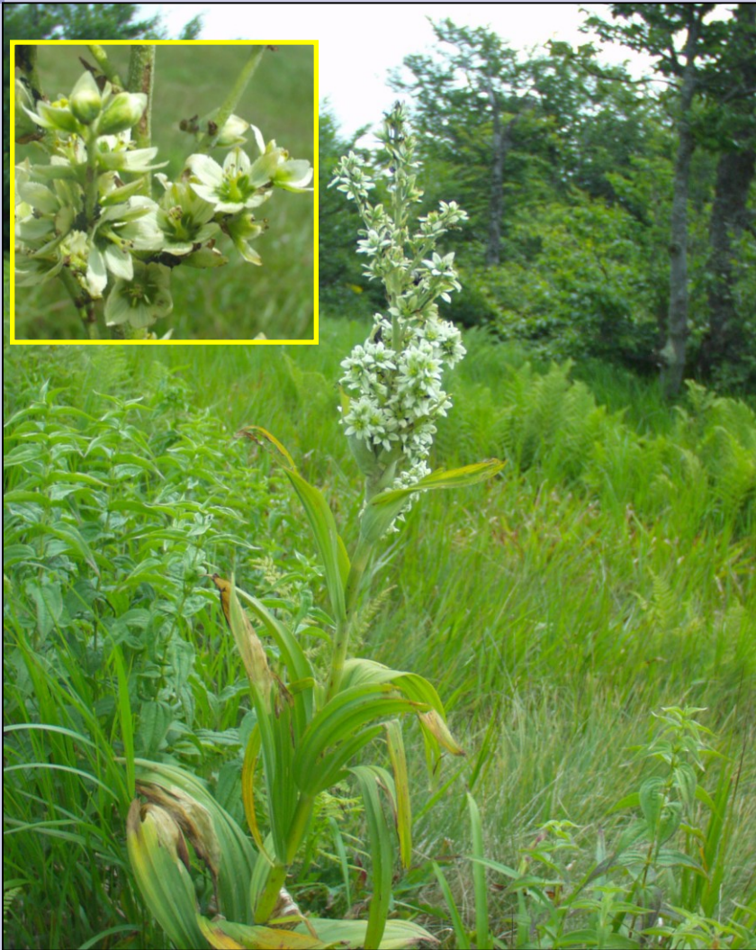
Veratrum album subsp. album