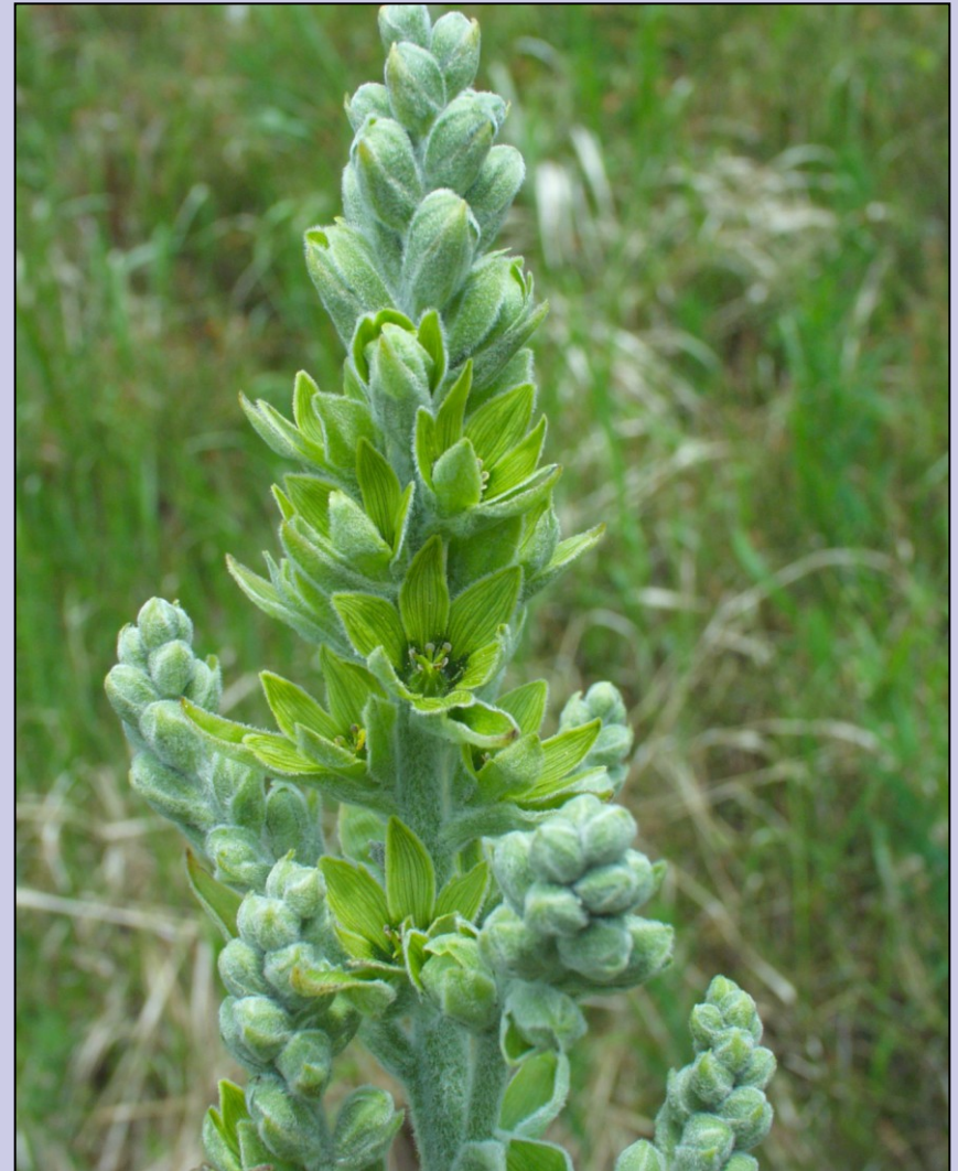
Veratrum album subsp. lobelianum