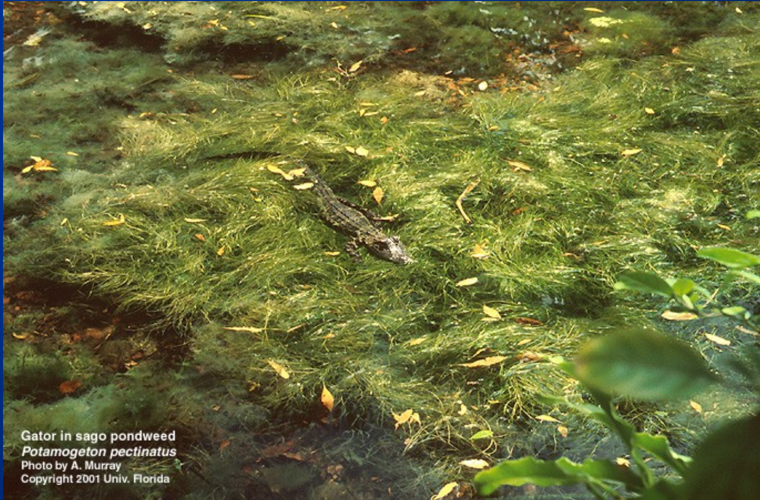
Gator in sago pondweed Potamogeton pectinatus