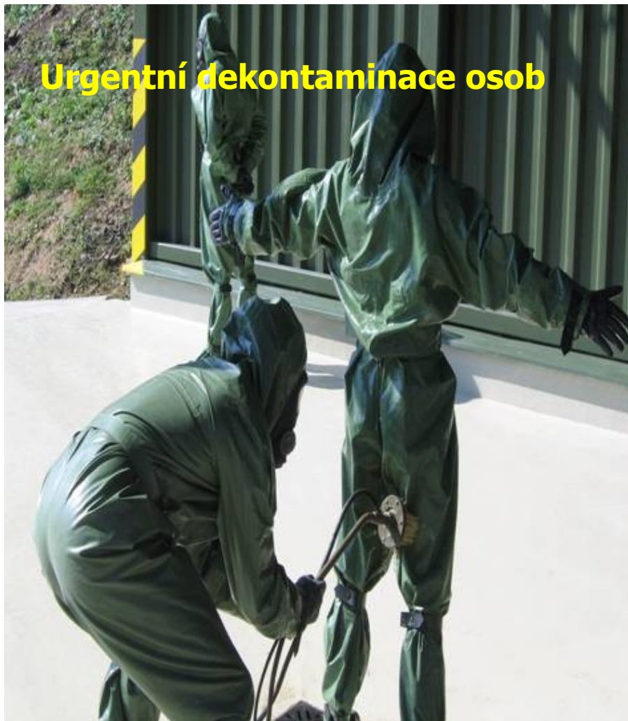
Urgentní dekontaminace osob