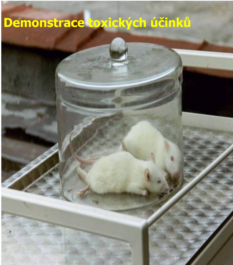
Demonstrace toxických účinků