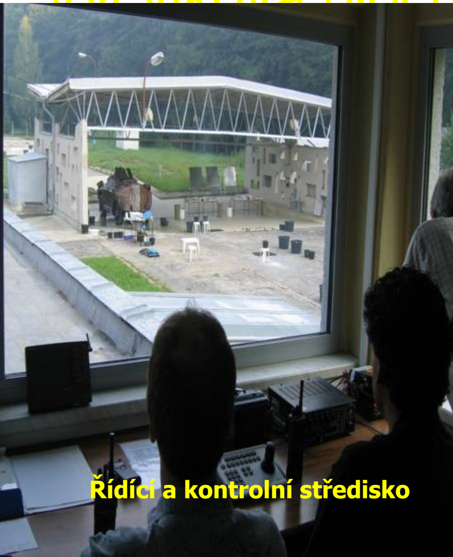
Řídící a kontrolní středisko