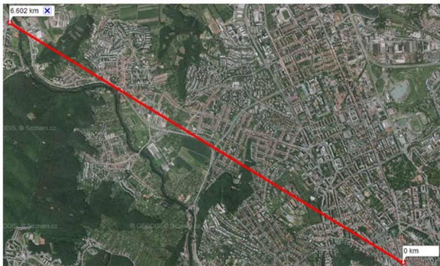
Obr. 1: Trasa Náměstí Svobody (Bmo-střed) – nám. 28. dubna (Bystrc).