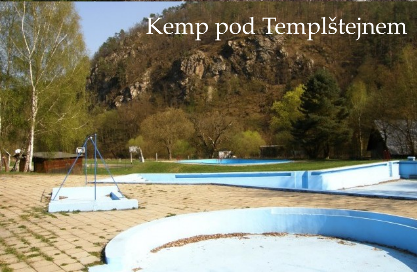
Kemp pod Templštejnem