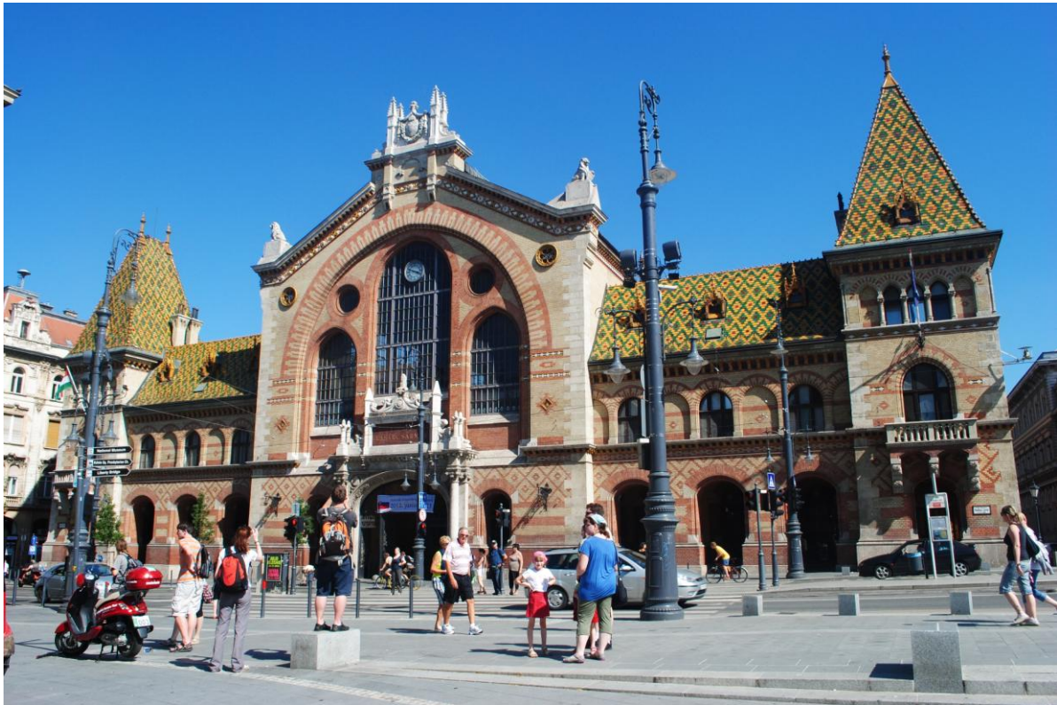
Obr.3 Tržnice