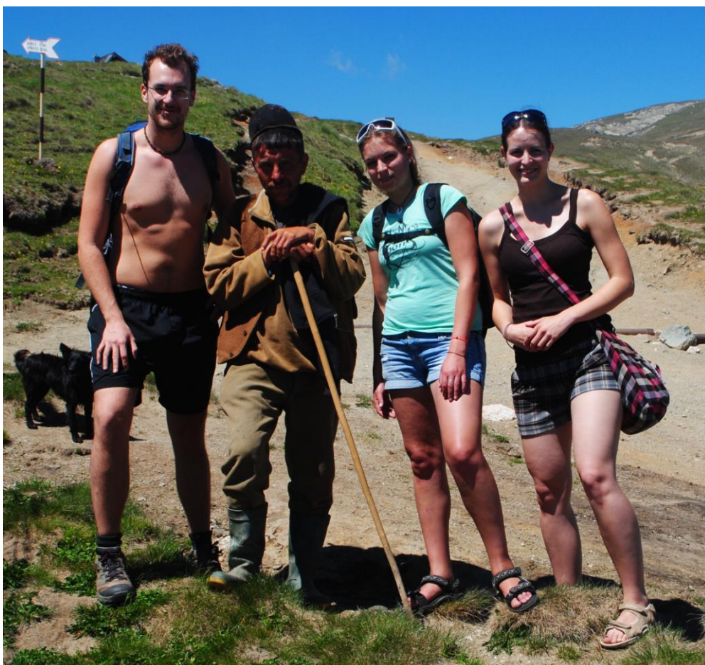
Obr.20 Místní pastýř