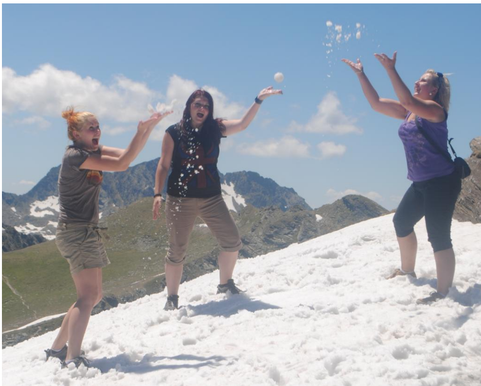
Obr.32 Sněhové pole na Fagaraši