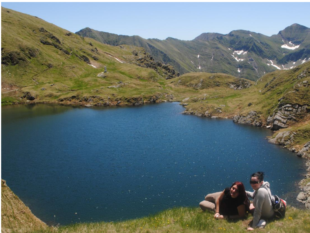
Obr.30 Capra Lac