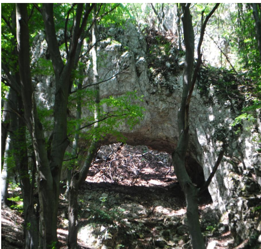
Obr.51 Kulhavá skála