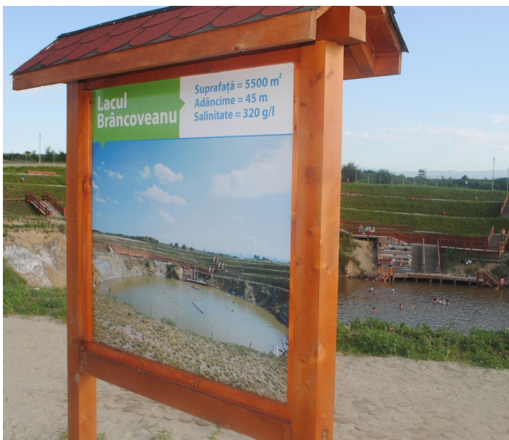
Obr.35 Jedno z jezer v areálu Ocna Sibiului