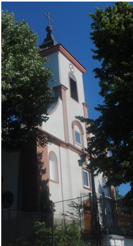
Obr.45 Katolický kostel ve Svaté Heleně