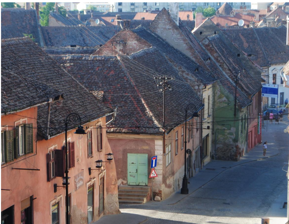
Obr. 12 Staré uličky v Sibiu