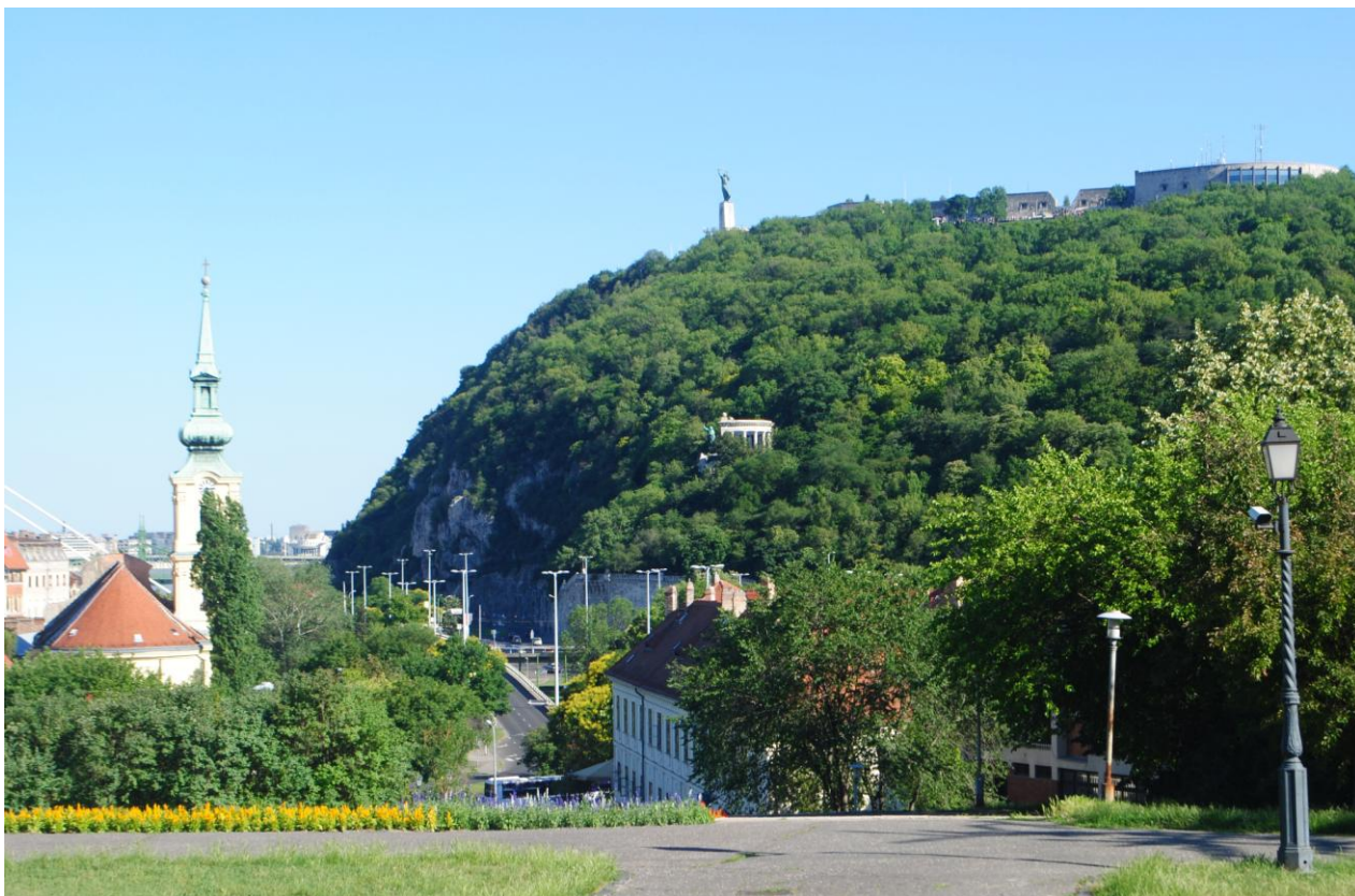
Obr.7 Gellért Hegy