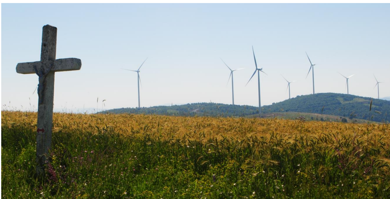
Obr. 43 Symbióza starého s novým