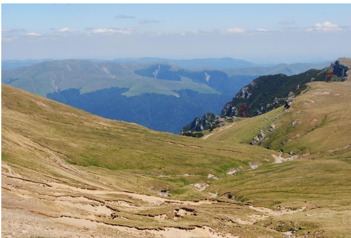
Obr.24 Bucegi Plateau