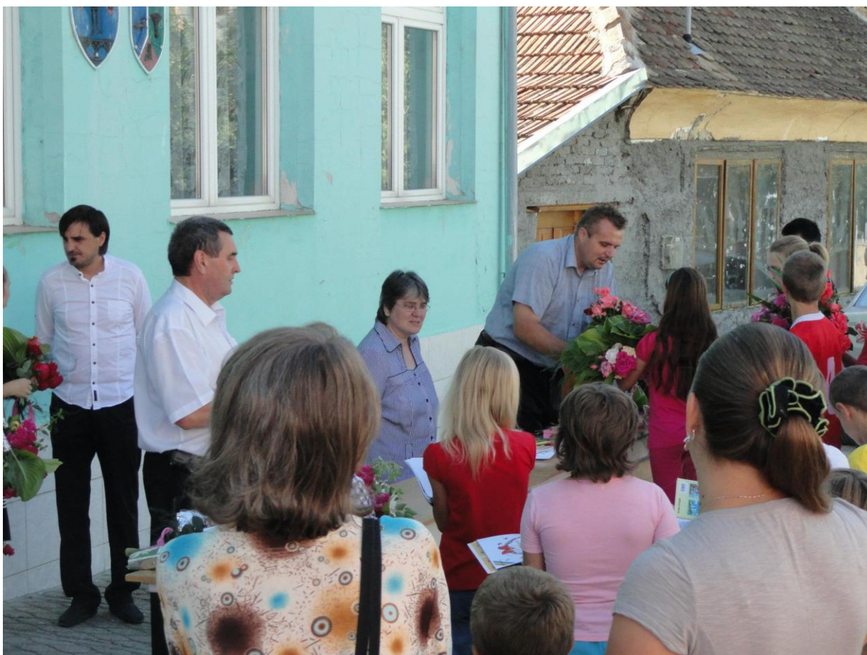
Obr. 46 Poslední den školy –vysvědčení