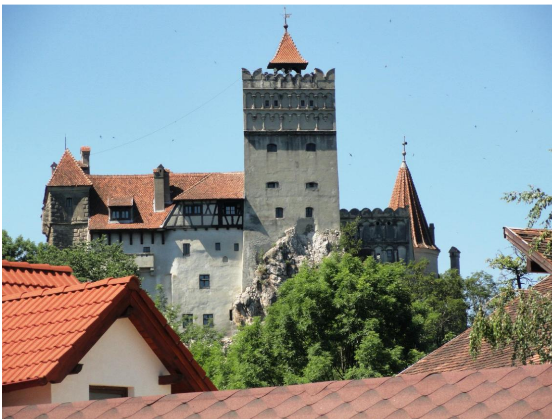
Obr. 16 Bran