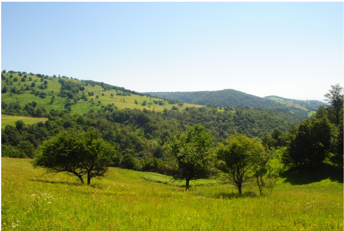
Obr.49 Idylická krajina rumunského Banátu