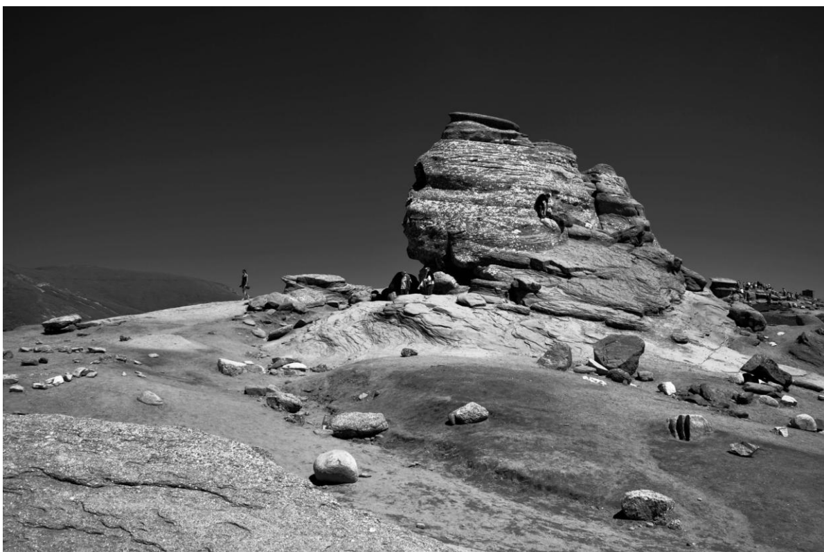
Obr.22 Skalní útvar Sfinxul