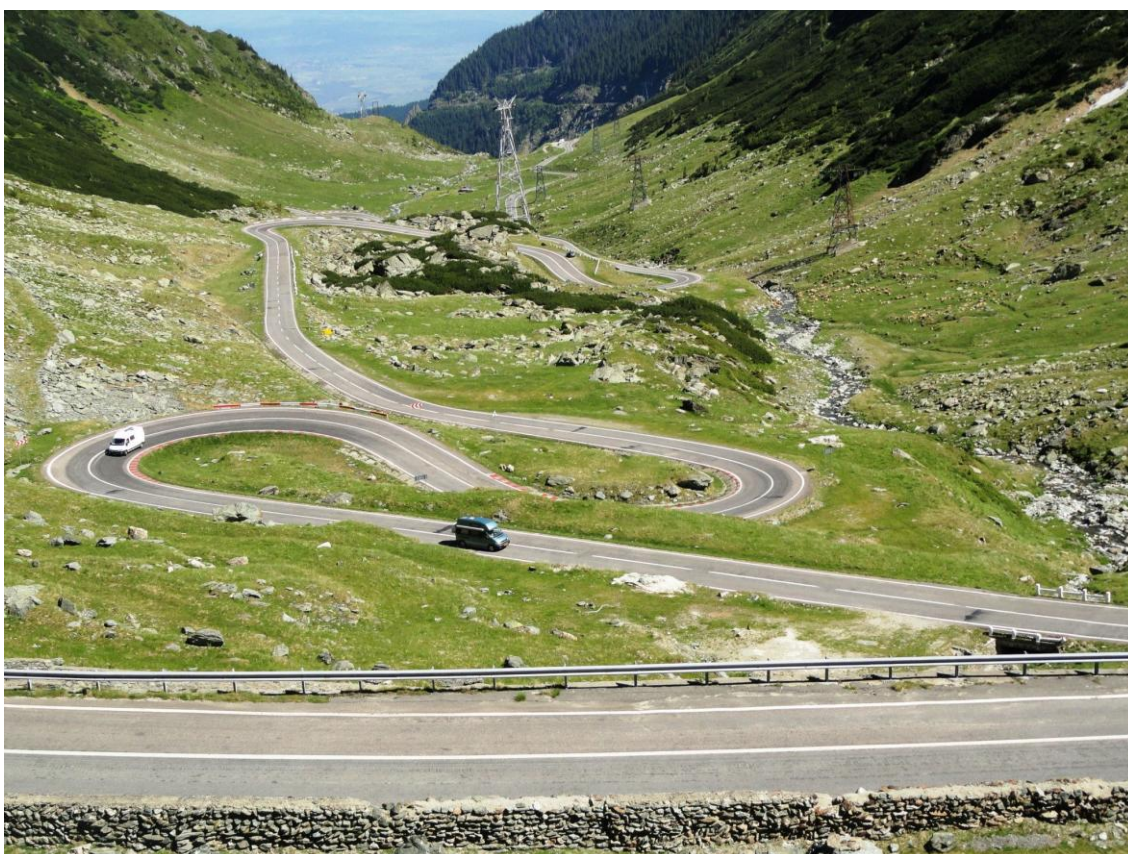
Obr. 27 Transfăgărășană silnice