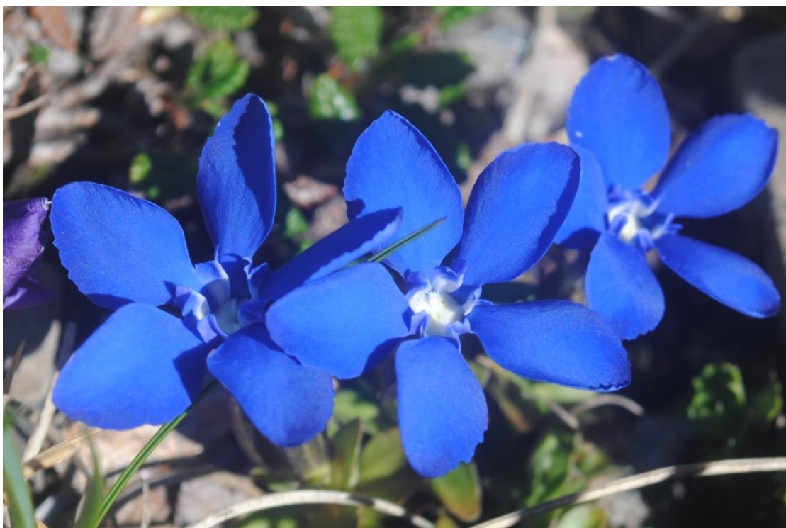
Obr.33 Hořec