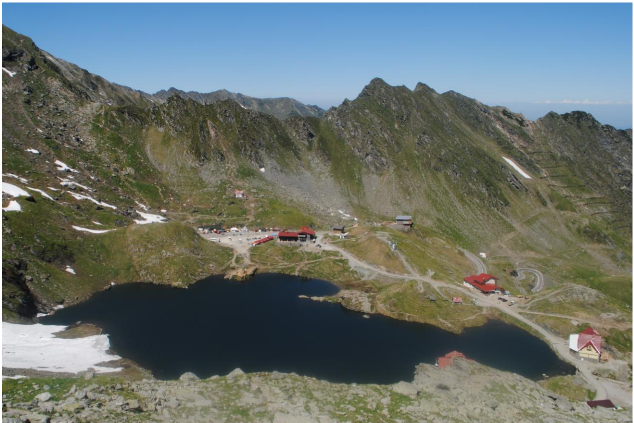
Obr.29 Balea Lac