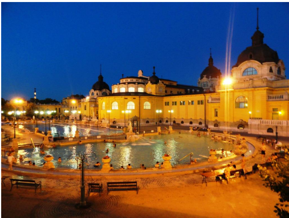
Obr. 9 Lázně Széchenyi