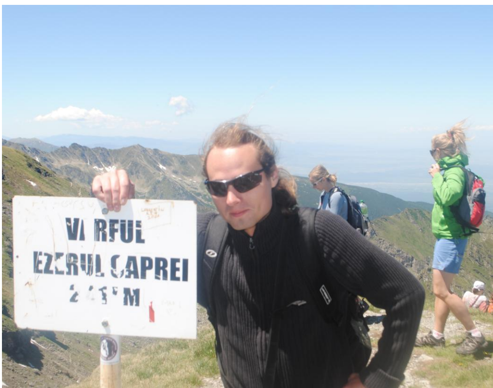
Obr. 31 Varful Ezerul Caprei(2417 m) – nejvyšší dosažený bod exkurze