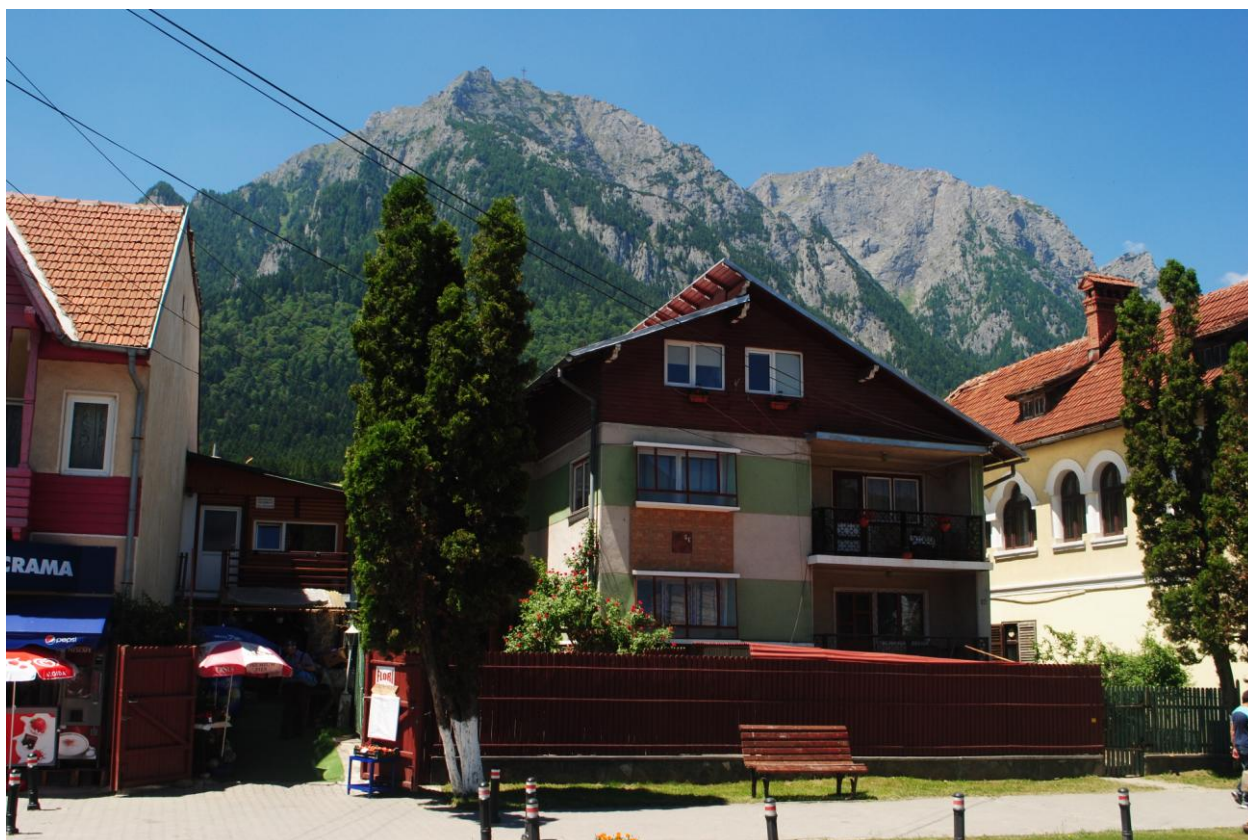
Obr.17 Bušteni, pohled na pohoří Bucegi