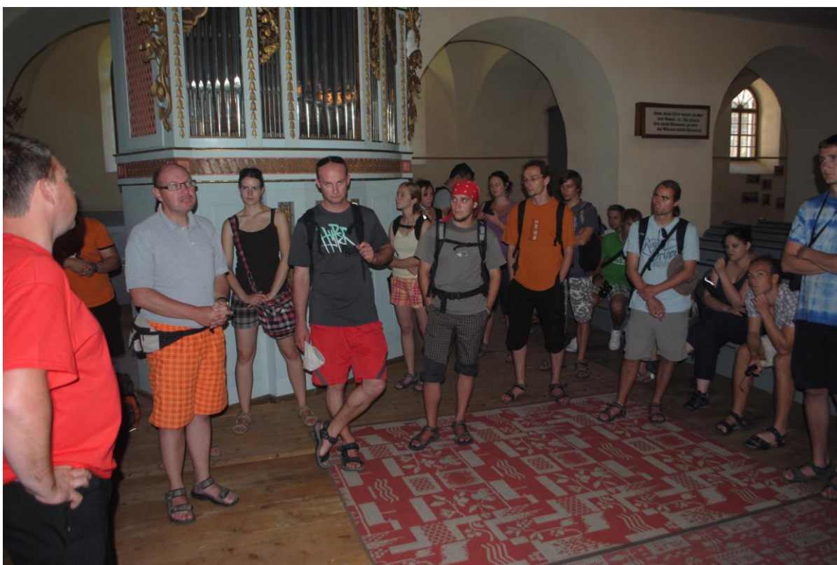
Obr.14 Prohlídka kostela – vlevo místní farář