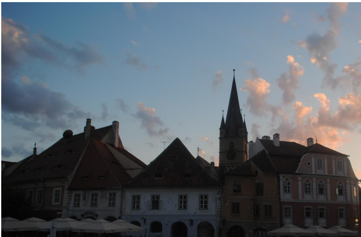
Obr. 11 Večerní Sibiu