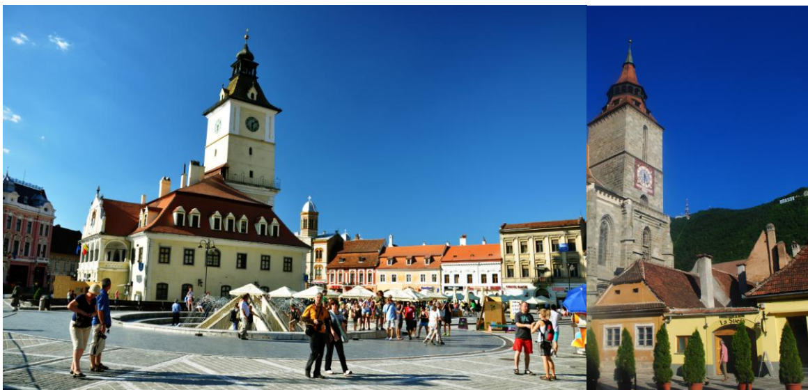
Obr.25,26 Braşov – centrum města a Biserica Neagra