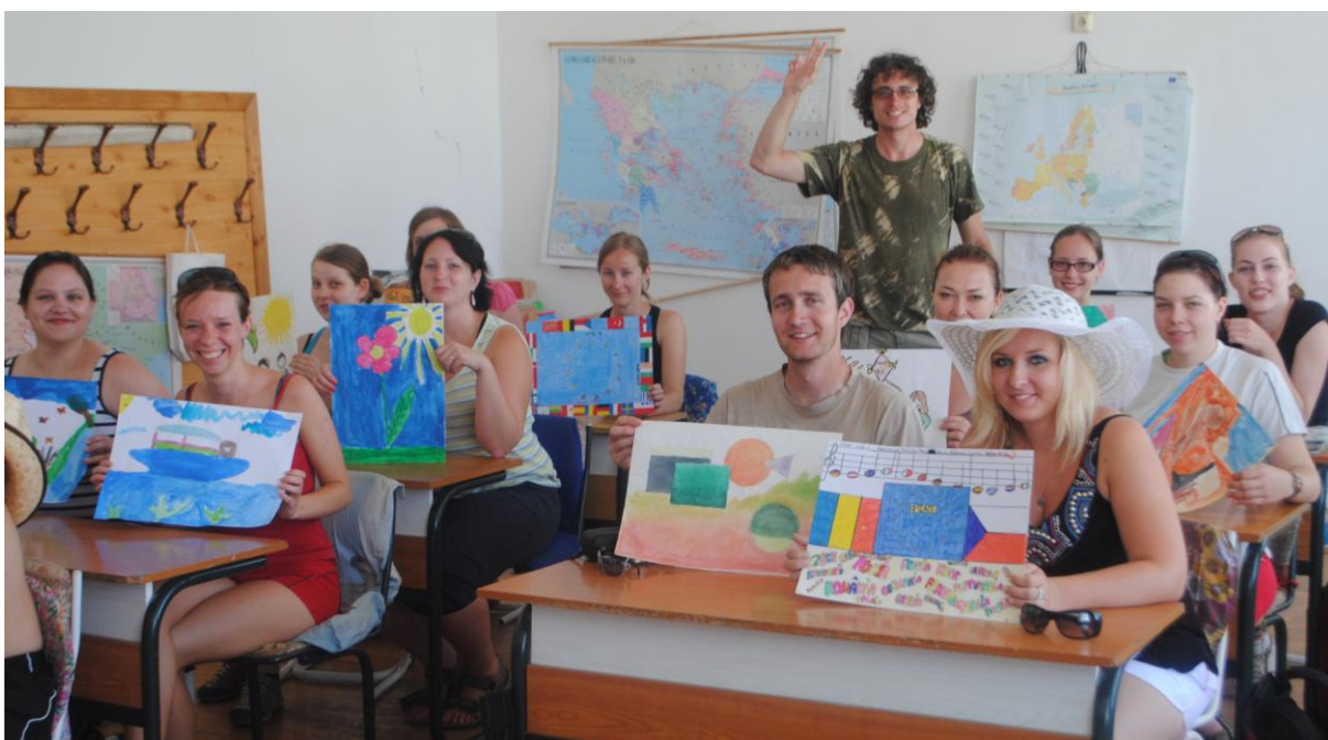
Obr.47 Znovu ve školních lavicích