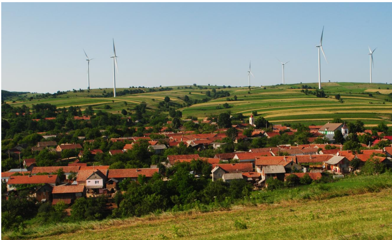
Obr. 42 Svatá Helena