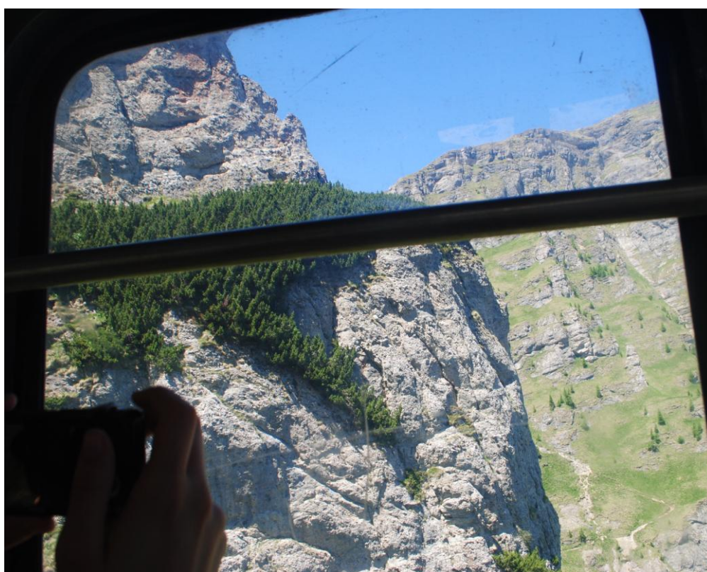
Obr. 18 Z lanovky na Bucegi