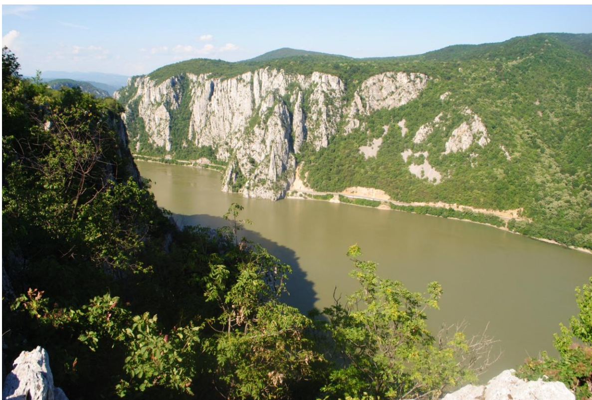
Obr.38 Cazanele Dunarii – Kazanská soutěška