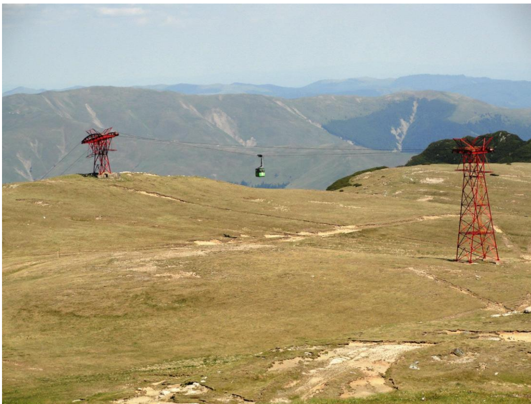
Obr. 21 Okolí lanovky