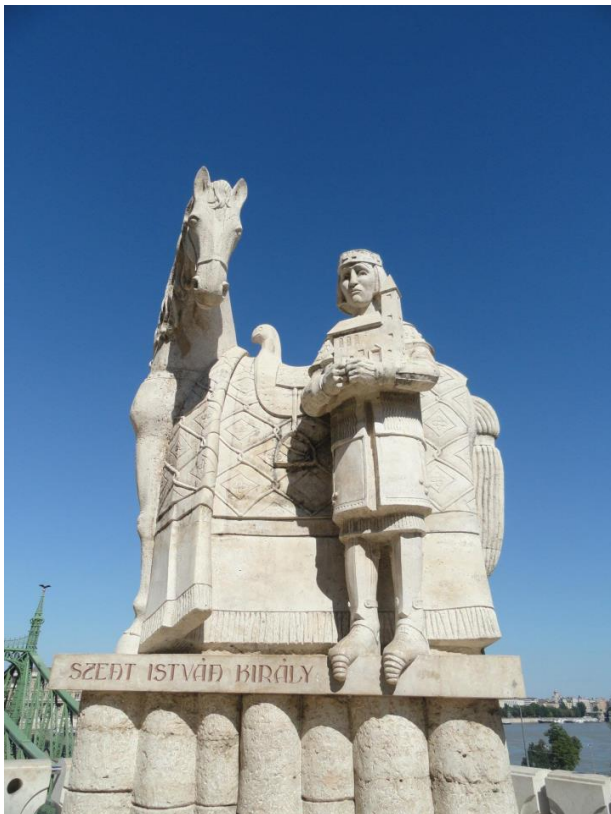
Obr. 4 Socha krále Štěpána