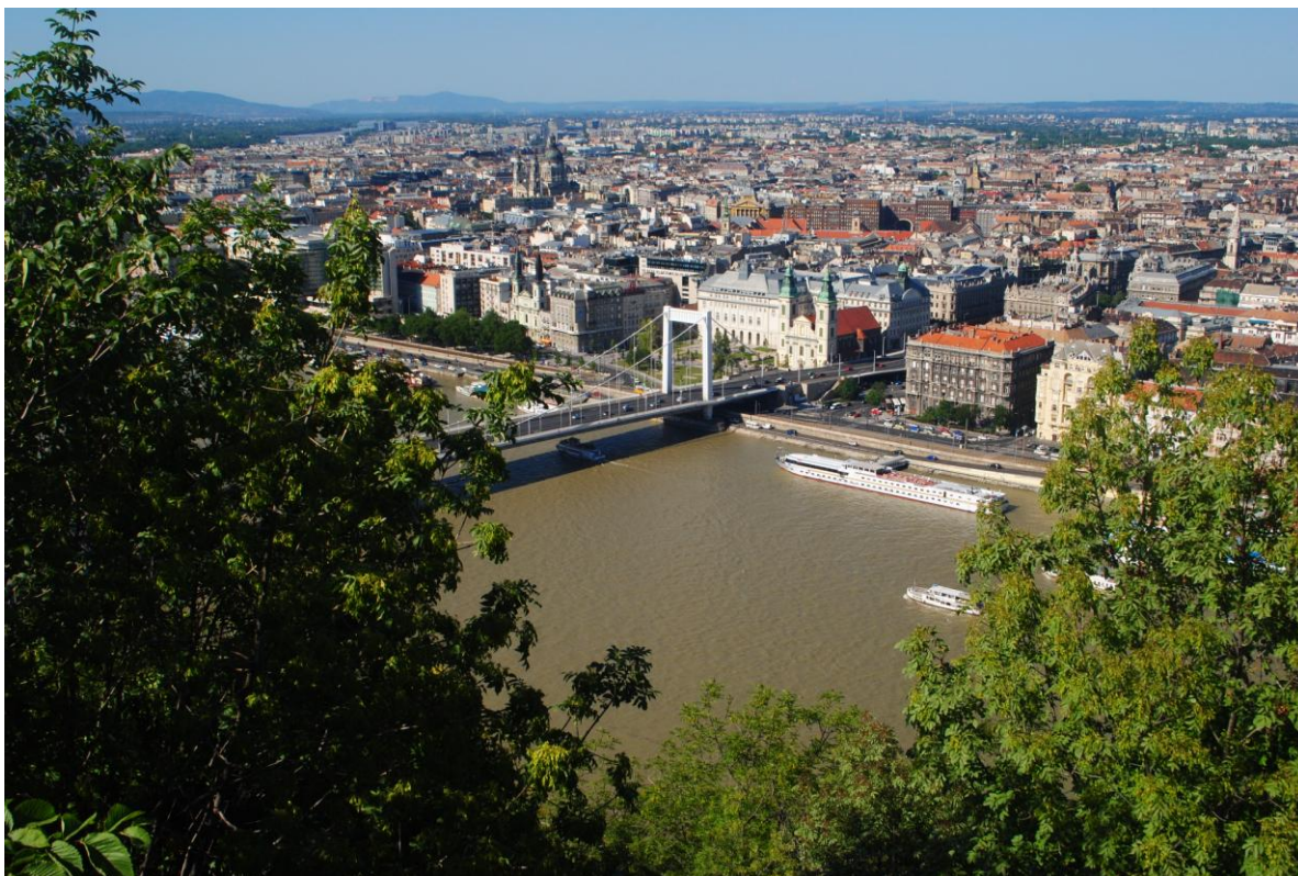
Obr.5 Pohled na Budapešť z Gellért Hegy