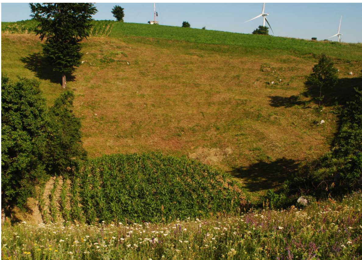
Obr. 50 Kukuřičné políčko v závrtu