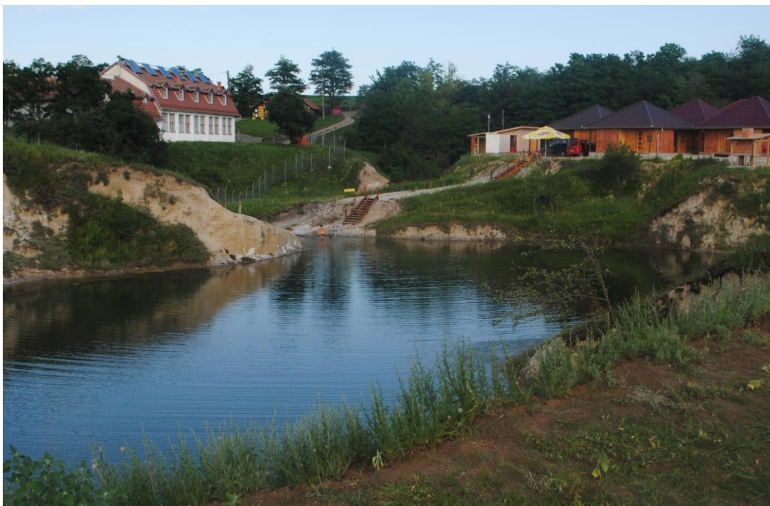
Obr.34 Ocna Sibiului – bývalé solné doly, dnes lázně