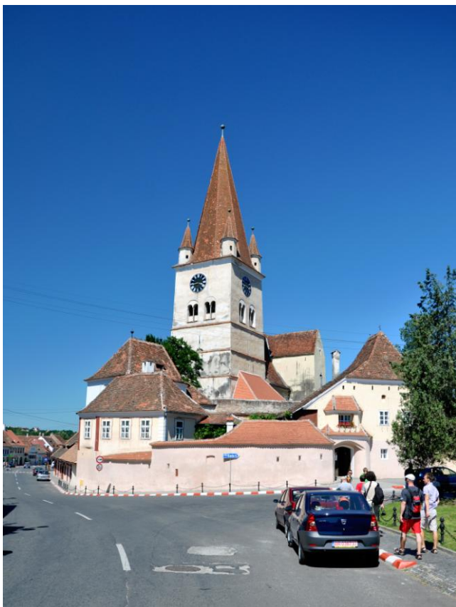
Obr.13 Opevněný kostel v Cisnadii