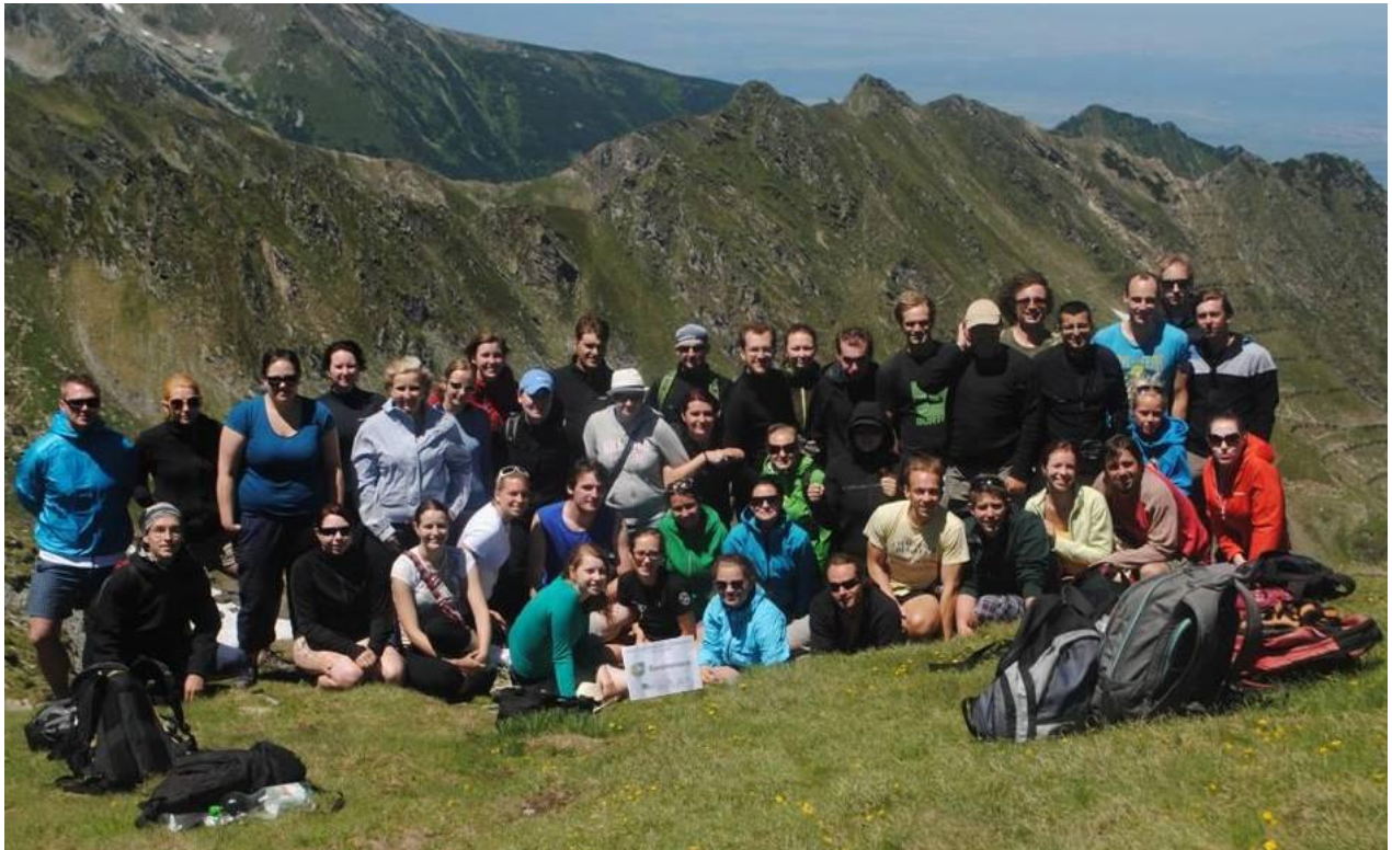
Obr. 28 Vsedle nad Balea Lac