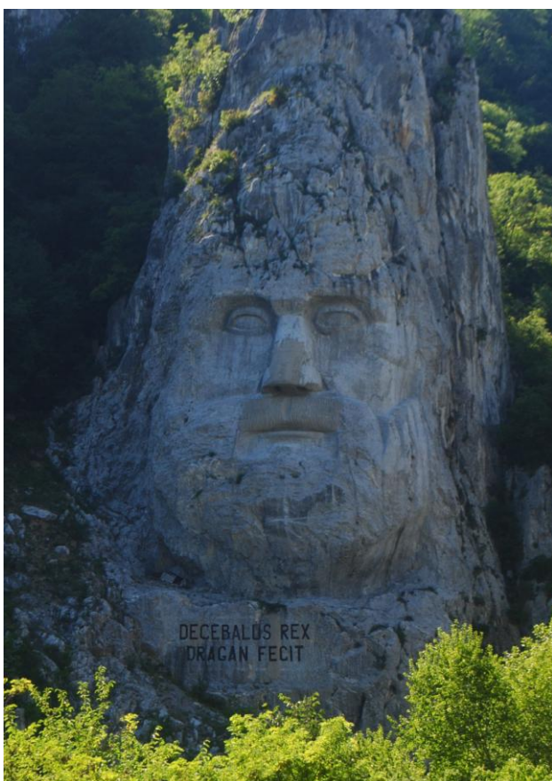
Obr.37 Skalní reliéf posledního dáckého krále Decebala na břehu Dunaje