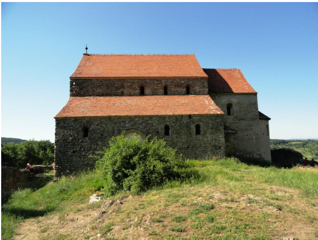
Obr. 15 Cisnadioara – bazilika sv. Mihaila