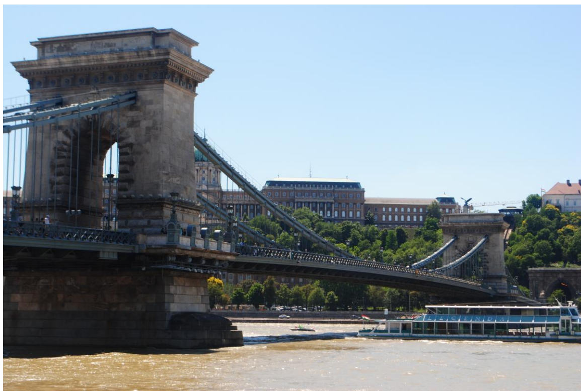
Obr.1 Dunaj v Budapešti – most Szabadság híd