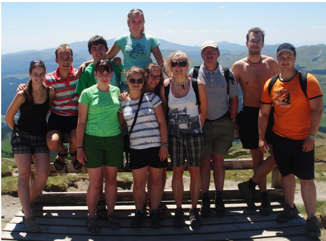
Obr.23 Část výpravy na Bucegi