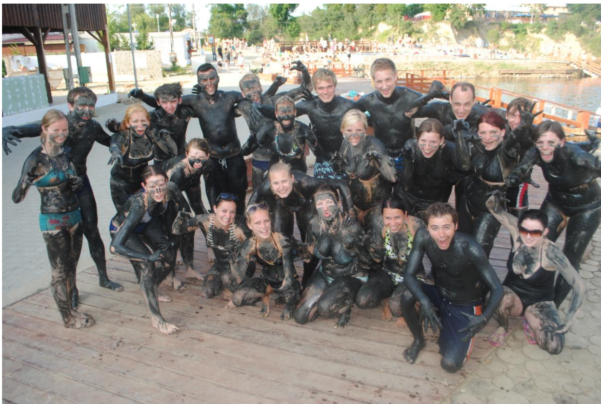
Obr.36 Studenti v léčivém bahně