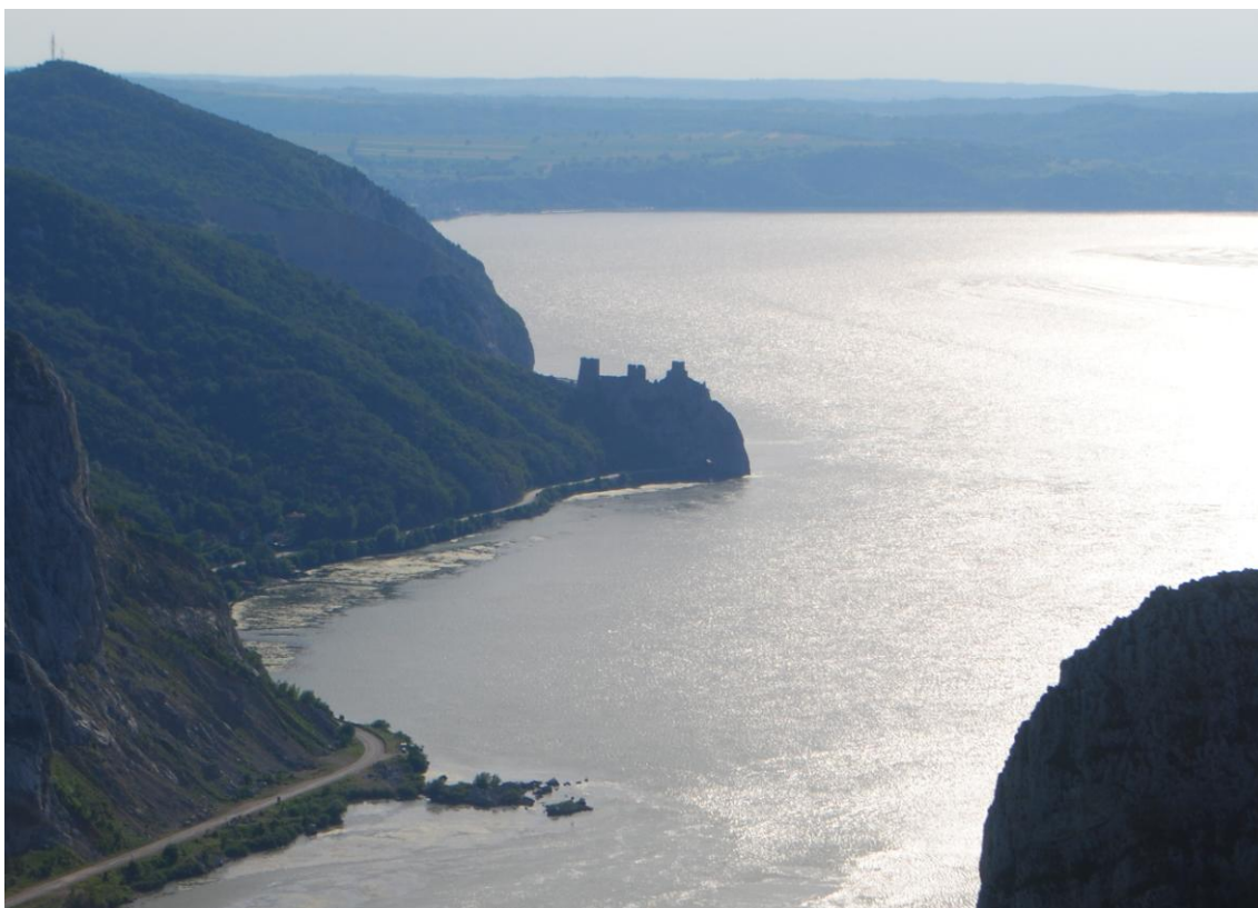
Obr. 41 Golubac – hrad na srbské straně Dunaje