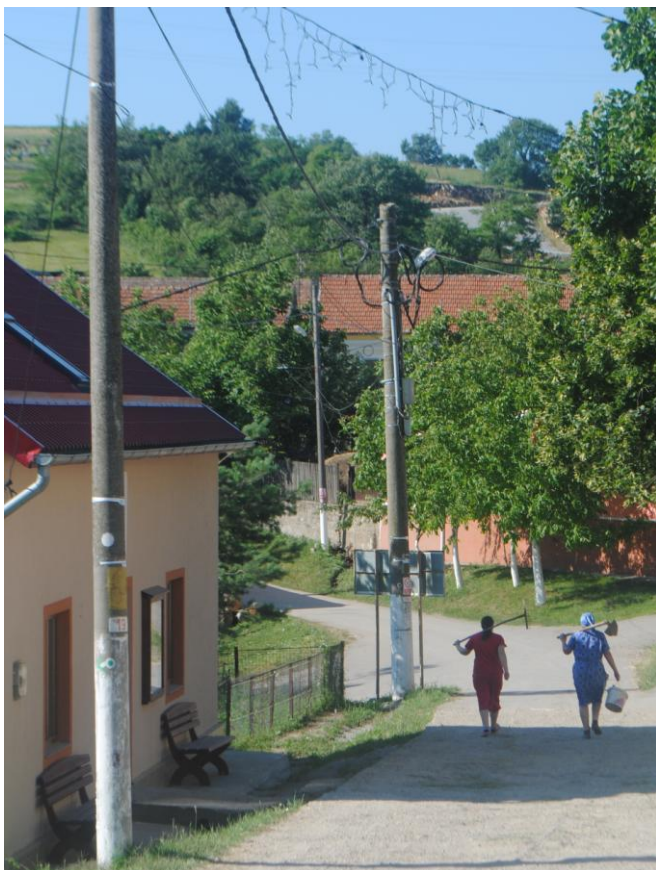
Obr.44 Místní ženy jdou na pole