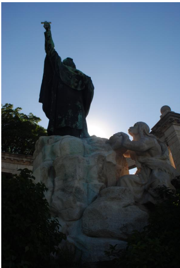
Obr.6 Socha sv. Gellérta