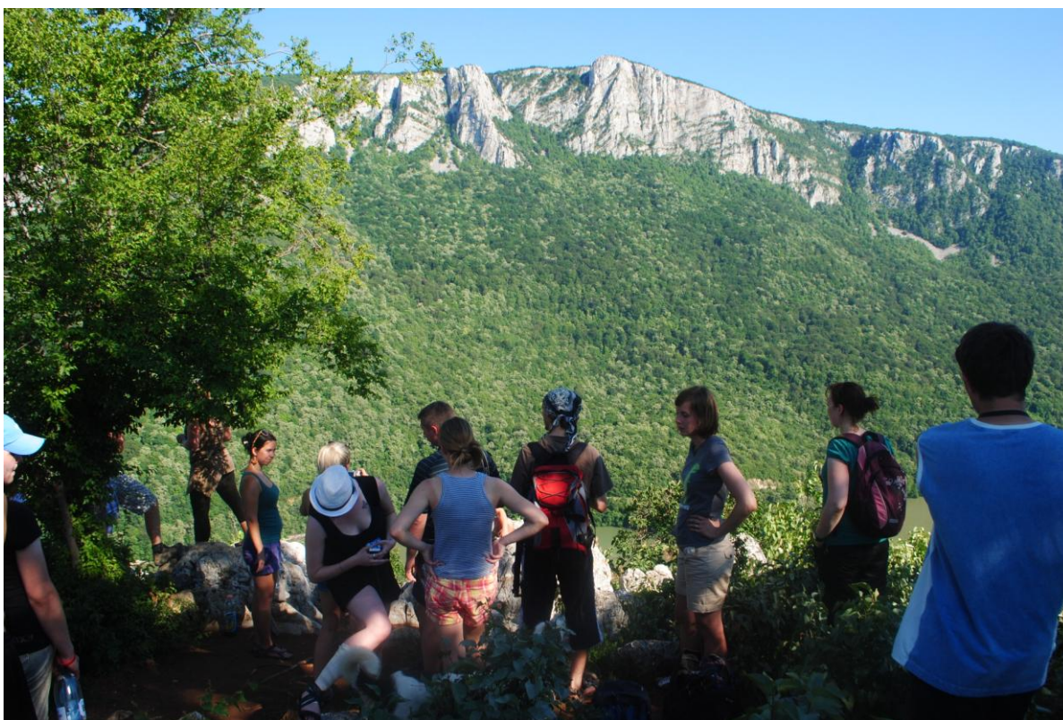
Obr.39 Kazanská soutěška leží na hranici mezi Rumunskem a Srbskem