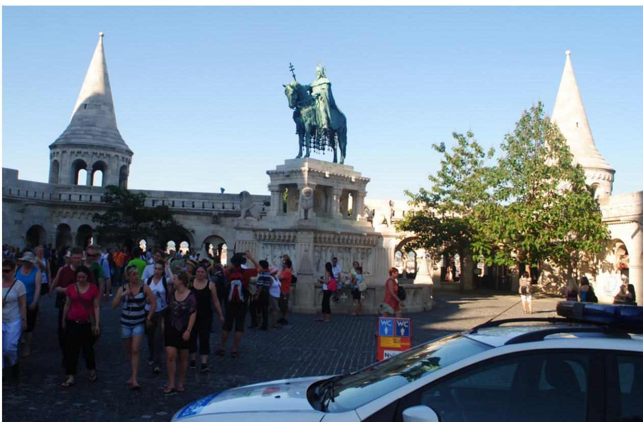
Obr.8 Rybářská bašta s pomníkem krále Štěpána