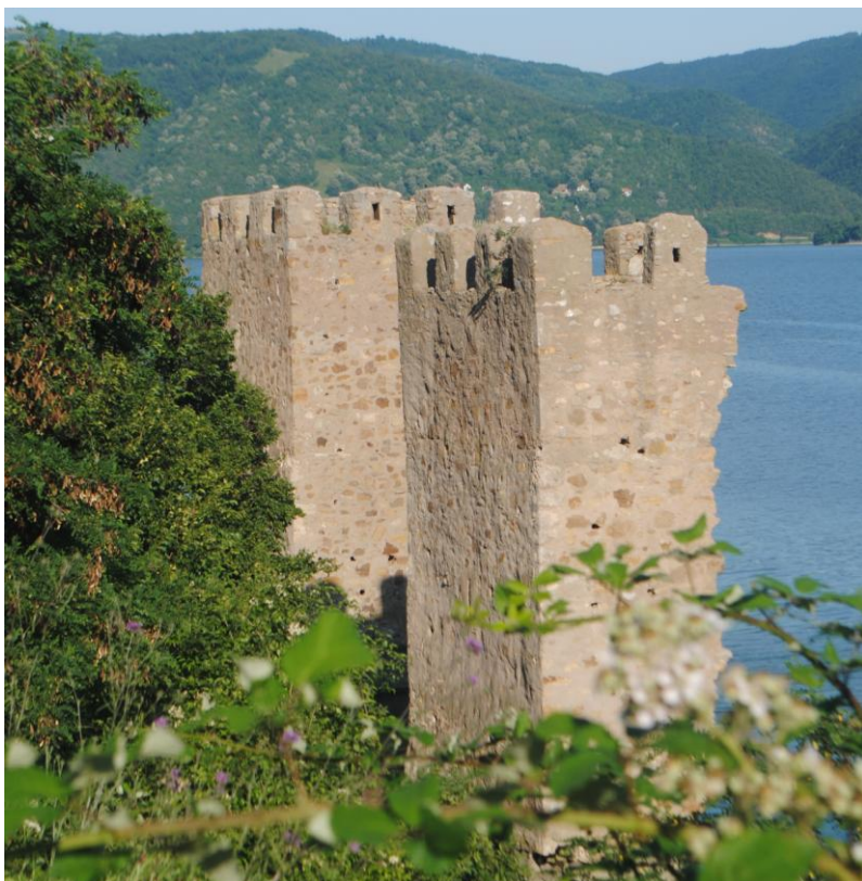
Obr.40 Vodní hrad na Dunaji