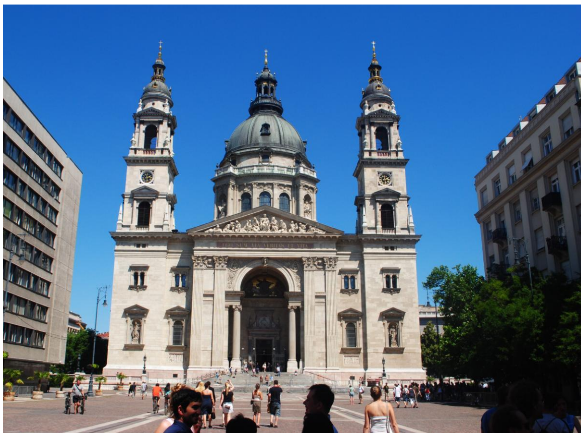
Obr.2 Bazilika sv. Štěpána