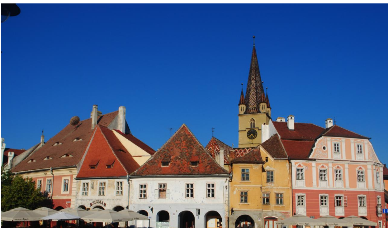
Obr. 10 Centrum Sibiu