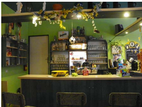
V hotelu je nejen bar, ale i jídelna