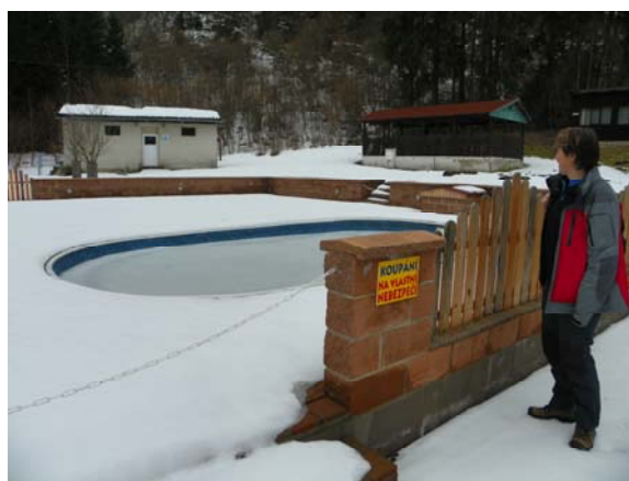
Bazén na koupání pro případ veder