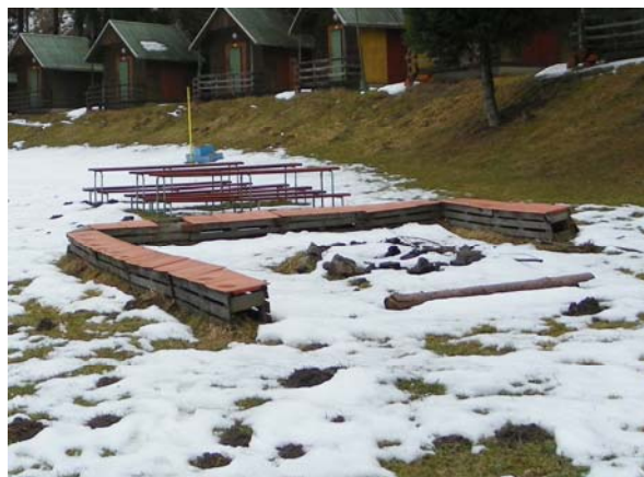
Ohniště v areálu na táboráky