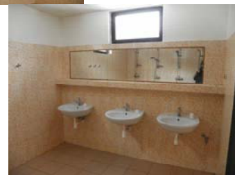
Sprchy a umyvadla v umývárně