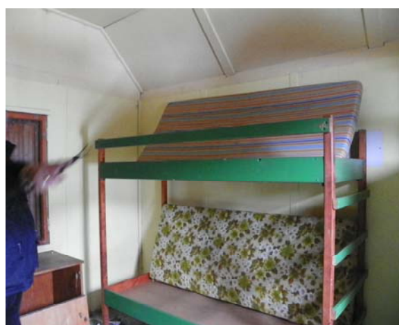
Vnitřek chatek (čtyřmístné) s palandami