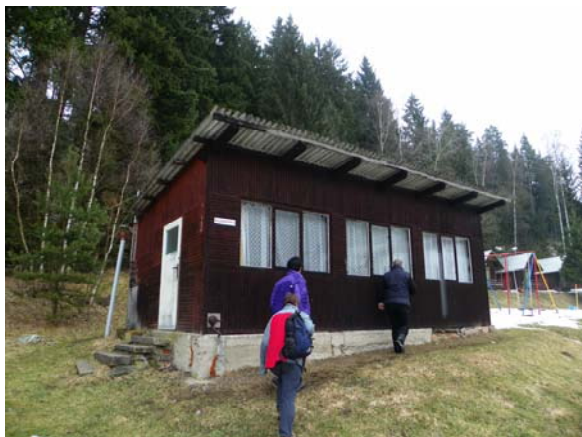
Klubovna pro přednášky