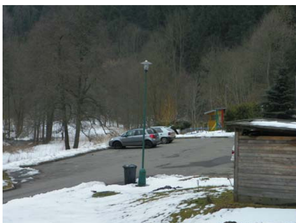
Parkoviště má dostatečnou kapacitu