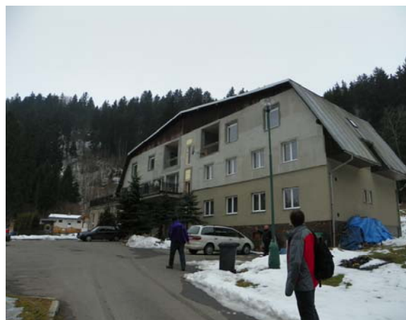
Hotel Otakar, kde se budeme stravovat