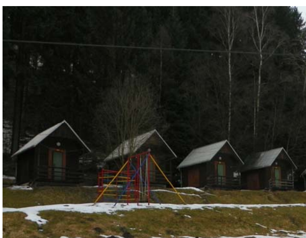
Naše ubytování v chatkách za hotelem