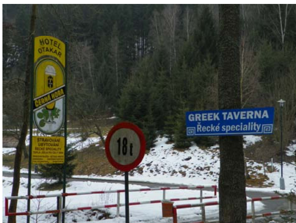
Rozcestí k hotelu