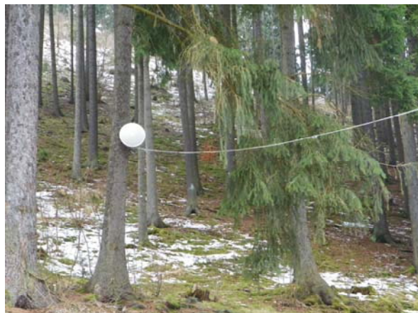
Wifi – internet bude tedy k dispozici