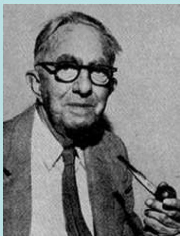
Frank Wilcoxon (1892 – 1965): Americký statistik a chemik

Nechť X_1, \dots, X_n je náhodný výběr ze spojitého rozložení s hustotou \varphi(x) , která je symetrická kolem mediánu x_{0,50} , tj. \varphi(x_{0,50} + x) = \varphi(x_{0,50} - x) . Nechť c je reálná konstanta.