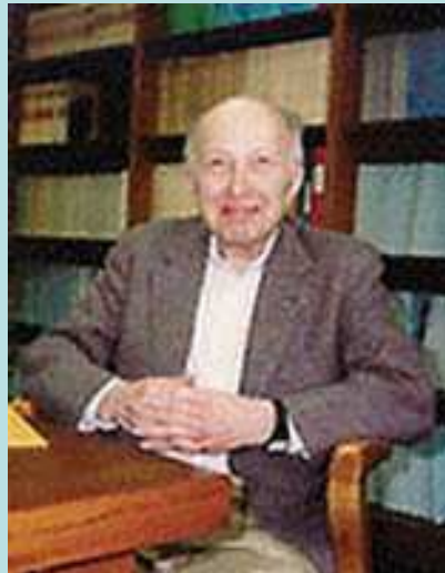
William Kruskal (1919 – 2005): Americký matematik