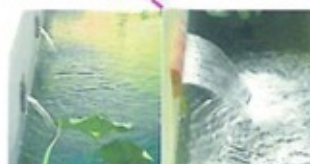
PŘEPAD DO VÍNOŘEČNÉHO PŮTOKA