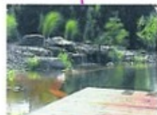
BIOTOP (PŘÍRODNÍ VODNÍ PLOCHA)