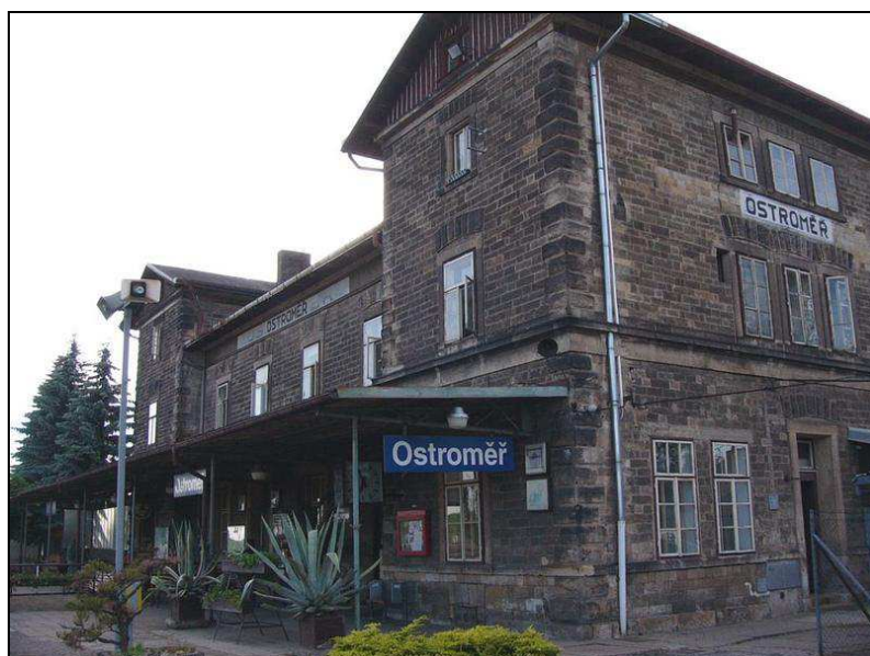
Obr. 3: Nejkrásnější nádraží ČR 2007 – Ostroměř

Město Jičín není jen okresním městem, ale i dopravním uzlem. Protínají se zde dvě významné silnice I. třídy – silnice č. 35 (Z Polského Zhořelce přes Liberec do HK, dále do Svitav a Olomouce) a silnice č. 16 (Ze Slaného přes Mělník, Mladou Boleslav do Trutnova a dále do Polska). Město má dobré spojení s velkým množstvím center naší republiky. Jezdí zde mnoho dálkových autobusů. Například do Prahy, která se nachází zhruba 85 km jihozápadně od Jičina, se autobusem můžete dostat pod hodinu a půl. Z okresního do krajského města se dostanete vlakem za hodinu a dvacet minut. Projedete přitom zastávkou Ostroměř, která byla vyhlášena nejkrásnějším nádražím roku 2007 a zároveň je jistým lokálním železničním uzlem.