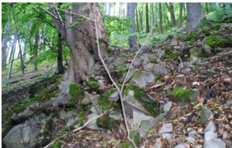
Obr 3. Suť na severozápadním svahu Hadího Kopce (L. Herman)