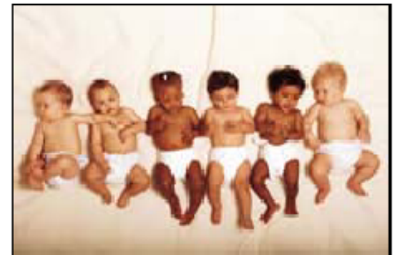
Babies born in highly polluted areas are more likely to be girls.

The team found that 48.3% of babies were female in the least polluted areas, but 49.3% were female in the dirtiest parts of town. After measuring the ratio of boys to girls born in all the areas, they calculated that 1,180 more babies would have been boys in the polluted areas if they had the same sex ratios as the cleaner areas. The team reported their findings on 17 October at the American