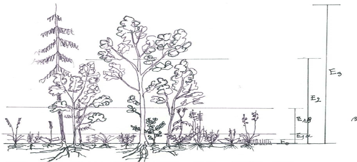
Patrovitost porostu v nadzemním a kořenovém prostoru