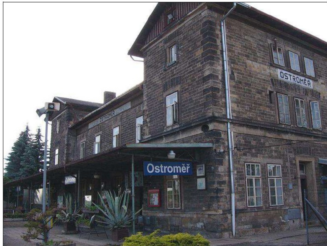
Obr. 3: Nejkrásnější nádraží ČR 2007 – Ostroměř