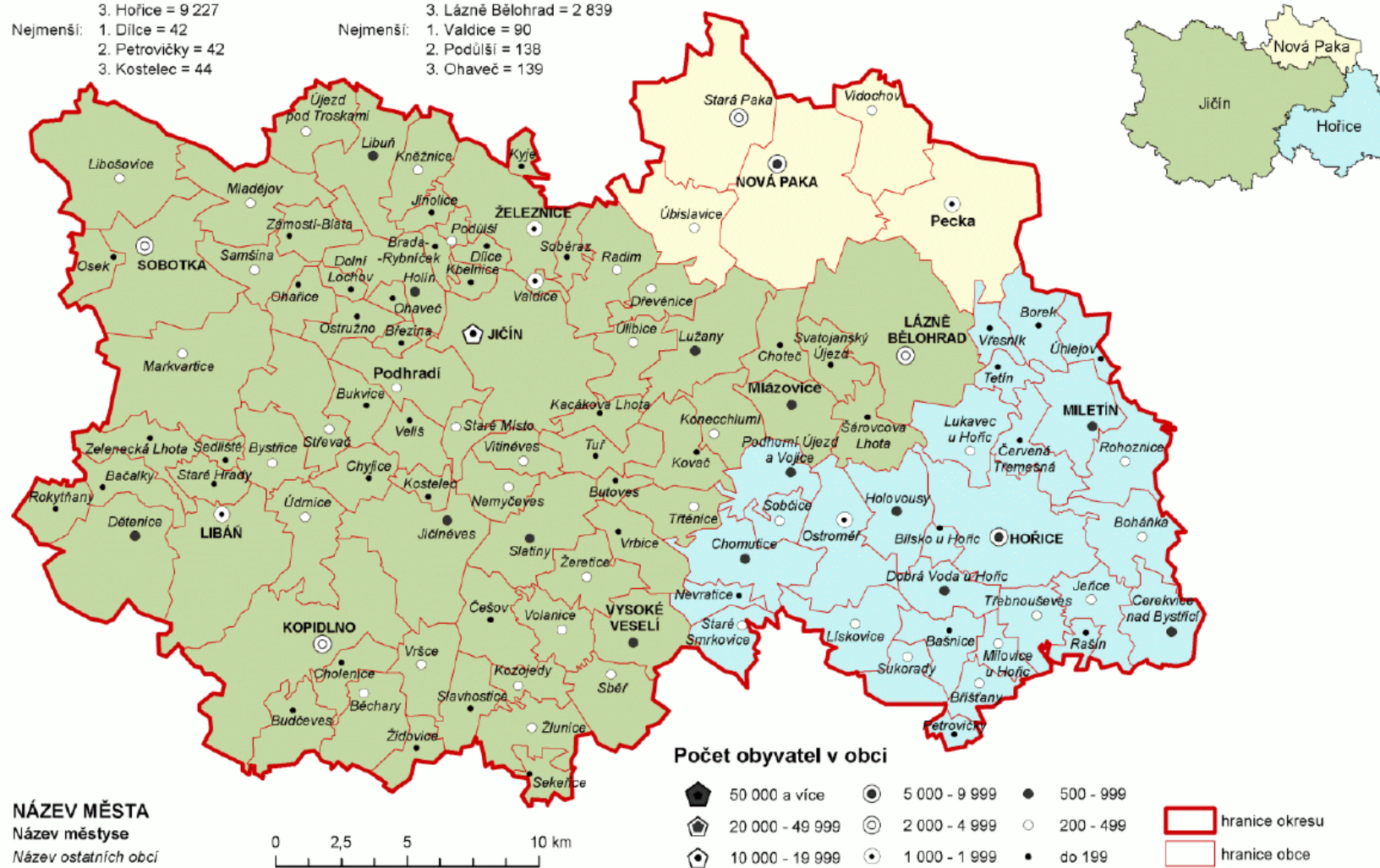
Obr. 2 Mapa okresu Jičín

Správní obvod obce s rozšířenou působností