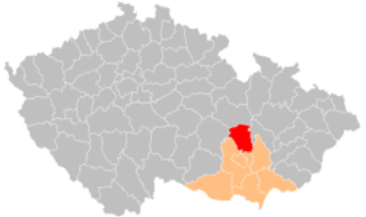
Obr. 1: Poloha okresu Blansko v rámci ČR a JM kraje