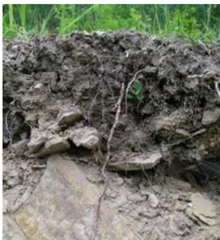
Obr 4. Půdní profil ve Chvalčovském lomu (L. Herman)

Převládajícím půdním typem jsou různé typy kambizemí (Tomášek a kol. 1989). Jedná se o kambizemě typické, lehčí až středně těžké, které mají světle hnědou až okrovou barvu. V severní části mapovaného území přechází kambizemě v oglejenou hnědozem. Na suti pod Hadím kopcem se vyvíjí rankerové půdy.