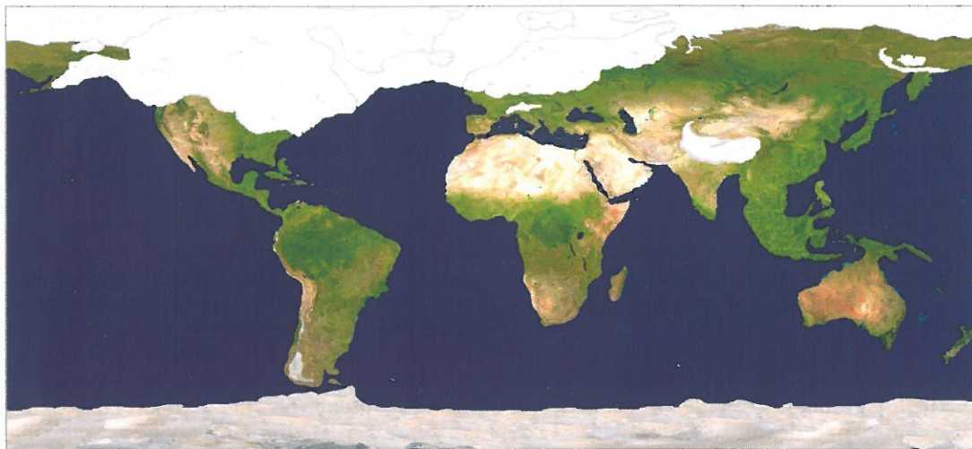
1. Svět na vrcholu předposlední ledové doby, pravděpodobně nejdrsnější ze všech chladných oscilací čtvrtohor. Bílou barvou jsou znázorněny nejen ledovce, ale i zamrzlá mořská hladina.

skupina badatelů se domnívá, že se prales v ledových dobách rozpadal na několik ostrovů oddělených plochami travnatých savan [3]. Jedině tak lze přý vysvětlit existenci horkých míst biodiverzity ( hotspots ) v rámci dnes opět homogenního lesního pokryvu. Opačný názorový tábor [4] má však v zásobě pádné protiargumenty. Jedním z nich je výsledek výzkumu výplavového kužele Amazonky uloženého pod ústím řeky na dně Atlantiku [5]. Vrty tam zachytily souvislý sled usazenin sahající 50 000 let do minulosti. V jílovitých sedimentech jsou dochována pylová zrna naplavená řekou z celého jejího obrovského povodí. V úseku, který odpovídá poslední době ledové, se ale nedaří pozorovat jakoukoliv změnu ve prospěch šíření sušší savanové vegetace na úkor deštného pralesa. Poslední glaciál byl přitom jeden z nejdrsnějších v průběhu celých čtvrtohor.