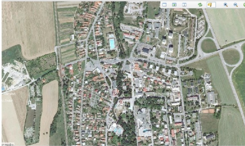
Obr. 11: Turčianske Teplice na leteckých snímkach z roku 1950 (hore) a 2015 (dole).