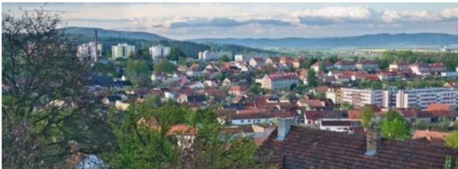
Obr. 18: Současný snímek Velkých Opatovic