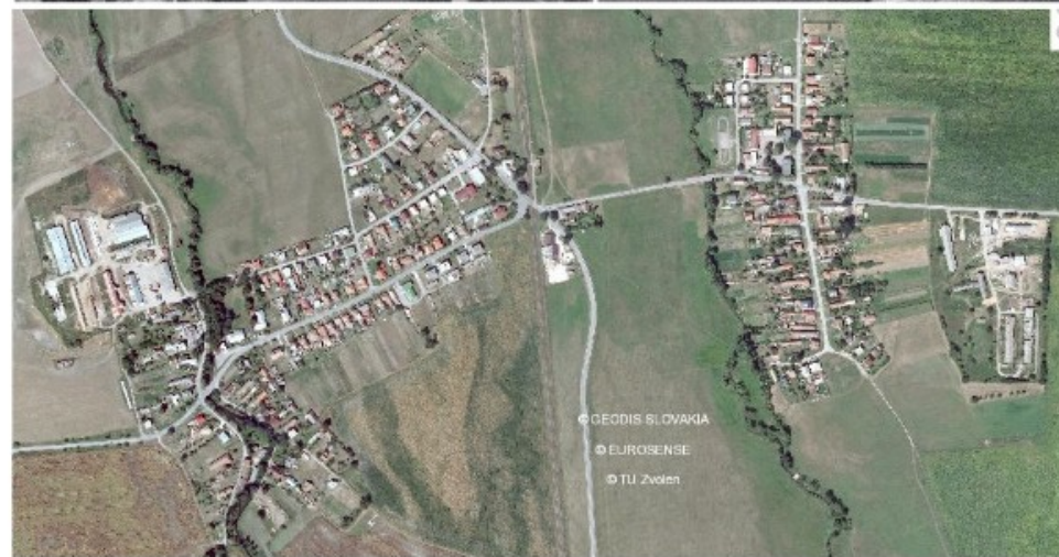
Obr. 13: Malý Čepčín a Bodorová na leteckých snímkach z roku 1950 (hore) a 2015 (dole).