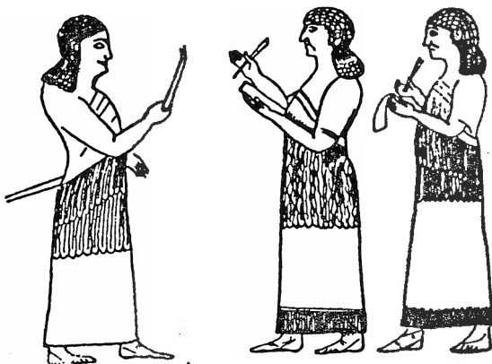
ASYRSKÝ PÍSAŘ S TABULKOU ARAMEJSKÝ PÍSAŘ S PERGAMENEM