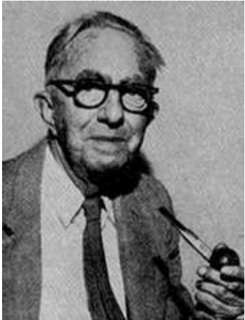
Frank Wilcoxon (1892 – 1965): Americký statistik a chemik

Nechť X_1, \dots, X_n je náhodný výběr ze spojitého rozložení s hustotou \varphi(x) , která je symetrická kolem mediánu x_{0,50} , tj.