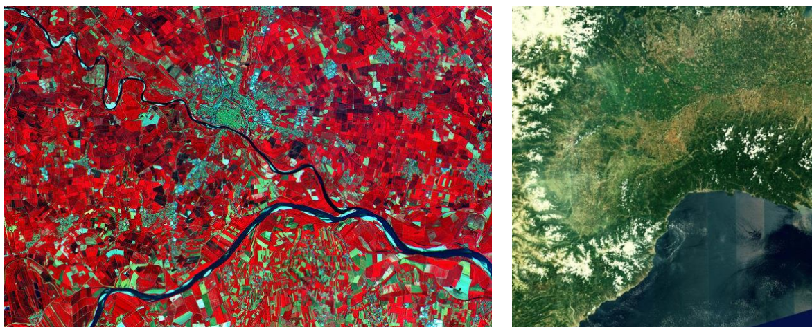
Obrázek 3: První zveřejněné snímky Sentinelu 2.

V tuto chvíli jsou na https://scihub.esa.int přístupná testovací data a první pořizený snímek (obr. 3), data Sentinelu 2 by měla být pravidelně poskytována do 3 měsíců od startu.