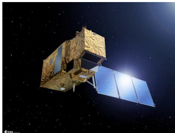
Obr. 1: Start (vlevo) a vizualizace (vpravo) Sentinelu 2A.