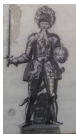
Socha Goliáše od Matyáše Bernarda Brauna v Kuksu