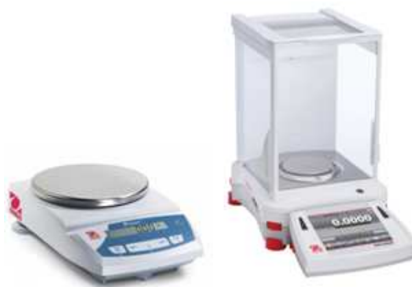
Ukázka předvážek (A) a analytických vah (B)

Analytické váhy jsou váhy s váživostí do 200 g a s přesností na 0.0001g. Tyto váhy používáme pro velmi přesná navažování látek nebo pro navažování velmi malých množství látek (<0.1g).