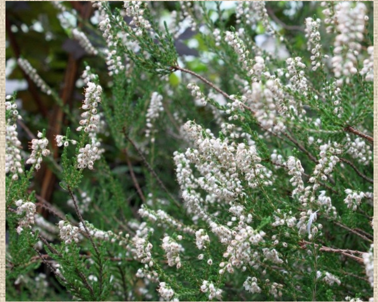
Vřes obecný ( Calluna vulgaris L., Hull.)