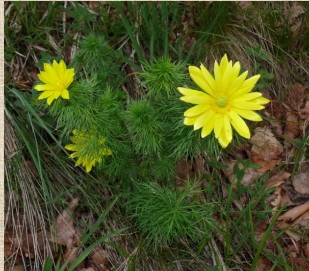
Hlaváček jarní ( Adonis vernalis L.)