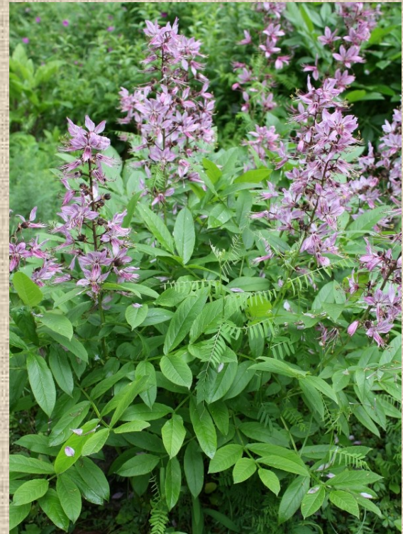
Třemdava bílá ( Dictamnus albus L.)