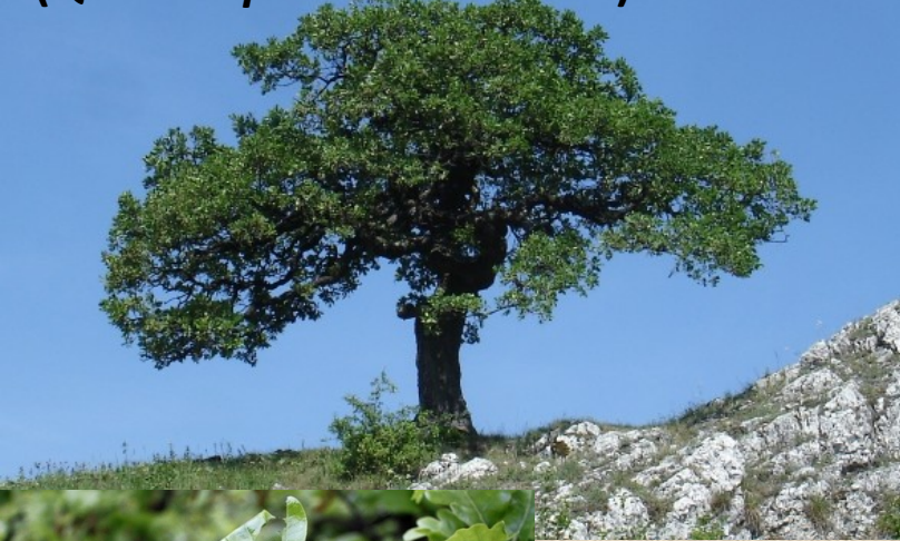
Dub pýřitý (šípák) ( Quercus pubescens Willd.)