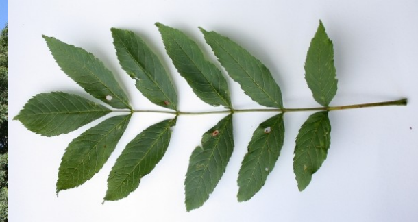
Jasan ztepilý ( Fraxinus excelsior L.)