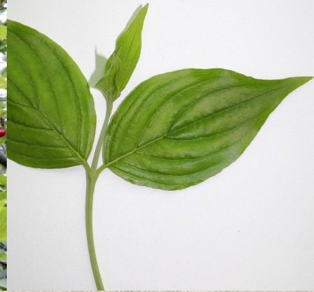
Dřín jarní ( Cornus mas L.)