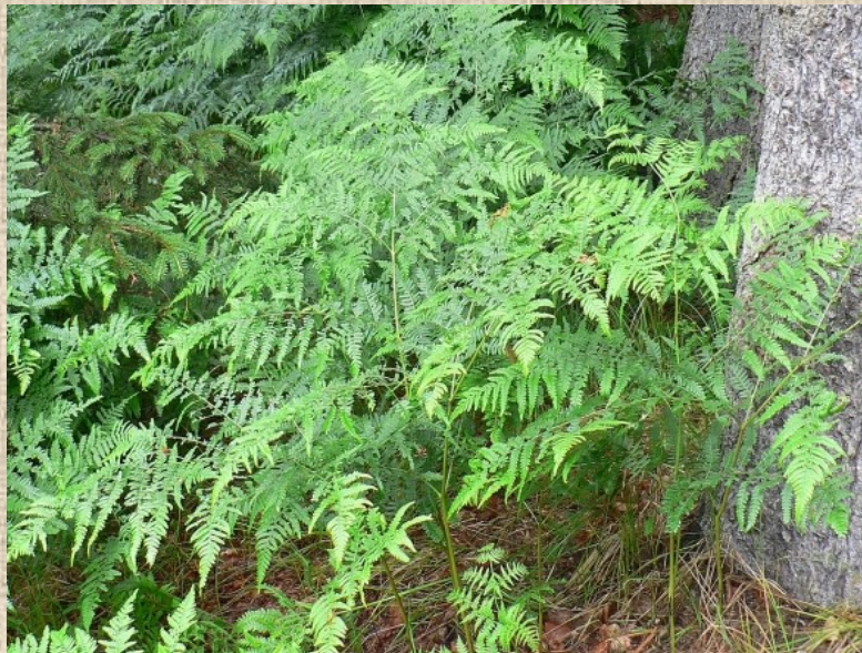
Hasivka orličí ( Pteridium aquilinum L., Kuhn)