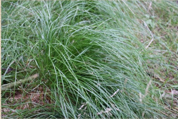
Metlička křivolaká ( Avenella flexuosa L.)