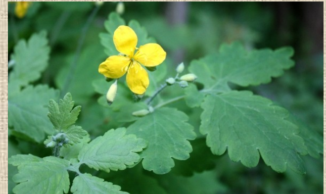
Vlaštovičník větší ( Chelidonium majus L.)