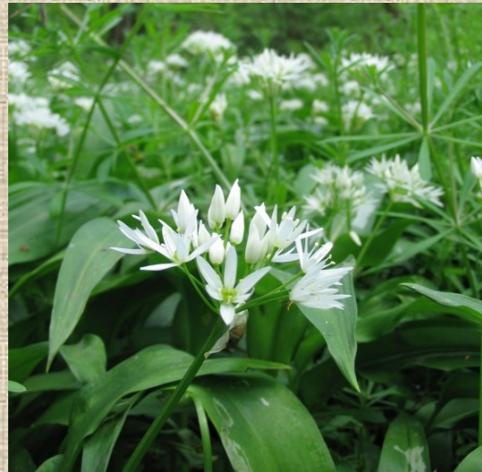
Česnek medvědí ( Allium ursinum L.)