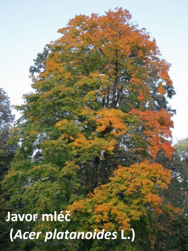
Javor mlíč ( Acer platanoides L.)