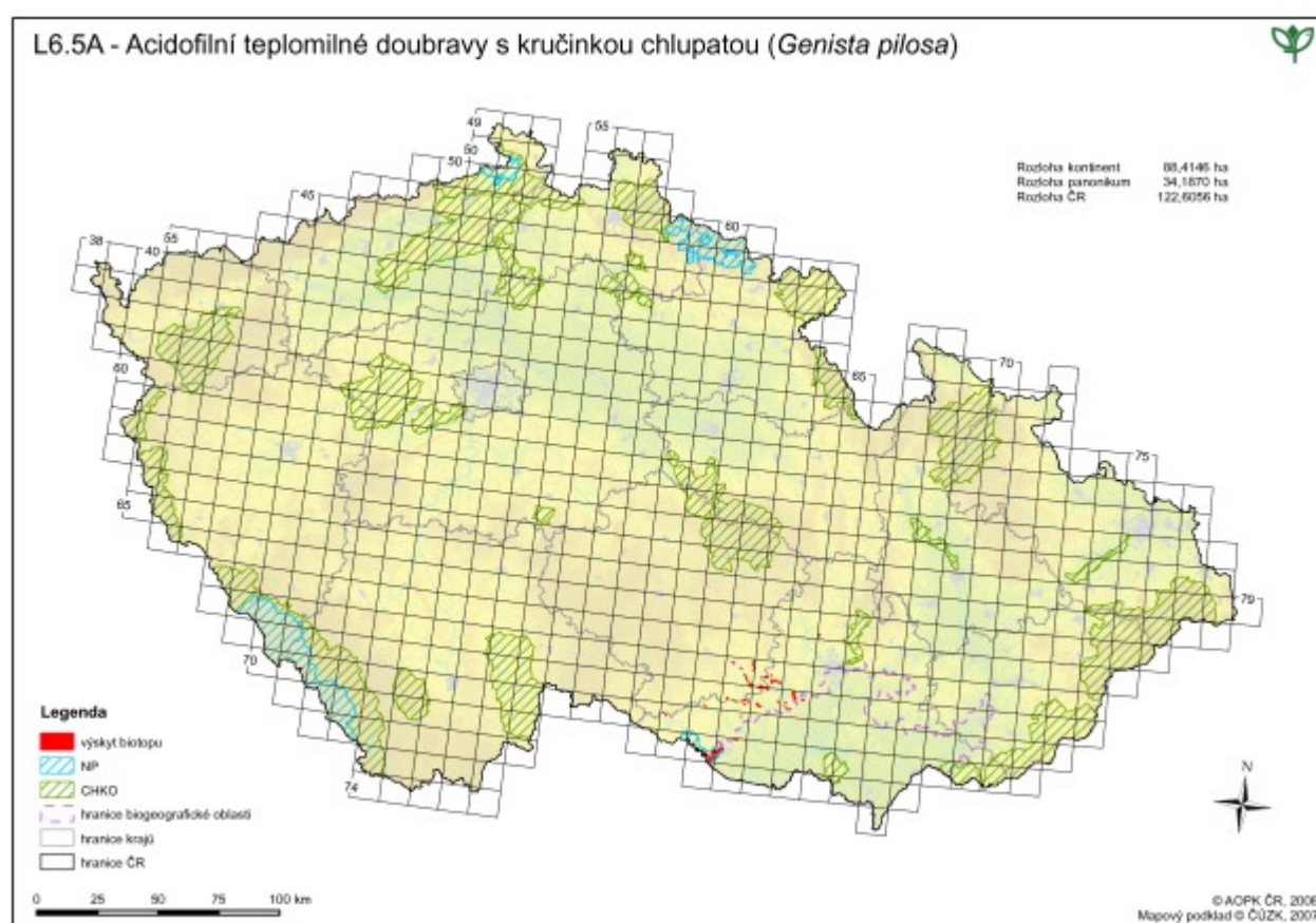
Obr. 2 Rozšíření biotopu L6.5A v ČR, dle výsledků z mapování biotopů