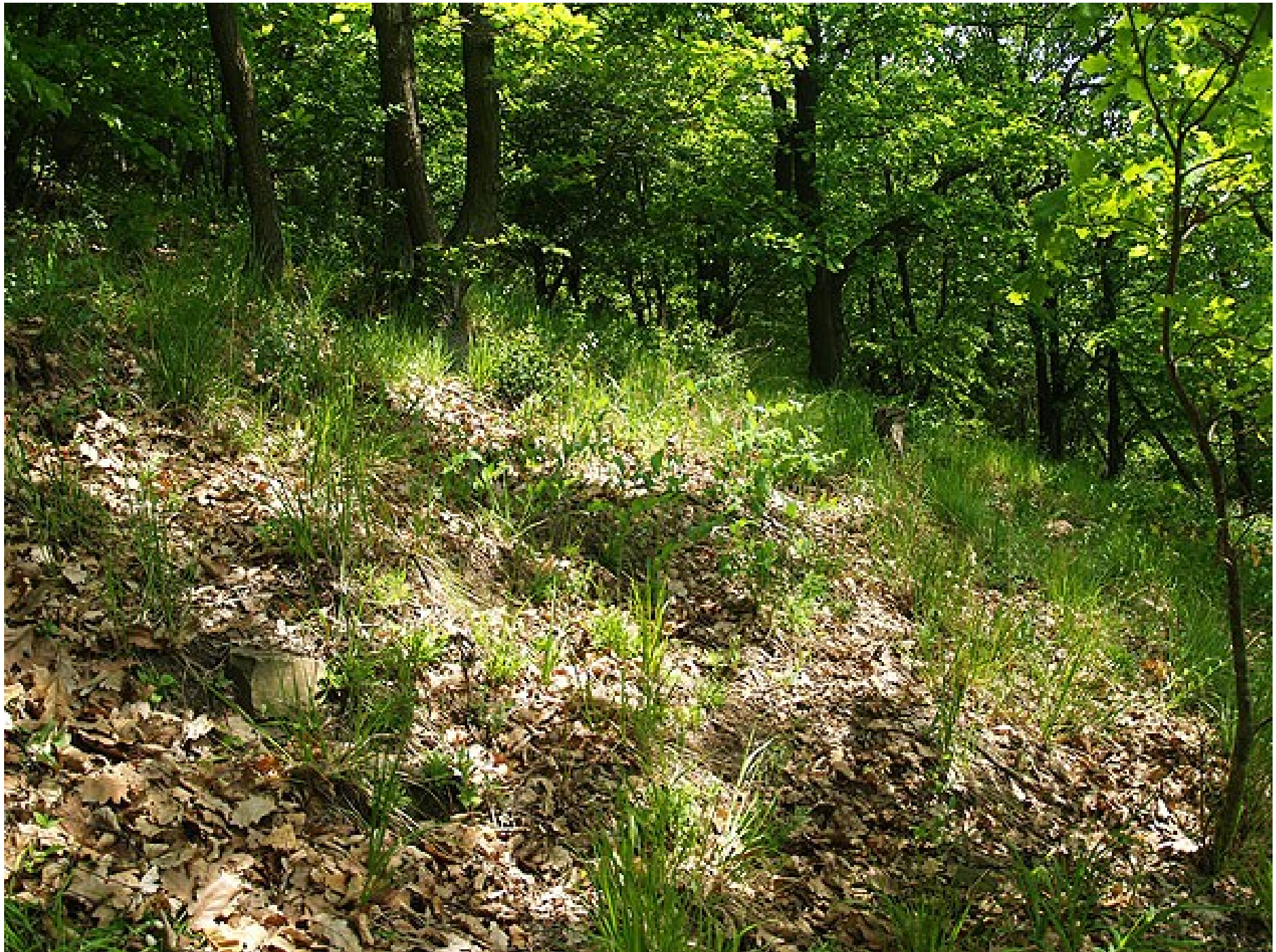
Obr. 4 L6.5 Acidofilní teplomilné doubravy