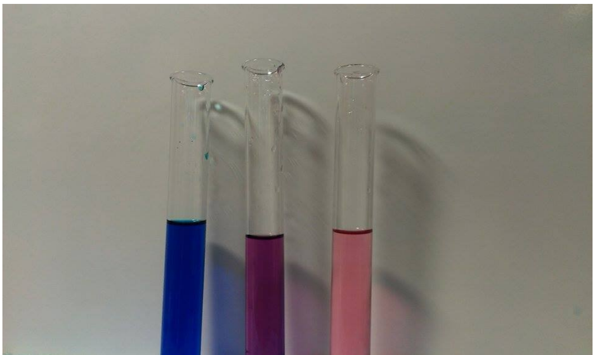
Obrázek 1: Porovnání barev komplexních sloučenin kobaltu při změně koncentrace

Do 3 zkumavek se nalije 2 cm vysoká vrstva srovnávacího roztoku. Poté se do jedné přidá cca 1 cm vysoká vrstva koncentrované HCl, do druhé zkumavky se přidá stejné množství destilované vody. Barvy všech tří vzniklých roztoků se opět porovnají.