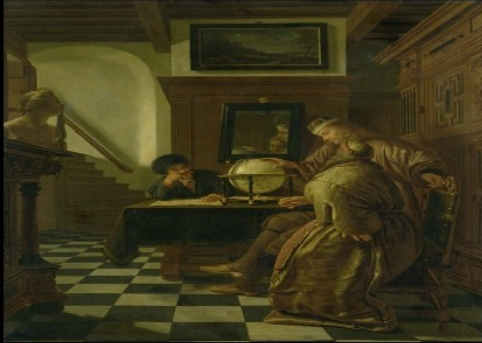
What Geographers (apparently) once did