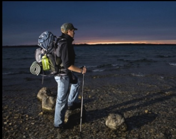
What I thought I'd be doing