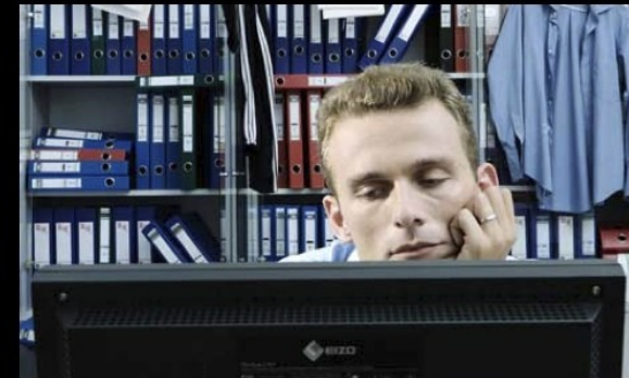
What I actually do