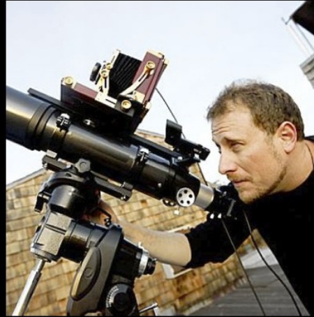
What the media thinks Geographers do