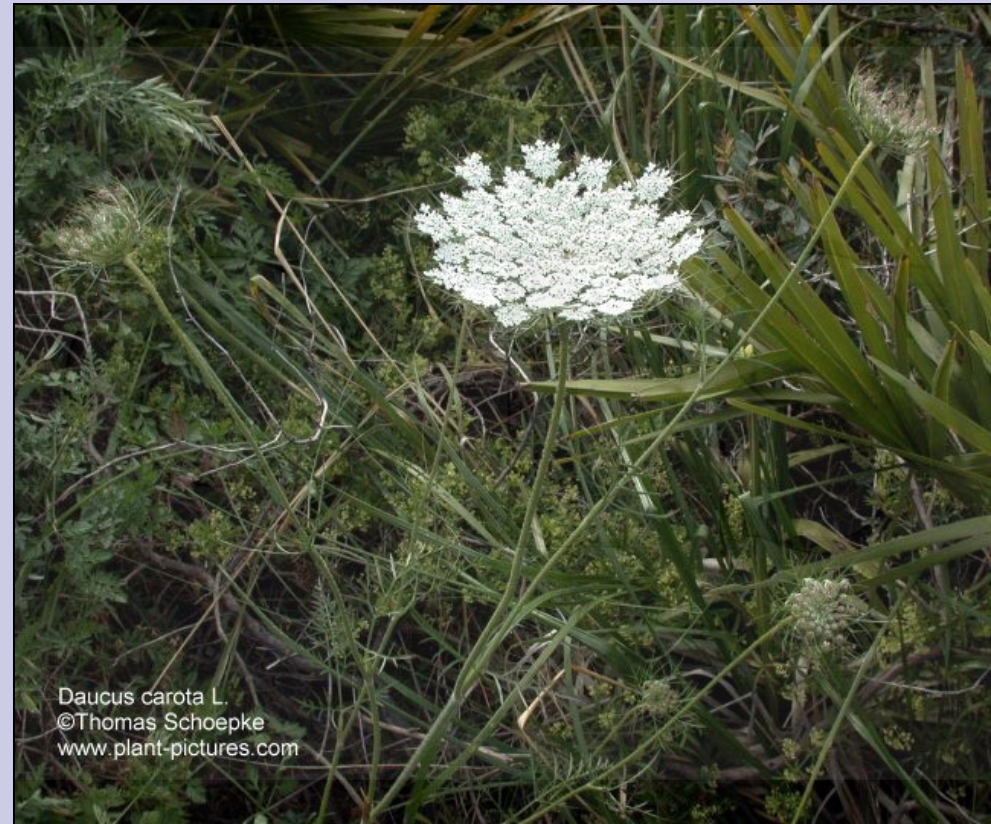
Daucus carota L.