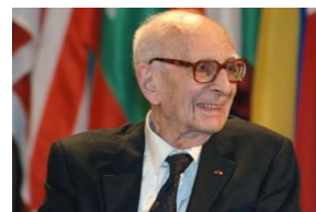
Claude Lévi-Strauss 1908-2009

→ úzké sepětí etnologie, etnografie a sociologie → empirické výzkumy mimoevropských kultur a teoretické koncepce formující francouzskou verzi sociální antropologie vrcholící dílem C. Lévi-Strausse (1908-2009), který považoval etnografii za empirickou fázi antropologického výzkumu a etnologii za syntetickou fázi výzkumu zpracovávající etnografická data v historické, geografické a systematické perspektivě