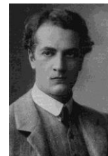
A. R. Radcliffe-Brown 1881-1955

→ diachronní vysvětlení historických událostí v čase a sociologicky induktivní obecně platné zákonitosti → etnologie představuje historickou disciplínu, která rekonstruuje dějiny kultury, zatímco sociální antropologie představuje induktivní výzkum, jehož cílem je postihnout, objasnit a formulovat obecné zákonitosti tvořících základ sociokulturních jevů; první fázi výzkumu tvoří etnografie, tj. empirický sběr dat, s nimiž následně pracuje jak sociální antropologie, tak i etnologie