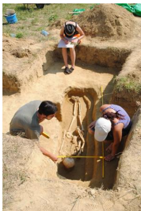
Diváky „Padělky nad humny“ 2013