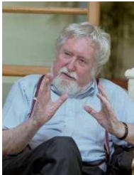
Clifford Geertz 1926-2006