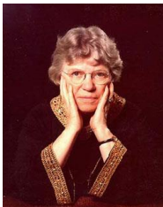
Margaret Mead 1901-1978

→ jednotlivé kultury představují integrované systémy organizované v souladu s „ kulturní gramatikou “ dané společnosti; v kultuře existuje skrytý organizační princip (konfigurace) dávající kultuře její jedinečnou tvář