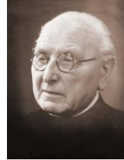
Wilhelm Schmidt 1868-1954

→ etnologie relativně autonomní vědecký obor studující svět preliterárních společností; škola kulturních okruhů – úkolem etnologie je empirický výzkum domorodých národů s cílem pochopit význam předmětů a jevů kultury a objasnit jejich vzájemné vztahy; etnografie představuje empirickou fázi výzkumu přímo v terénu, zatímco etnologie provádí komparaci a zobecnění etnografického materiálu v mezikulturní a historické perspektivě (→ sociokulturní antropologie)