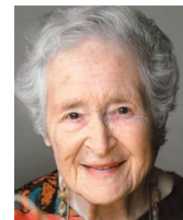
Mary Douglas 1921-2007