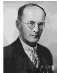
Bronisław K. Malinowski 1884-1942