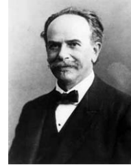
Franz Boas 1858-1942