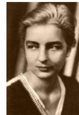
Ruth F. Benedict 1887-1948