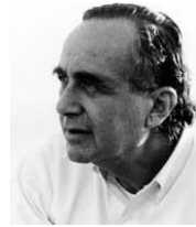
Marvin Harris 1927-2001